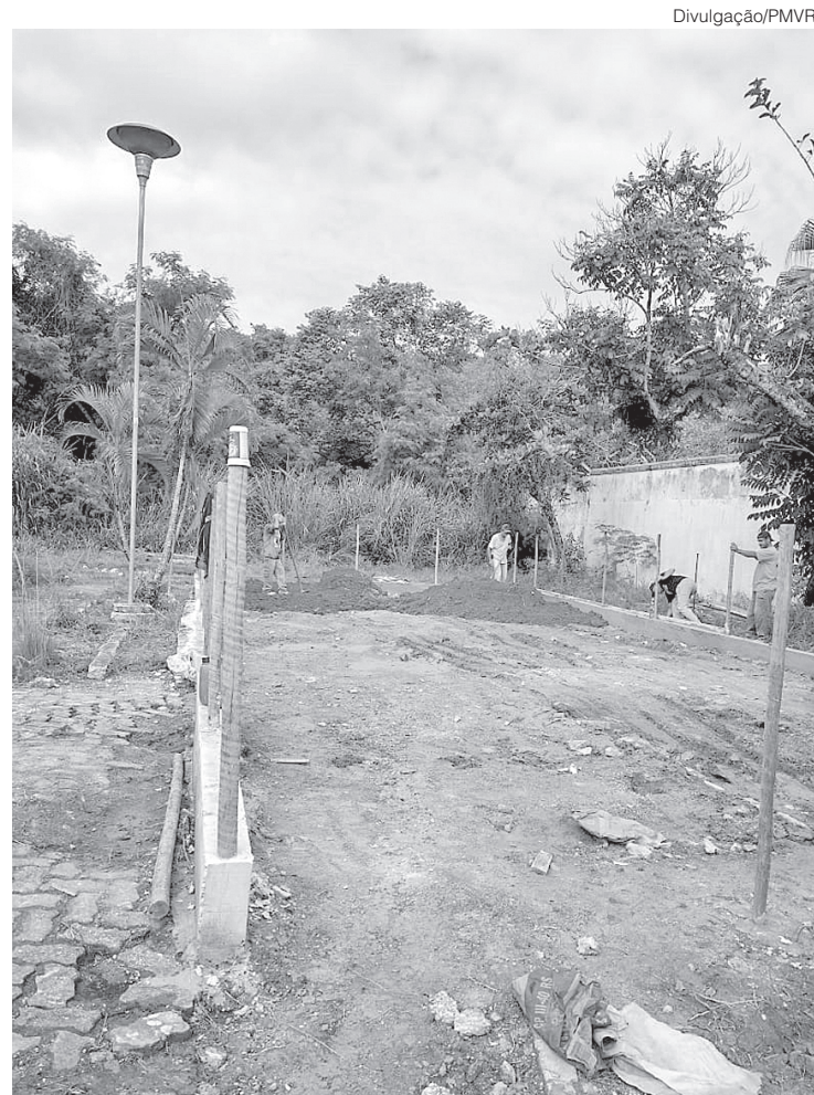
Plantios das áreas serão realizados através de parceria com a secretaria de Educação

- Estamos fechando uma parceria com a Secretaria