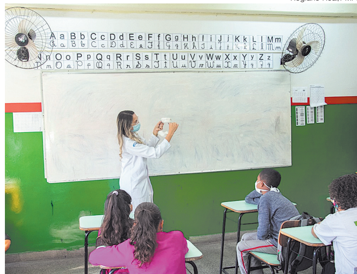
Kits foram entregues para estudantes das unidades de ensino de Porto Real