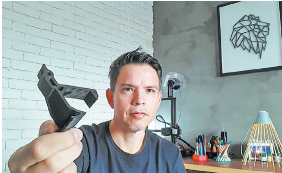
Hospital da região se beneficiou de tecnologia 3D para conserto de aparelho de imagem

- Por ser grupo de risco, não fui ao hospital para conhecer o equipamento e o que poderia ter causado a fratura da peça, contudo, após fazer algumas análises e impressões de teste, conseguimos desenvolver uma peça idêntica à quebrada - comentou. Segundo ele, cerca de