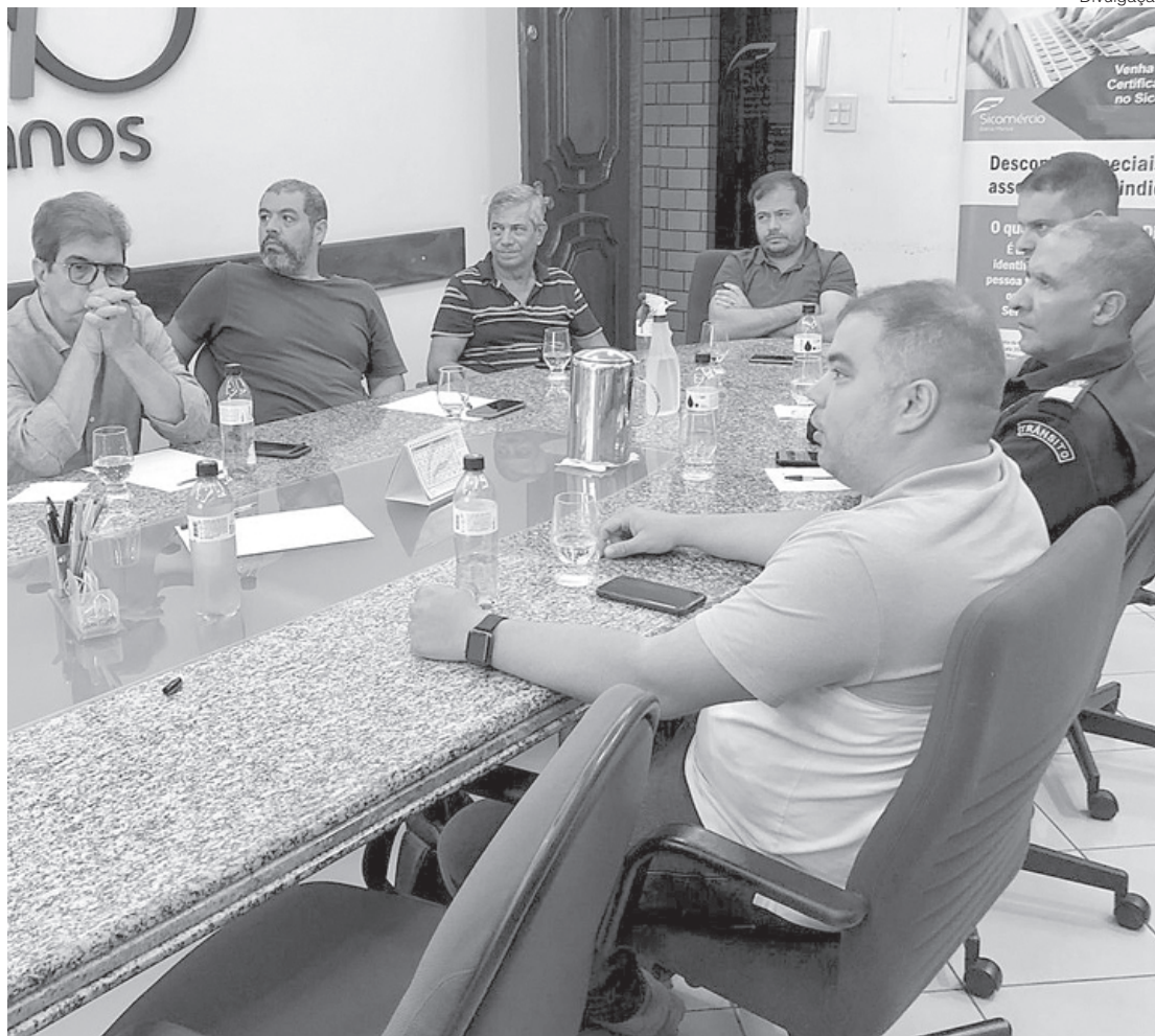
Representantes do empresariado de Barra Mansa querem cidade com mais segurança

Foram apresentadas algumas soluções durante o encontro como a criação de um grupo de whatsapp para troca de informações entre a polícia, a prefeitura, a guarda e as entidades, com o objetivo de informar situações suspeitas. Além disso, foi proposto que todos os comerciantes instalem câmeras e cedam as imagens para a polícia. Também será instalado o programa Polícia Geral, juntamente com a FECOMERCIO para uma campanha de conscientização so-