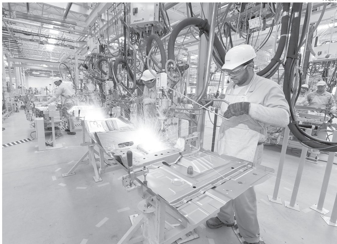
Vendas de veículos caíram 1,11% em abril, na comparação com março

Por Bruno Bocchini - Repórter da Agência Brasil - Edição: Maria Claudia