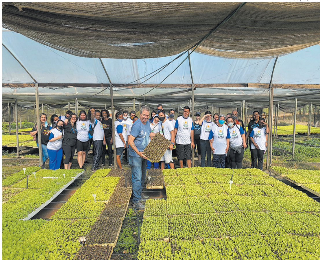
Estudantes da associação conheceram o distrito Santa Rita de Cássia nesta terça-feira

- A associação representa muito na vida destes alunos e profissionais. Ficamos muito satisfeitos de estarmos presentes nesta atividade que nos proporcionou muita troca de conhecimento e alegria para todos os envolvidos - encerrou Beleza.