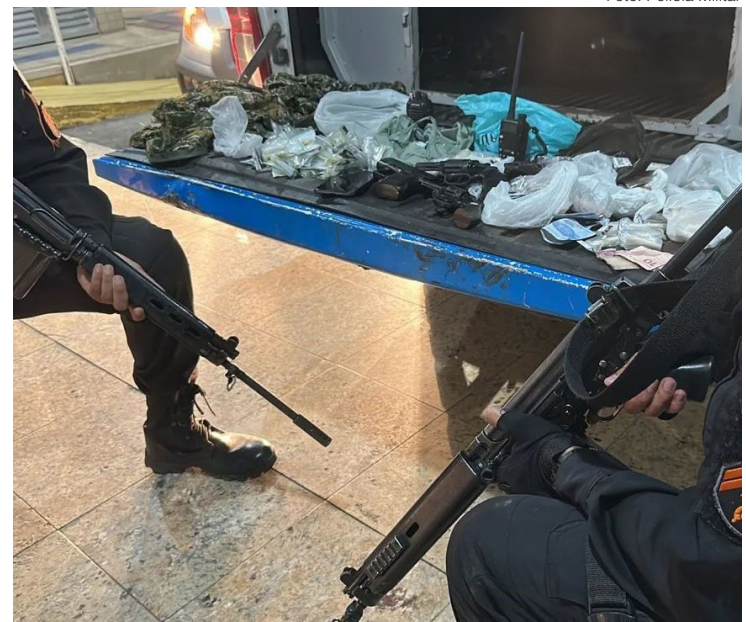
Drogas e armas foram encontradas pela PM após o confronto