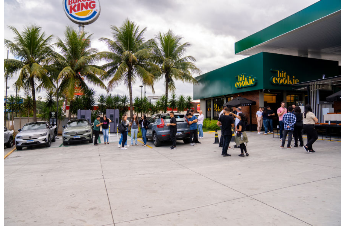
Eletroposto funciona ao lado do Burger King, na Via Dutra, em Barra Mansa

A Volvo Car Brasil disponibiliza um hotsite repleto de conteúdo, informações e