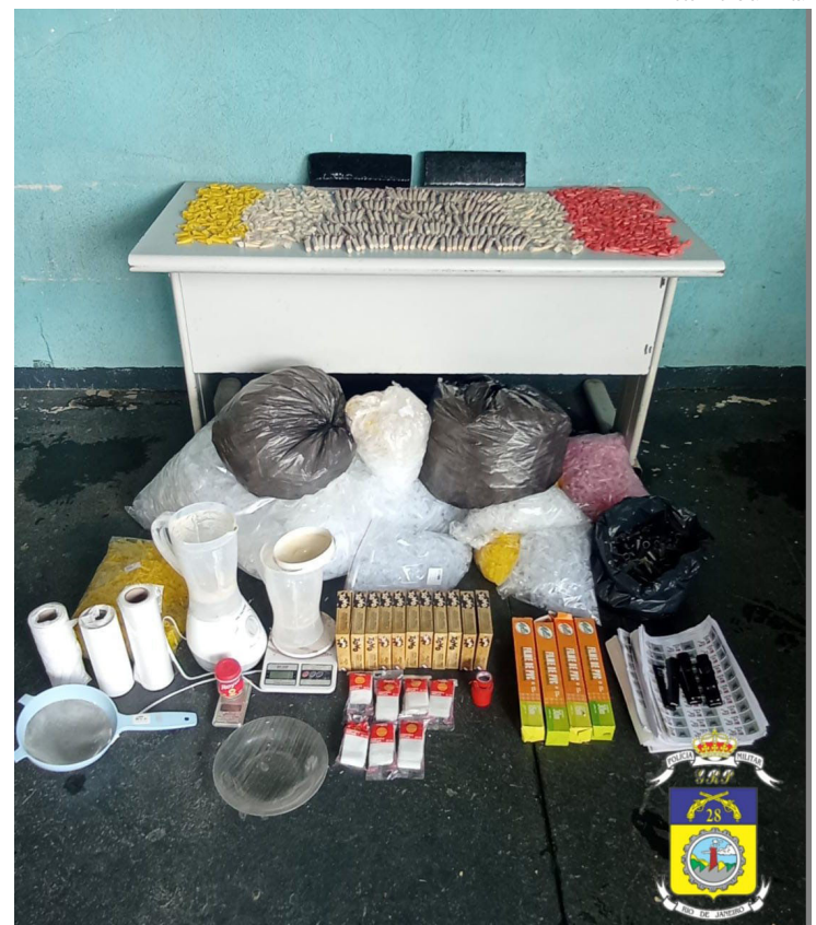
Material foi encontrado em uma casa no bairro