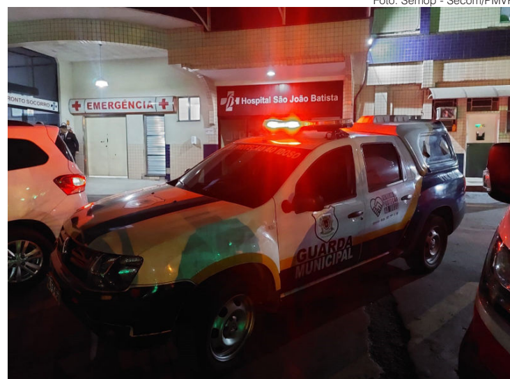
Viatura da Patrulha abriu caminho até o Hospital

“Imediatamente fizemos a volta, ligamos a sirene e fomos abrindo caminho até o hospital. Ajudamos a carregar o idoso até o setor de emergência e esperamos pelo atendimento. Ele está fora de perigo”, afirmaram os agentes.