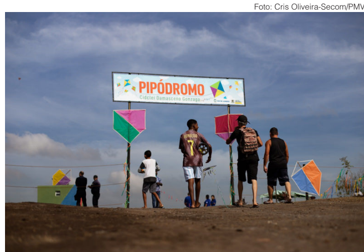
No pipódromo, volta-redondenses podem empinar seus ‘brinquedos’ sem qualquer risco

A adequação do terreno foi realizada pela Secretaria Municipal de Infraestrutura (SMI), com recursos próprios, atendendo aos pipeiros do município e a Câmara Municipal, por meio de preposições dos vereadores Fábio Buche-