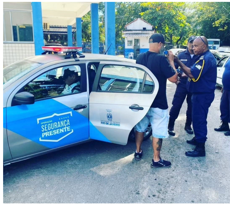
PM submete condutor a teste do bafômetro