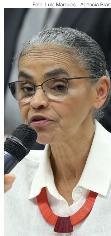
Marina Silva reafirma que o presidente Lula vetará trecho de MP que prejudica Mata Atlântica

O texto aprovado pelos deputados federais altera a Lei da Mata Atlântica (Lei 11.428/06) para permitir o desmatamento de área onde haverá implantação de linhas de transmissão de energia elétrica, de gasoduto ou de sistemas de abastecimento público de água, sem necessidade de estudo prévio de impacto ambiental ou compensação de qualquer natureza. Dispensa ainda a captura, coleta e transporte de animais silvestres, garantida apenas sua afugentação. O texto prevê também, dentre outros pontos, que a vegetação secundária em estágio médio de regeneração poderá ser derrubada para fins de utilidade pública mesmo quando houver alternativa técnica ou de outro local para o empreendimento. A MP vai agora para sanção