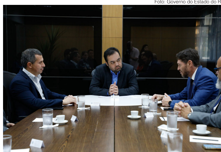
Castro ouve explicações sobre potencial da energia eólica

“É uma honra a assinatura deste memorando. É mais uma importante conquista para o conjunto de ações que estamos realizando nos últimos anos para recuperar o protagonismo do Estado do Rio de Janeiro, especialmente na pauta da transição ecológica. O Rio tem vocação energética, um hub do Brasil e o nosso objetivo é transformar o nosso estado na Ca-