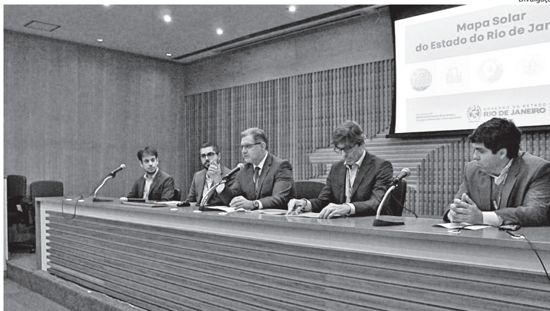
MAPA MOSTRA que o estado ocupa o 8º lugar no ranking nacional de geração distribuída

“O Rio de Janeiro tem um enorme potencial para o desenvolvimento da energia solar, que já alavancou cerca de R$ 1,9 bilhão em investimentos no estado e criou mais de 10 mil vagas de emprego para a população. É uma fonte de energia limpa e sustentável, que traz inúmeros benefícios ambientais