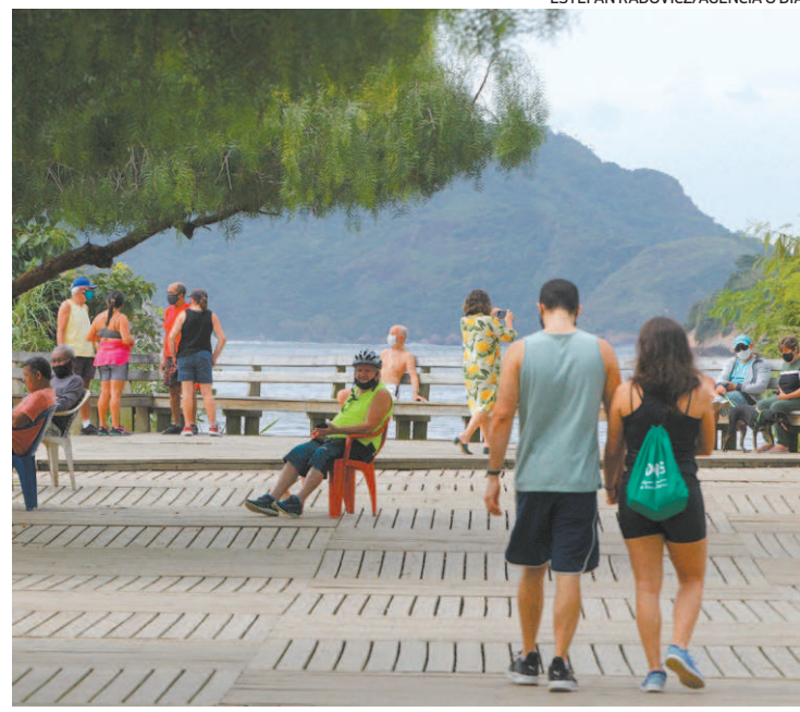
Dia das mães com lazer pela cidade e medidas restritivas contra covid

“Eu desejo que as mães acreditem na força da maternidade. Para mães que estão em um momento difícil, eu diria que elas acaltem o coração porque tudo que elas fizeram por amor é eterno e se perpetua”