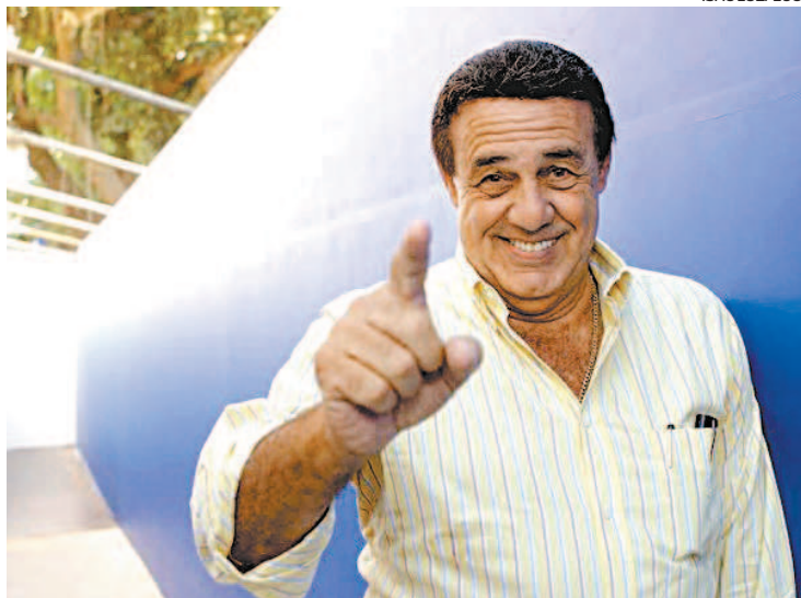
Presidente da Liesa comemora contrato com a Prefeitura do Rio

“Foi um dia muito próspero e muito feliz para toda