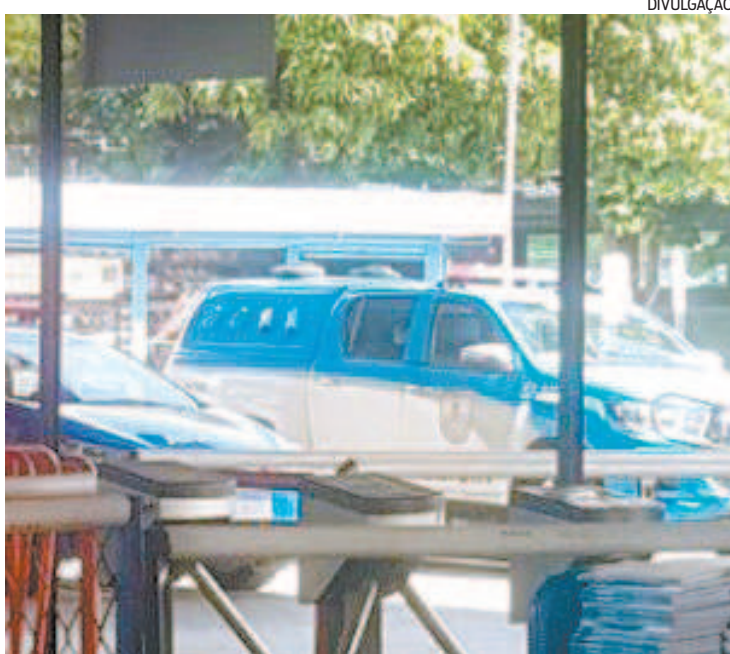
Representantes de empresas foram encaminhados para a 17ª DP

Representantes de duas empresas que atuam na administração da Feira de São Cristóvão causaram tumulto, ontem, na entrada do local, devido à uma disputa judicial pela bilheteria do espaço. A empresa LCV, antiga prestadora de serviços para a feira na área de limpeza e manutenção, alega dívidas, que chegam a R$ 10,8 milhões, por parte dos gestores atuais da feira. Segundo informações, funcionários da LCV estavam impedindo que os feirantes entrassem na feira. Uma equipe do 4º BPM (São Cristóvão) foi acionada ao local e, ao constatar a confusão entre os dois grupos, conduziram os envolvidos para a 17ª DP (São Cris-