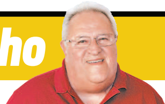
ALEXANDRE VIDAL / FLAMENGO