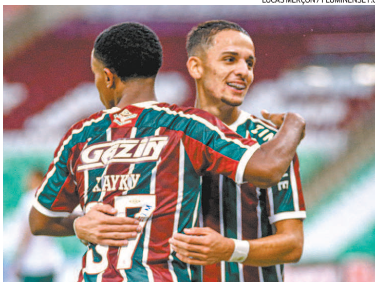
Garotada de Xerém levou o Flu para final do Carioca contra Flamengo

Logo nos primeiros minutos, o trio de ataque formado por Ganso e Abel Hernández mostrou que, quando a equipe conseguia trocar passes, levaria perigo ao gol adversário. O gol que inaugurou o placar saiu aos 21 minutos. E que gol. Yago Felipe fez boa tabelinha com Ganso na altura da meia-lua