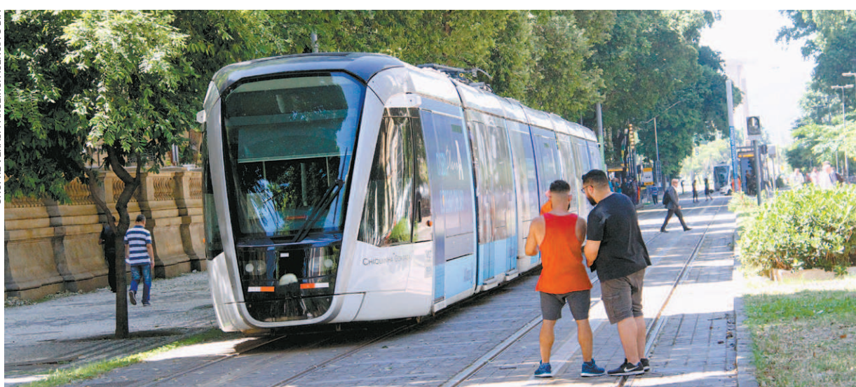
O VLT é a única opção de transporte para os moradores da Gamboa, mas está sempre dando problemas

Por isso se você me perguntou se tá feio ou tá bonito... A solução não é post na rede social e tenho dito.