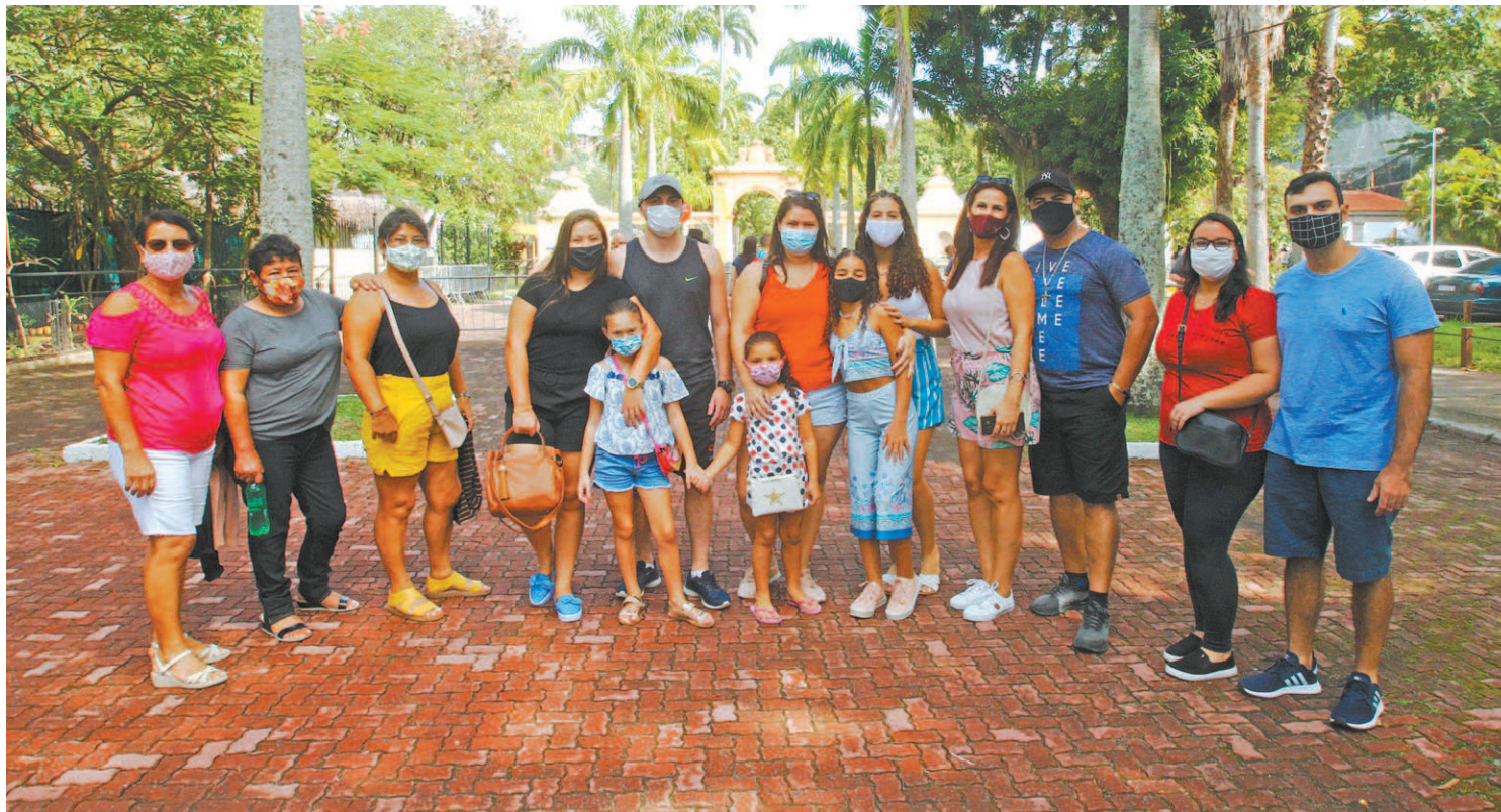
Família de São Cristóvão aproveitou o Dia das Mães para visitar o BioParque, na Quinta da Boa Vista, com todos os cuidados sanitários

“Notei que faltava as xícaras em casa, tenho maior ciúme, mas valeu a pena. Foi uma surpresa muito legal. Há muito tempo não vinha na Quinta da Boa Vista e também foi bom