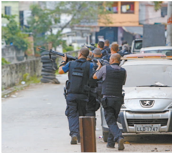
Polícia Civil diz que mortos na ação tinham anotações criminais