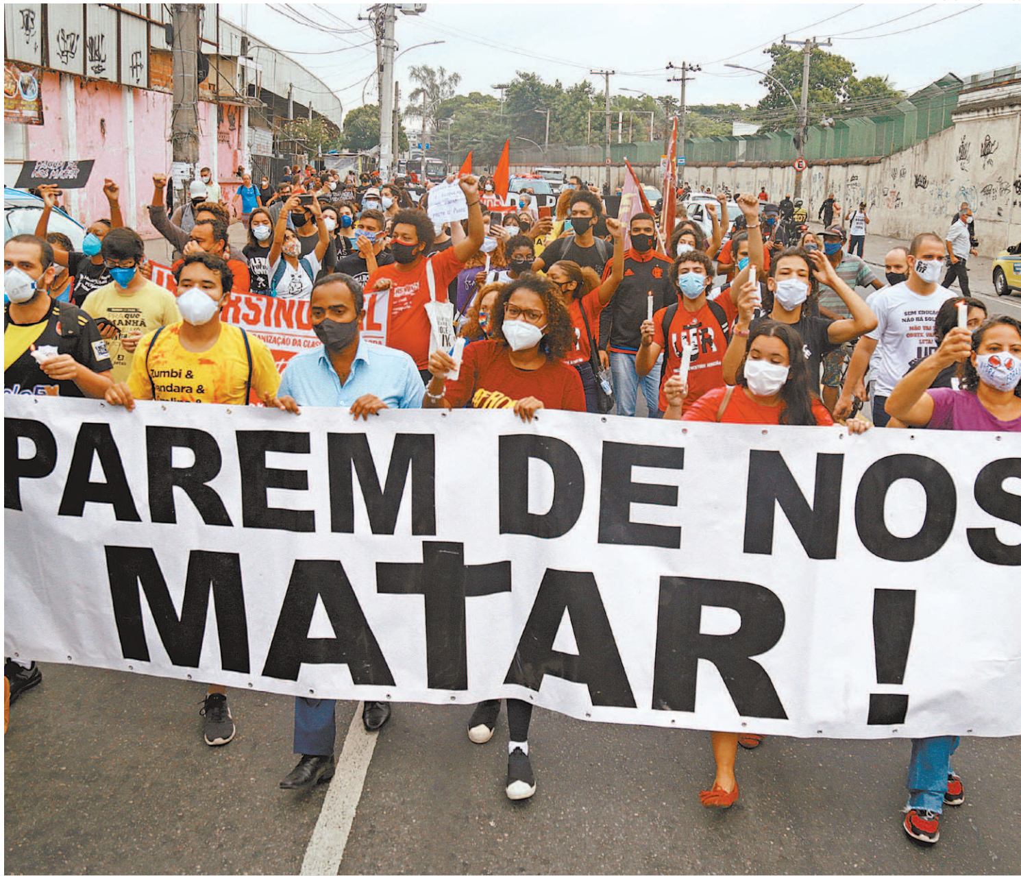
Manifestação no Jacarezinho ocorreu por causa da ação na operação Exceptis que deixou 27 mortos, além do policial baleado na cabeça

Acusados de serem traficantes e/ou ladrões estavam