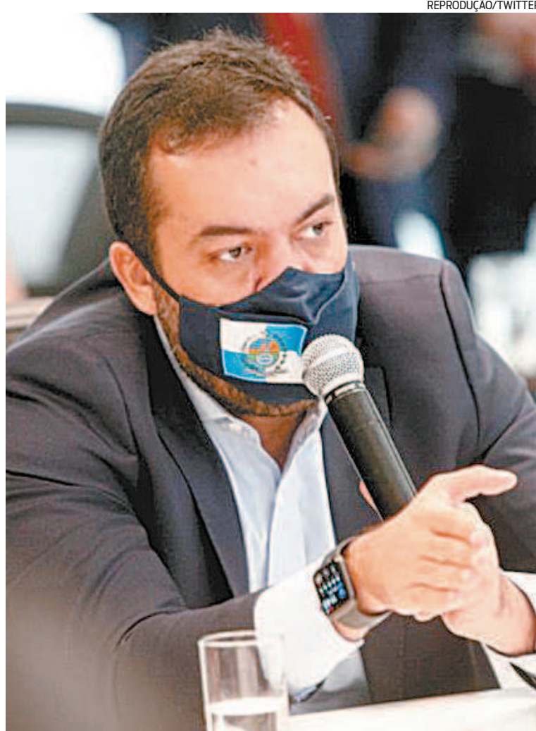
Governador Cláudio Castro busca saídas para sair da crise.

“Eu assumi dia 28 de agosto com déficit nas contas públicas na casa de R$ 6,2 bilhões, com a difícil missão de pagar os salários dos servidores de novembro, dezembro e 13º. Começamos um trabalho de tentar recuperar e tentamos achar maneiras de sairmos dessa crise. O Estado tinha uma situação muito difícil, não dialogava bem com a cadeia produtiva, não dialogava bem com a Alerj, não dialogava com o governo federal, não dialogava com os outros poderes, então começamos um trabalho de resgate do Rio de Janeiro, recuperando as pontes com o governo federal, com a Alerj, voltamos a dialogar com a cadeia produtiva. Até no momento mais complicado da pandemia, fazia e continuo fazendo reuniões periódicas com a cadeia produtiva”.