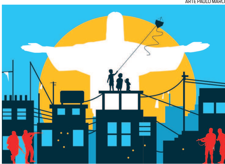
ARTE PAULO MÁRCIO

Quando uma pessoa morre, todo seu entorno morre com ela. Não estão matando apenas um indivíduo, estão matando famílias inteiras. De todas as cenas atrozmente divulgadas em relação à chacina de Jacarezinho, duas chamam mais atenção: um berço tomado de sangue e um quarto rosa de uma menina tão pequena, mas que assistiu à polícia