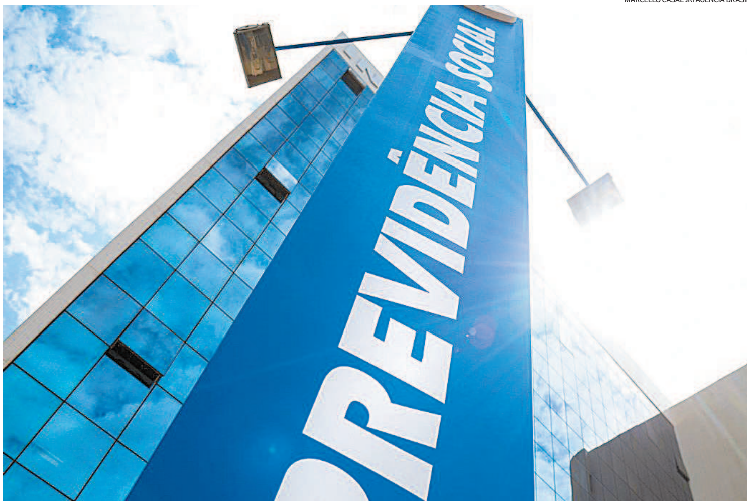
Segundo especialistas, qualquer pessoa que julgue que a aposentadoria ou a pensão foi concedida de forma equivocada pode pedir a revisão