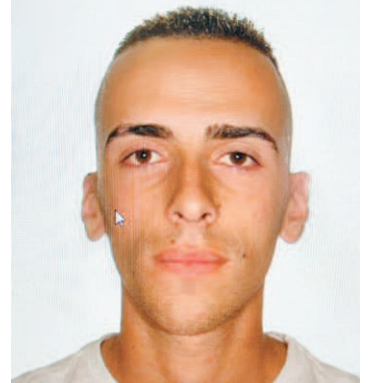
DCOD investiga no Rio essa união