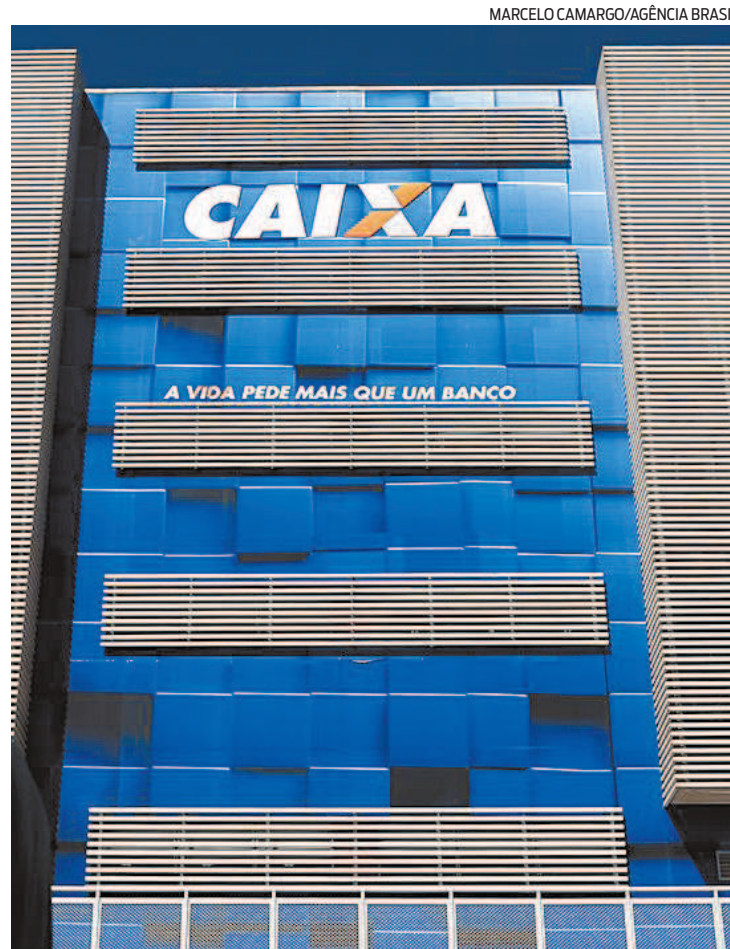
Caixa informou que atua para bloquear e desativar serviços falsos

-Use soluções de segurança no celular que façam a detecção automática de aplica-