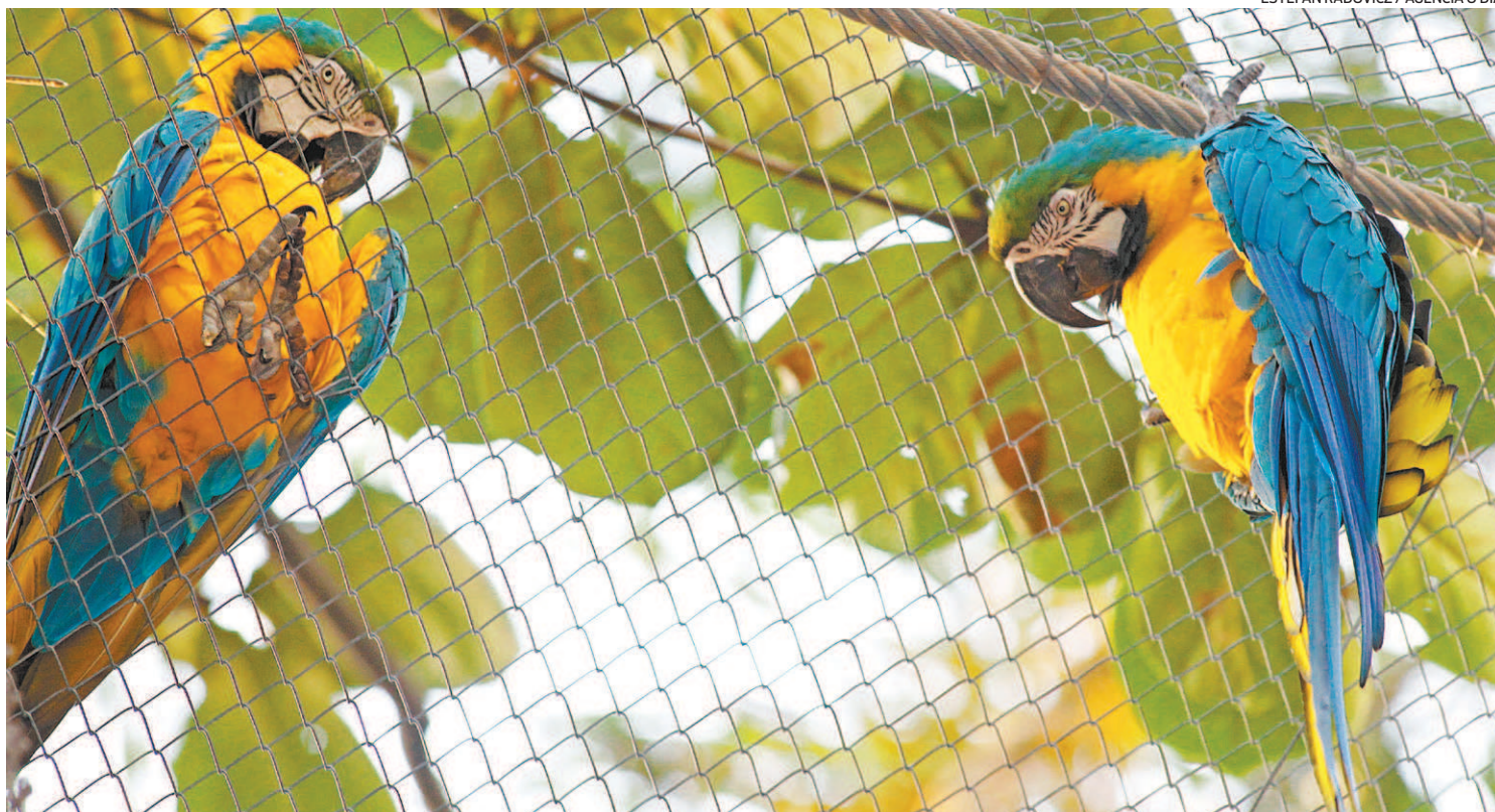
Arara que vive em liberdade na natureza visita diariamente as outras que moram em um viveiro do BioParque, em especial a sua “alma gêmea”

Julieta chega à Quinta da Boa Vista ainda pela manhã e passa todo o dia do lado de fora, na grade do viveiro, que