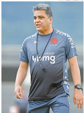
Cabo quer time com ousadia

“Sempre deixamos muito claro que vamos usar a Taça Rio, é claro que quando entramos em uma competição é para sermos campeões, independente da competição que estamos jogando. Mas temos o planejamento. Houve muito questionamento ao longo da semana pelo fato de usarmos um time alternativo contra o Madureira. Mas era um confronto de 180 minutos, sabíamos que teria-