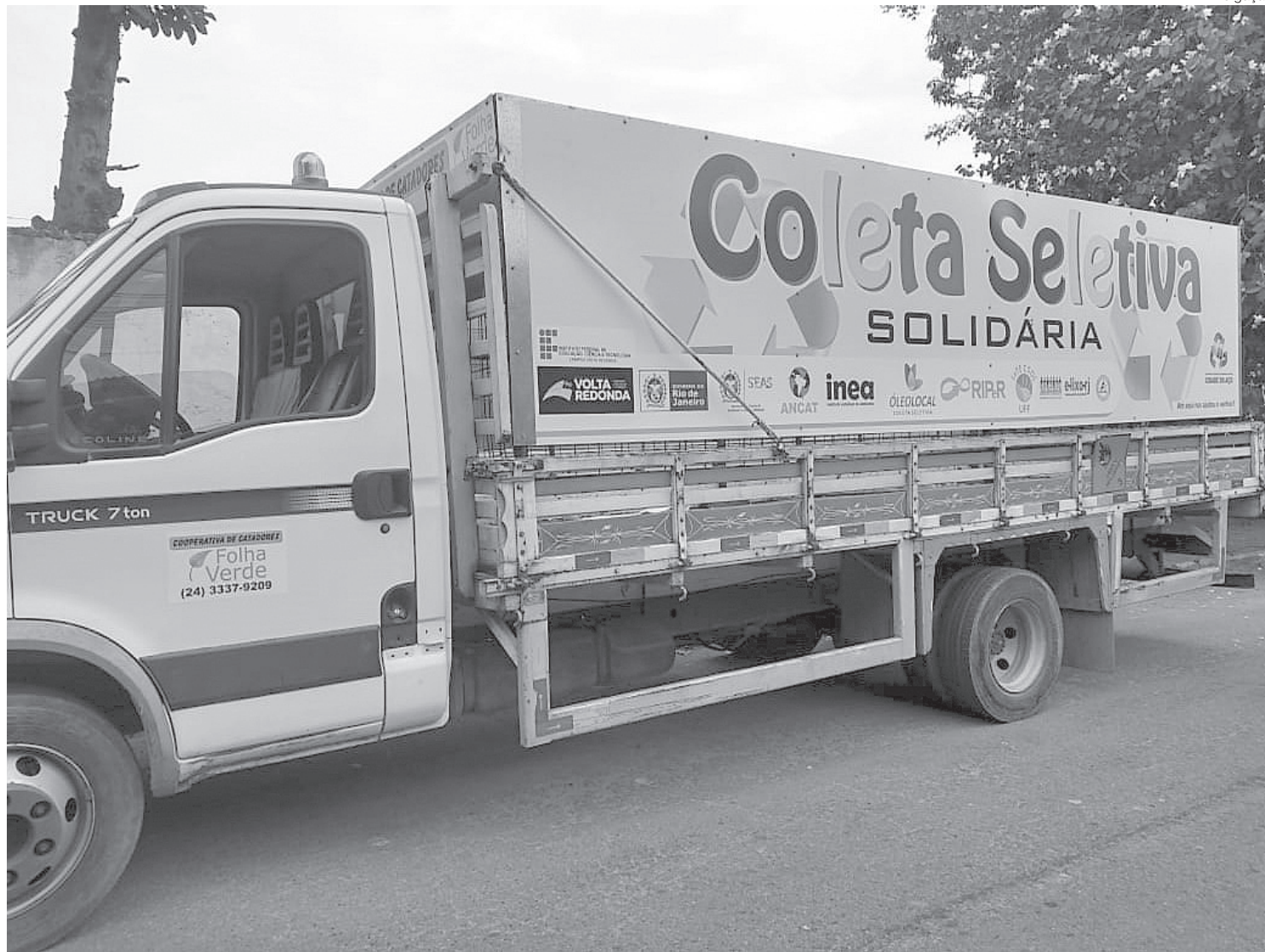
Cooperados estão sem trabalhar e se mantêm com o auxílio emergencial do governo federal e com ajuda de terceiros

Estamos de quarentena desde março e sem receber pelo serviço prestado da prefeitura em janeiro e fe-