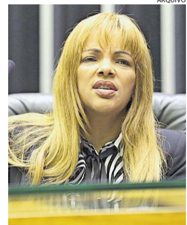
A parlamentar foi intimada