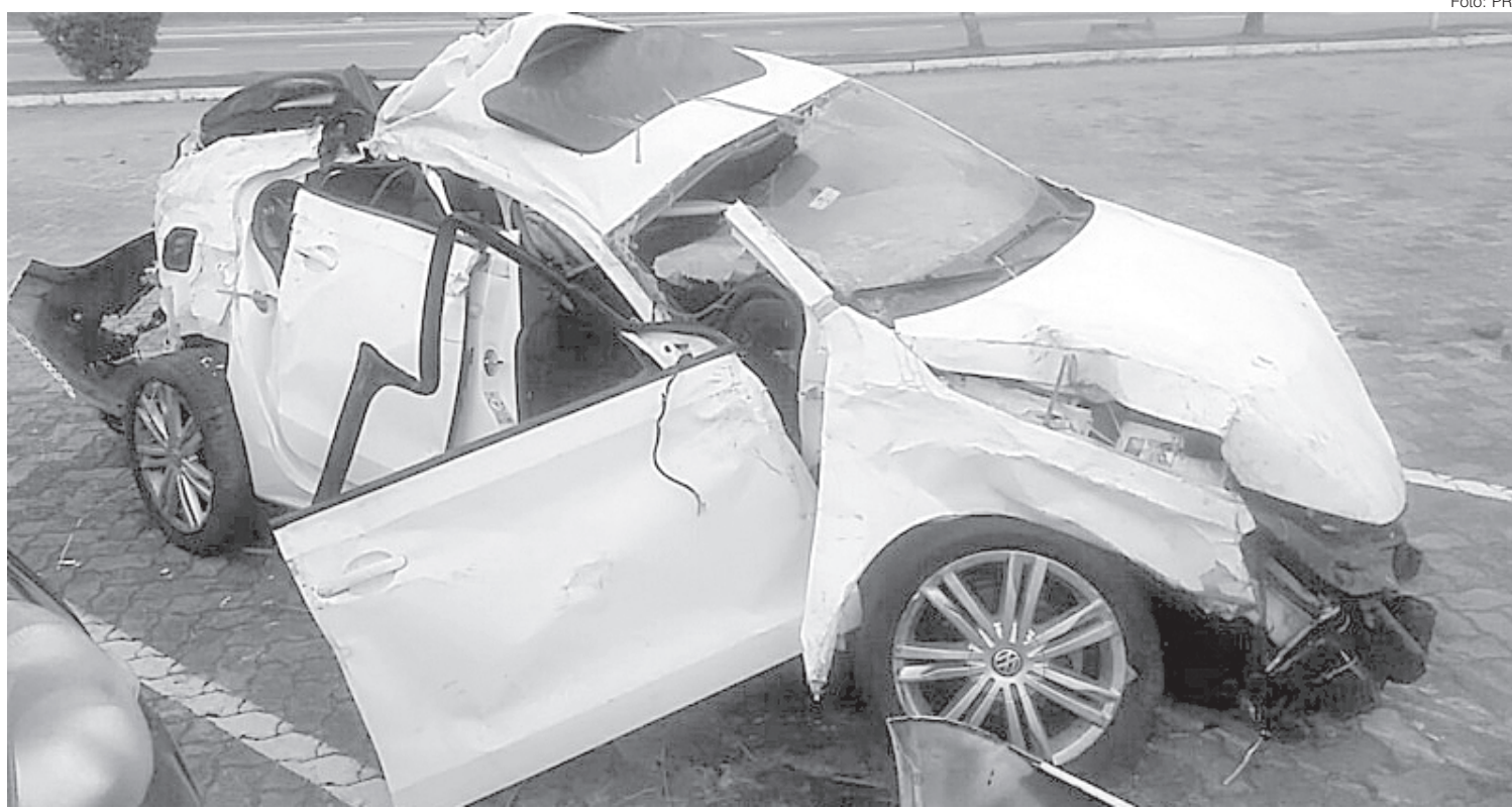
Veículo foi removido para o pátio PRF

Segundo a PRF, não há registros de ocorrência sobre roubo ou furto do veículo, que foi removido para o pátio PRF.