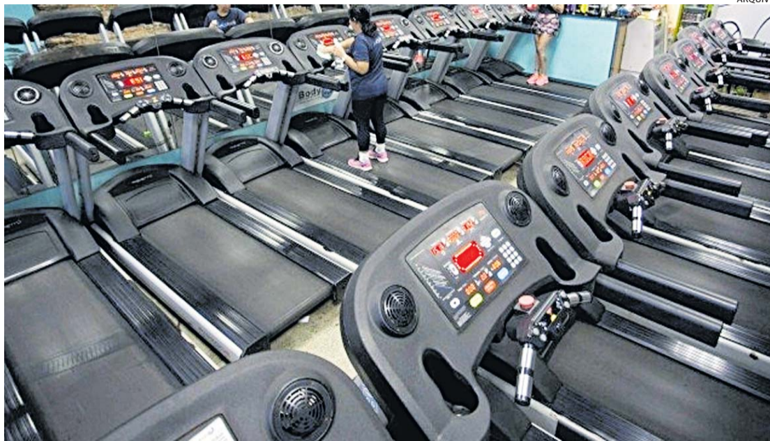
Uma nova onda pandêmica pode voltar a fechar as academias, o que faria a lei ser aplicada

O descumprimento às determinações resultará na cobrança de multas nos termos do Código de Defesa do Consumidor (CDC) aplicadas pelos órgãos responsáveis pela fiscalização, em especial, a autarquia estadual de proteção e defesa do consumidor (Procon-RJ). x