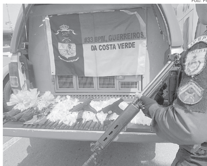
Material foi levado para a 166ª DP

A ocorrência foi registrada na 166ª DP. O homem vai ser indiciado por posse ilegal de arma de fogo. Já a namorada dele foi ouvida como testemunha e liberada.