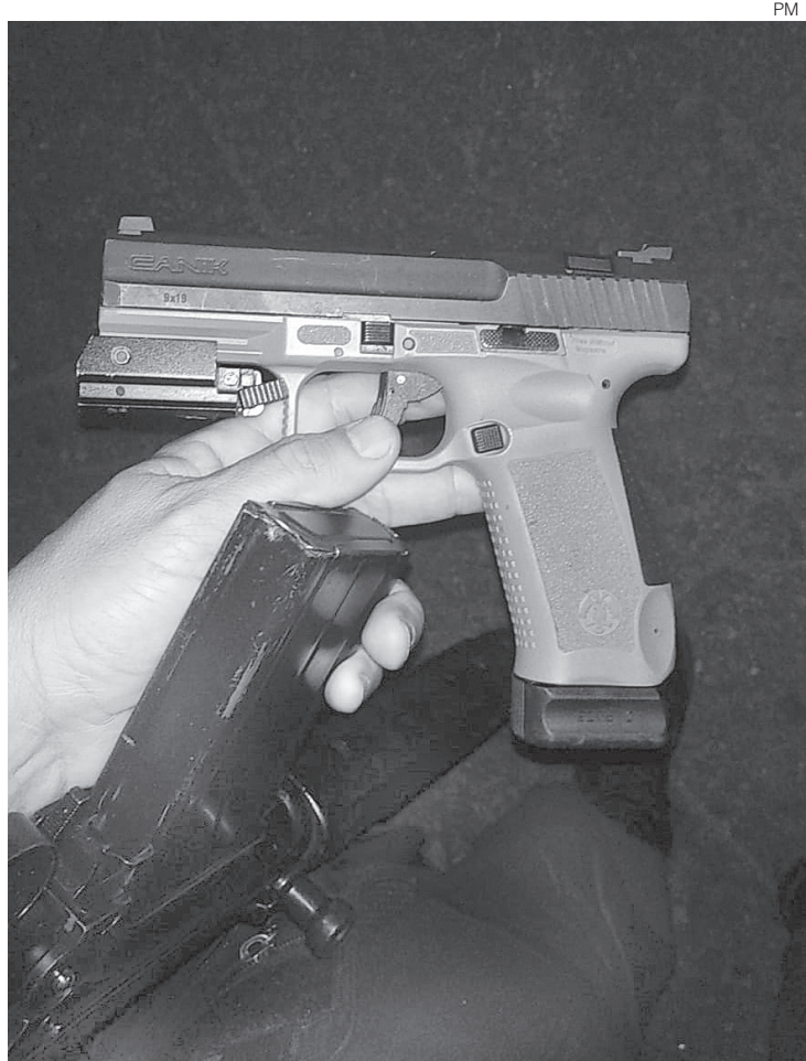
Pistola 9 milímetros foi apreendida

Os agentes, em seguida, localizaram o dono do carro, que foi levado para a 90ª DP (Barra Mansa), onde foi ouvido e liberado. Ele, porém, está sob investigação. Assim como um jovem de 23 anos, responsável pela pistola apreendida pelos PMs.