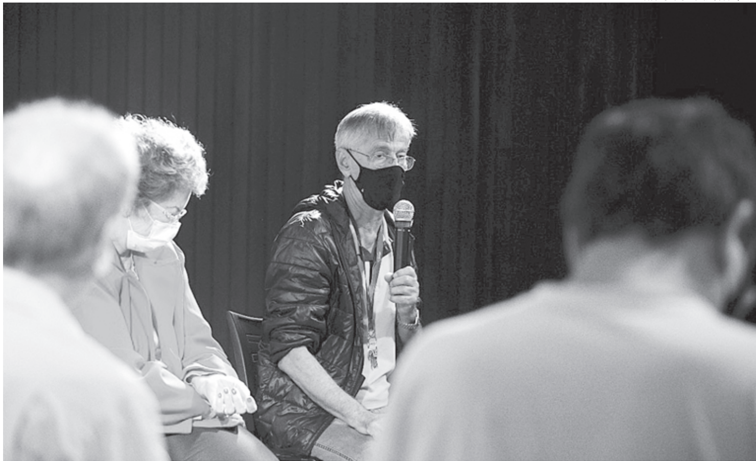
Encontro planeja Fórum que discutirá questões ambientais e de direitos humanos