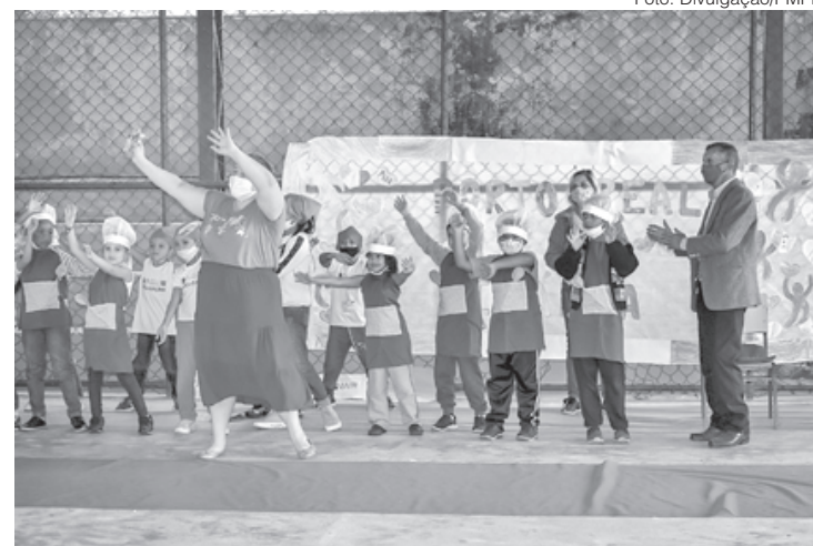
Alunos participaram de um desfile, caracterizados com as cores da bandeira da Itália