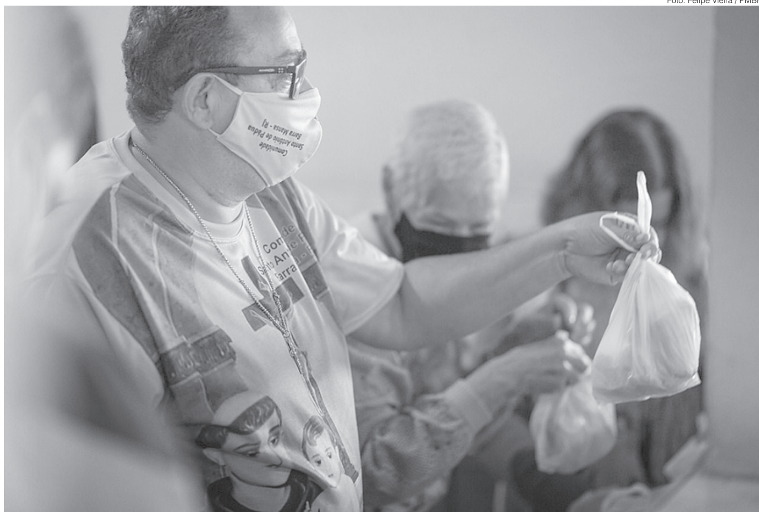
Partilha é uma das grandes inspirações que Santo Antônio deixou à humanidade

A programação religiosa desta segunda-feira foi a seguinte: missa às 7h, às 10h e às 19h (seguida de procissão); bênção solene com o Santíssimo Sacramento, às