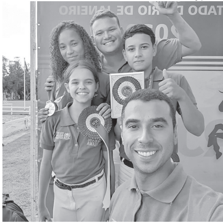
Equipe de Volta Redonda contou com seis concorrentes, divididos em três categorias da competição