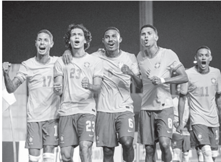
Na última rodada do quadrangular, time verde e amarelo faz 7 a 0

muita reclamação, o defensor foi expulso e o atacante brasileiro, Marcos Leonardo, converteu com muita categoria a penalidade.