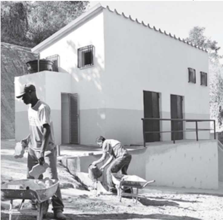
Construção civil de subestação de energia está na fase final e próximo passo envolve instalações elétricas