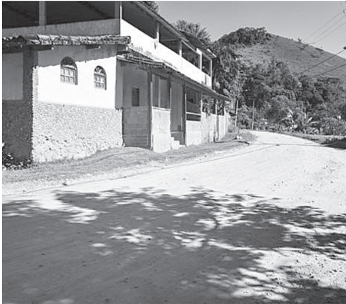
Defensoria Pública e Iterj buscam regularização de posse de terrenos no Bracuí