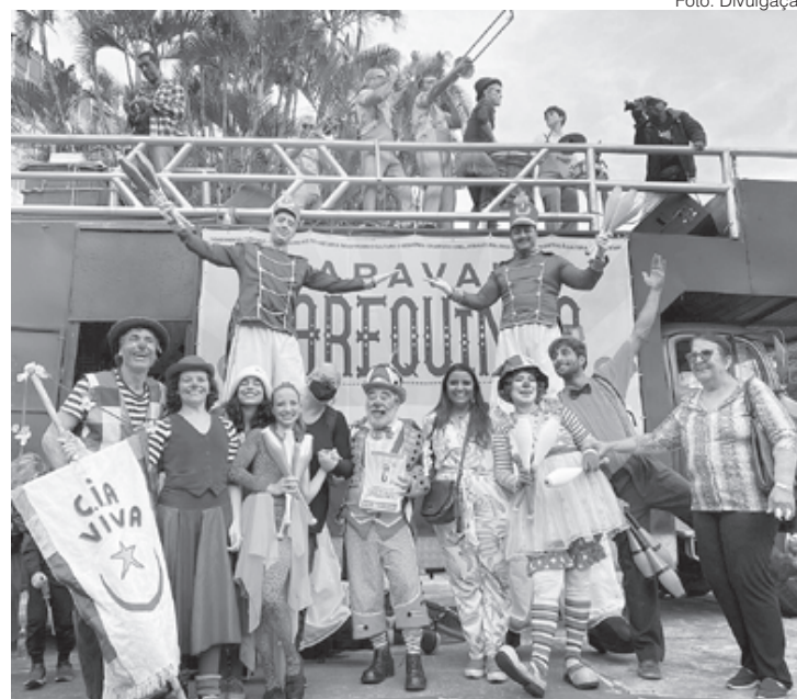
Resende e Angra recebem apresentações dos Cortejos Circenses do Projeto Caravana Carequinha