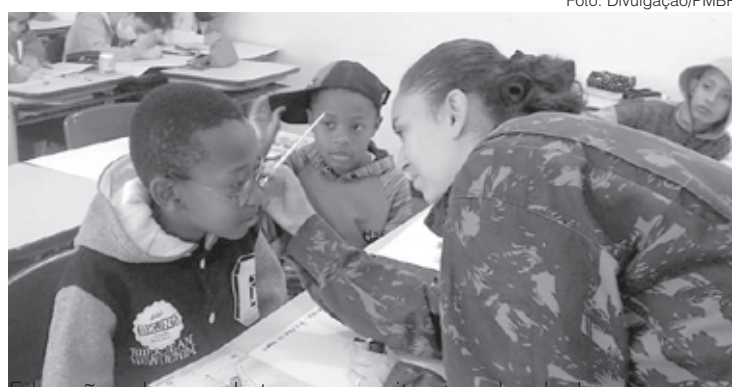
Educação sobre combate ao mosquito causador da dengue nas escolas de Barra do Pirai deve ajudar a conscientizar a comunidade

Finalizando o trabalho desenvolvido pela equipe nesta unidade escolar, vai acontecer na próxima terça-feira, 28, uma grande caminhada com os alunos pelas ruas do entorno da escola para conscientizar a população local. O tema da cami-