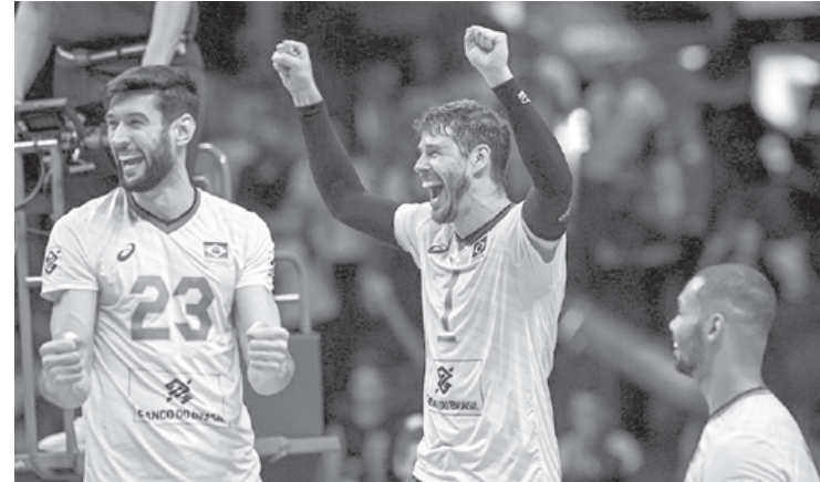
Após boa vitória, seleção masculina encara o Irã às 10h30 desta sexta-feira

Com o triunfo nesta quinta (24), o Brasil ocupa agora o sétimo lugar, com nove pontos (três vitórias e três derrotas). O time nacional perdeu os três últimos jogos para Estados Unidos, China e Polônia. Na estreia da primeira rodada, em Brasília, a equipe superou a Austrália, e no jogo seguinte venceu a