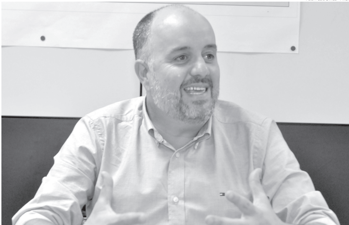
Secretário de Finanças diz que PIX já responde por mais de um quarto dos pagamentos de impostos ao município

A disponibilidade da ferramenta para o pagamento de tributos municipais foi possível através de parceria entre os setores do Tesouro e Receita, junto ao Banco do Brasil e à empresa Nota Control, que implantou o Gerenciamento Eletrônico de Documentos na Prefeitura de Barra Mansa.