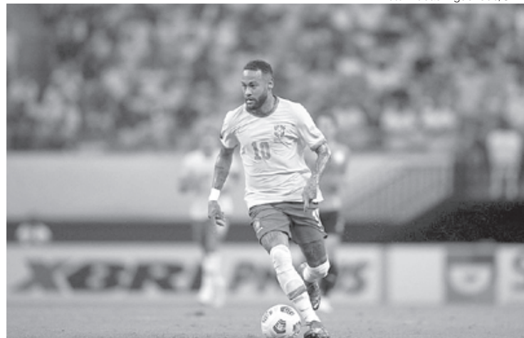
Neymar é o principal jogador da seleção brasileira de futebol

Três meses após ter conquistado a ponta da classificação, a equipe de Tite ampliou a vantagem sobre a vice-líder Bélgica. A terceira posição passa a ser ocupada pela Argentina do craque Lionel Messi, que conquistou a Finalíssima (confronto entre