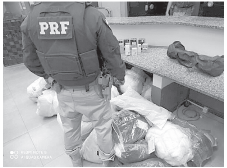
Não foi apresentada nenhuma documentação fiscal das mercadorias