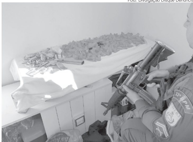
Equipe encontrou cápsulas de cocaína e trouxinhas de maconha, além de carregador e munições

Munidos com informações de que na Rua Matelândia haveria um suspeito de ter recebido uma carga de drogas na noite anterior a mando de um traficante, as equipes da P-2 foram ao local denunciado, onde avistaram o suspeito saindo de sua re-