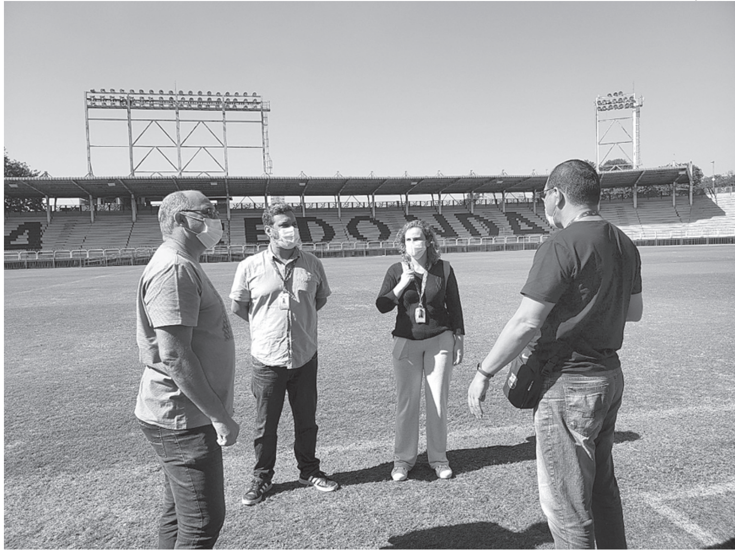
Equipe de produção da TV Brasil visitou instalações do Raulino de Oliveira nesta quinta-feira (23)

O Estádio General Sylvio Raulino de Oliveira, popularmente conhecido como Raulino de Oliveira, foi construído em 1950, sendo inaugurado em 15 de abril de 1951. Reinaugurado em 17