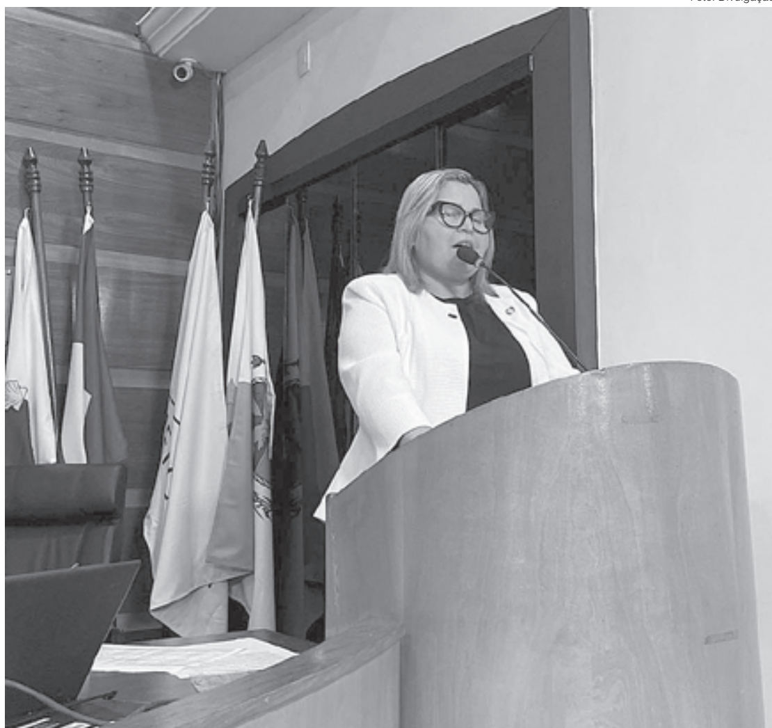
Titi Brasil manifesta preocupação com projeto turístico na Ilha Grande

“Não sou contra o turismo, construção de hotéis, que gerará emprego e renda certamente. Além de alavancar o nome da nossa Angra dos Reis para o mundo. Mas um empreendimento como