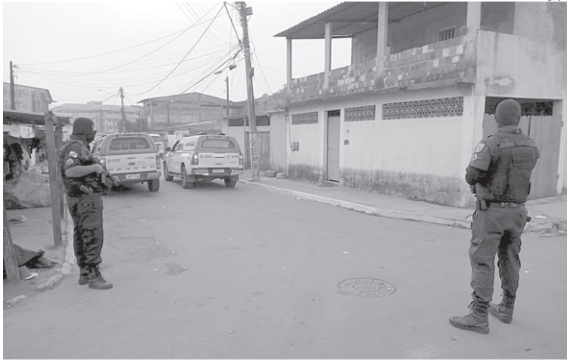
Operação visou coibir a criminalidade na região

Além disso, foi apreendida uma pistola, celular,