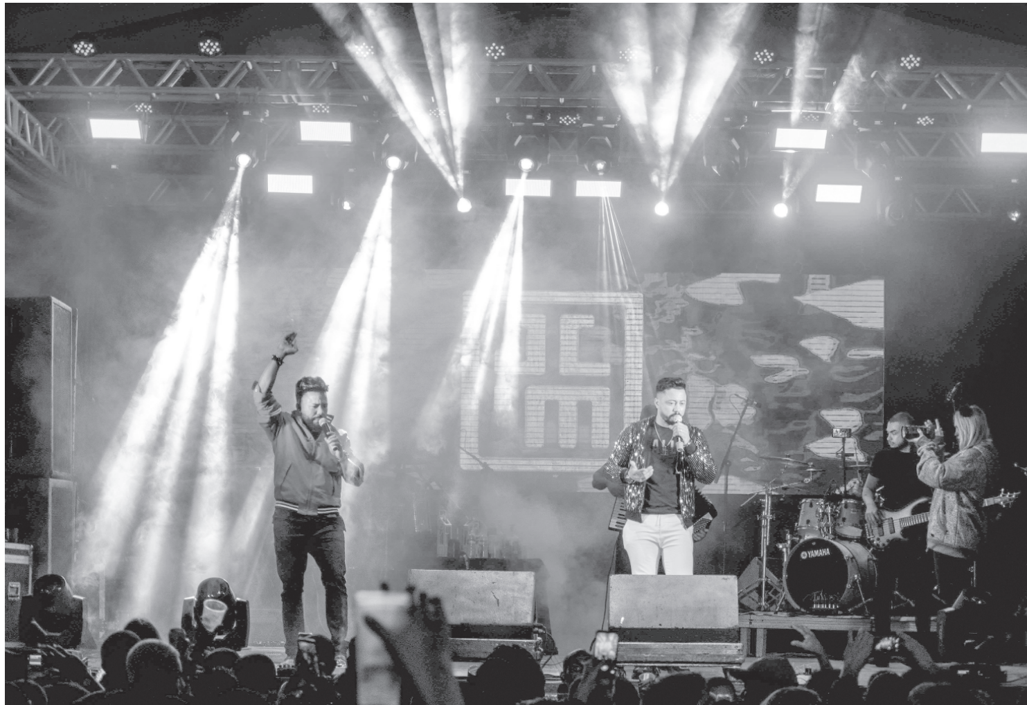
Shows animaram o público durante festa de aniversário de Pinheiral

“Essa foi minha primeira festa à frente da Semecult e tenho muito a agradecer a