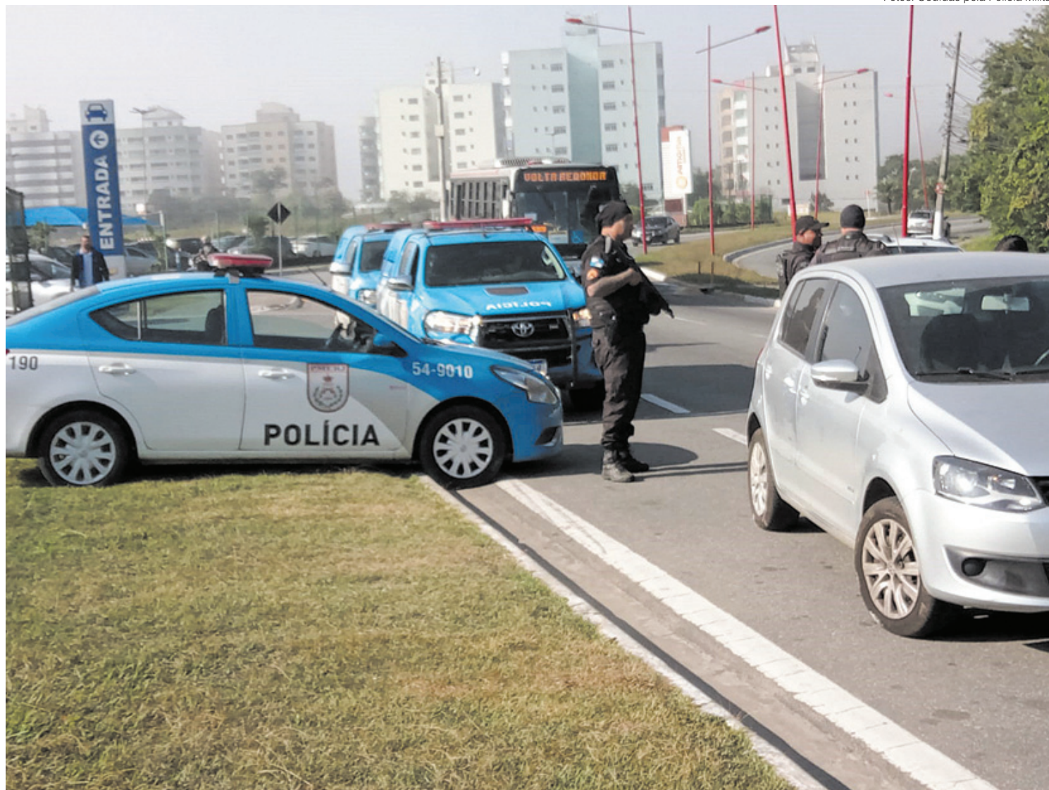
Abordagens policiais foram realizadas em Resende

A Polícia Militar, através do 5º CPA (Comando de Policiamento de Área), realizou ontem uma megaoperação organizado na região. A ação contou com a participação de 200 policiais militares do 28º Batalhão da PM (Volta Redonda), 10º Batalhão (Barra do Piraí), 37º BPM (Resende), 2ª Companhia da PM de Paraty e 33º BPM (Angra dos Reis). Em Volta Redonda, um homem morreu em uma