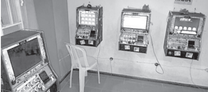
Máquinas caça-níqueis e máquina para jogo do bicho foram apreendidas