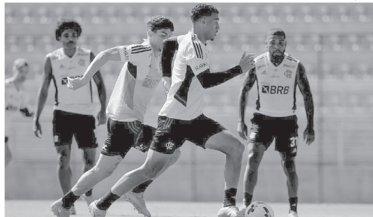
Atletas que não entraram em campo contra o Atlético-MG realizaram uma atividade física

Os atletas que não iniciaram a partida contra o Galo fizeram um trabalho regenerati-