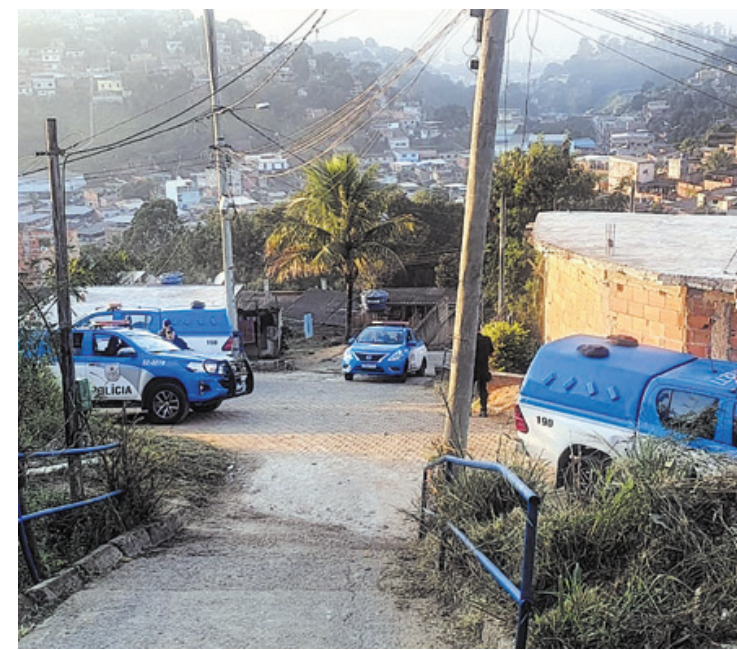
PM também esteve em bairros mais periféricos de Volta Redonda