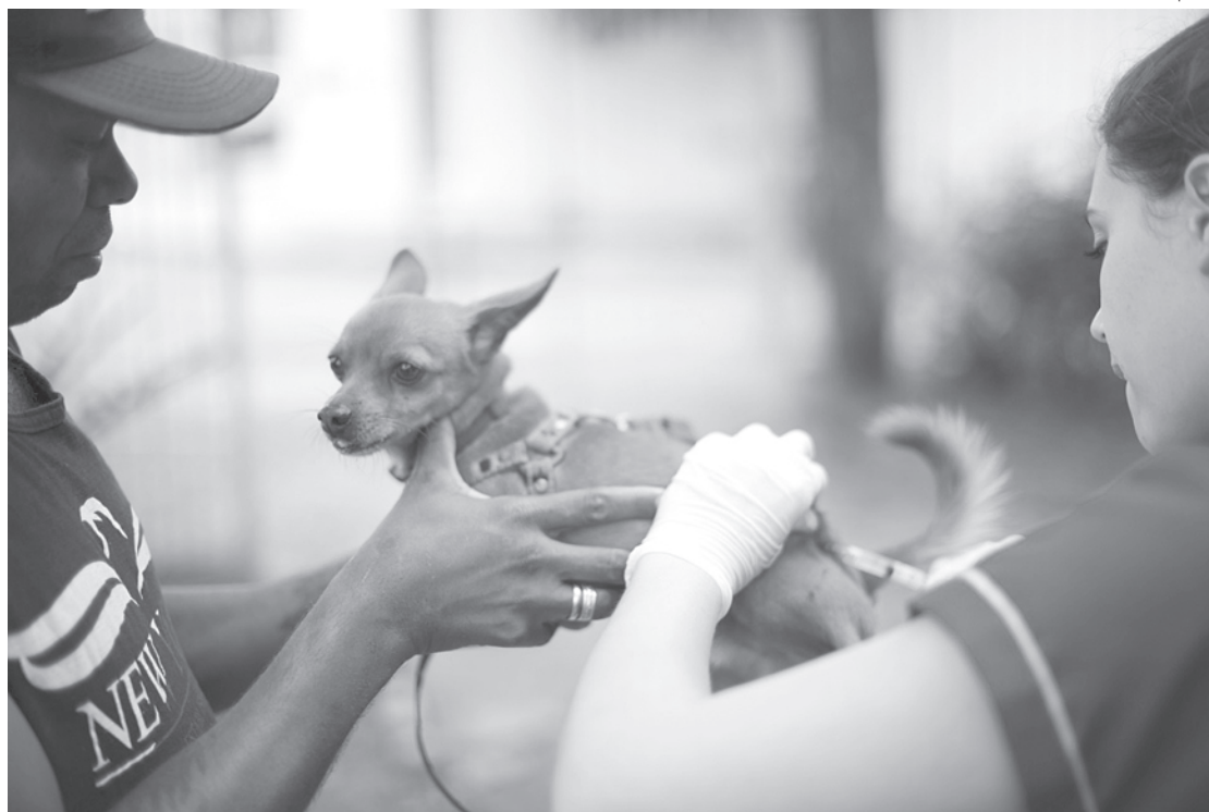
Serão vacinados animais com mais de 90 dias e não serão vacinados animais em período de gestação ou lactantes

Por conta da pandemia de Covid-19, todos os protocolos de segurança serão seguidos, com isso será permitida a entrada e vacinação de um animal por vez e os responsáveis deverão estar usando máscara. Não serão vacinados animais levados por crianças e sem o acompanhamento de pais ou respon-