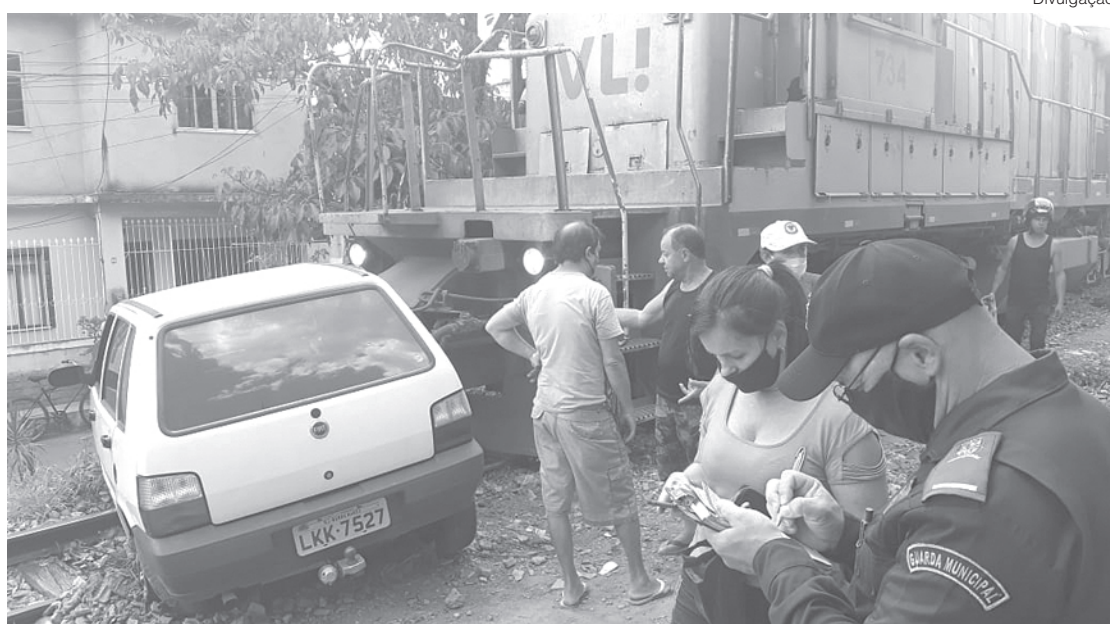
Veículo desligou sobre os trilhos e não houve tempo de evitar o acidente

De acordo com o registro de ocorrência feito pela condutora, o veículo desligou sobre os trilhos. As tentativas de fazê-lo voltar a funcionar não deram resultado. Um ciclista que estava no local ajudou a empurrar o veículo, mas não houve tempo