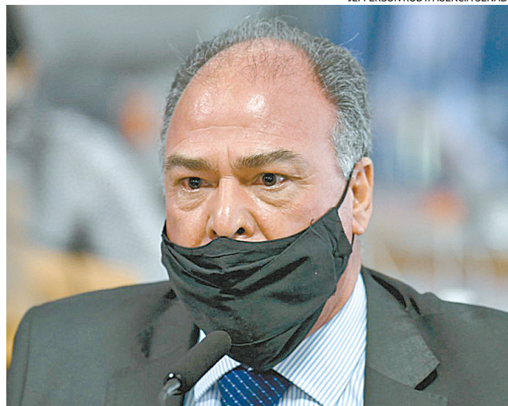
Bezerra quer acelerar aprovação das medidas da PEC dos Combustíveis

Além de zerar a fila de espera do Auxílio Brasil, estimada em 1,6 milhão de famílias, a PEC também prevê