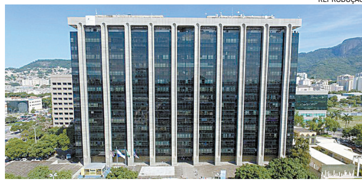
Segunda parcela do 13º salário será paga no dia 15 de dezembro

De acordo com o órgão municipal, com o equilíbrio das públicas, foi possível voltar a pagar os servidores no segundo dia útil do mês seguinte e antecipar a primeira parcela do 13º salário no meio do ano, que não havia sido pago pela gestão anterior.