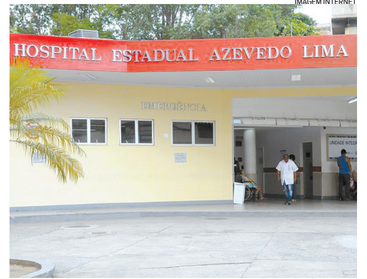
Candidatos devem ir ao hospital, entre os dias 11 e 13 de julho

O curso é organizado em dois módulos com duração de 16 semanas. O primeiro contempla as áreas gerais dos concursos. Já o segundo aborda a parte específica de cada concurso. As aulas começarão em 15 de agosto, quando os alunos terão acesso à sala de aula virtual. Só será permitida uma inscrição por candidato, que deverá optar por um dos cursos disponíveis, de acordo com edital da seleção. Todas as informações podem ser consultadas na página do curso em https://extensao.cecierj.edu.br/cursos/aprovarj/ .