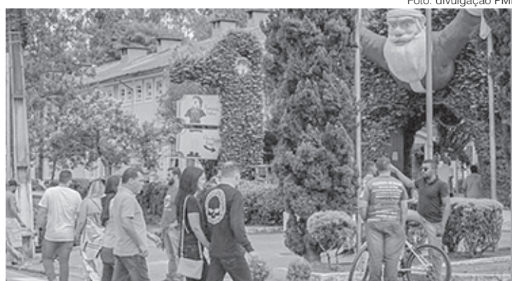
Uma estrutura de container será montada em Penedo com uma programação especial para divulgação das cidades turísticas mais procuradas nesta estação fria

– Estamos muito felizes e com ótimas expectativas em sermos o primeiro destino a receber esse projeto tão importante para o Estado, que foi um sucesso na edição de verão nas cidades de praia – relatou o secretário de Turismo, Denilson Sampaio.