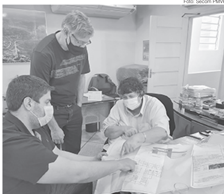
Unidade será construída pelo Governo do Estado do Rio de Janeiro em terreno doado pelo município