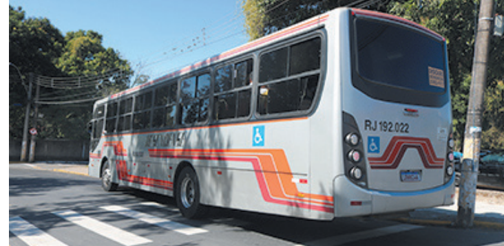
Circulação dos coletivos havia sido interrompida devido à pandemia de Covid-19