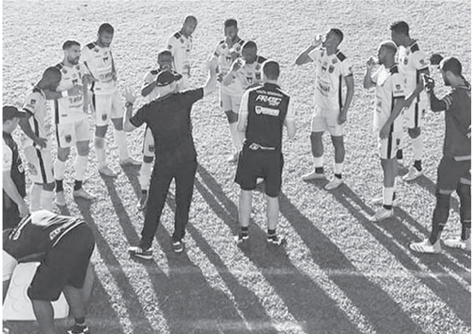
Esquadrão de Aço chega a seis pontos ganhos