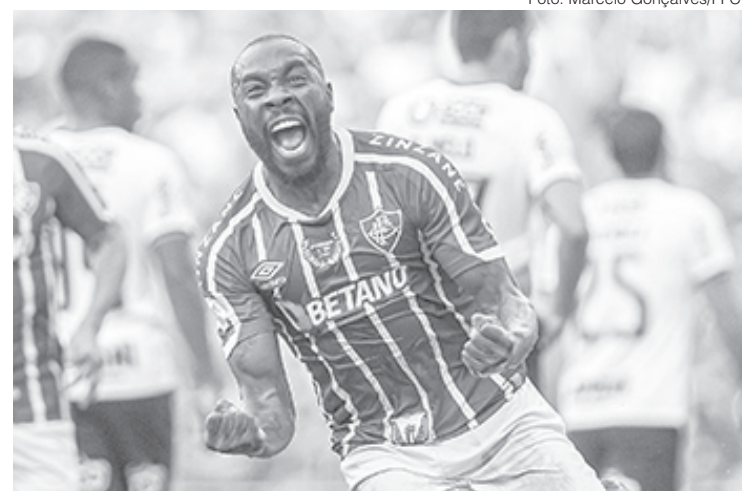
Jogador balançou a rede nos jogos contra Cruzeiro, Botafogo e Corinthians

alcançou a marca em 1916, quando enfileirou gols de pênalti contra Bangu, Botafogo e São Cristóvão. Silveira, por sua vez, conseguiu a façanha em 1972, ao marcar diante de Troyes-FRA, Vojvodina-SER e Borovo-BUL.