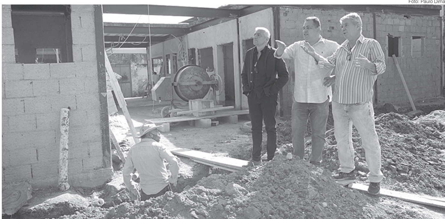
Secretários municipais visitaram obras que têm previsão para serem concluídas até o fim do ano

Desde o início do mandato do governo Rodrigo Drable, Barra Mansa ganhou quatro novas creches. Outras duas estão em construção e mais novidades estão por vir.