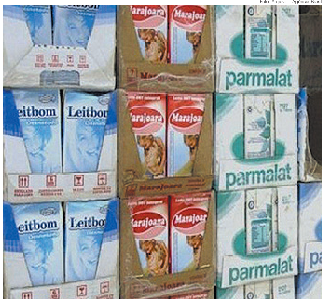
Preço do leite passa a ser preocupação para moradores da região

Produto está acima de R$ 7 reais e alta do preço deve se manter nas próximas semanas