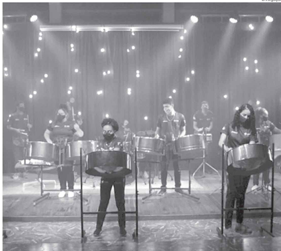
Grupo Tambores de Aço Fundação CSN se apresentará no Centro Cultural com a intervenção 'Luz, Cor e Som'

Além dessas ações, confira outras atrações que fazem parte da programação de aniversário da cidade em: www.centroculturalcsn.org.br