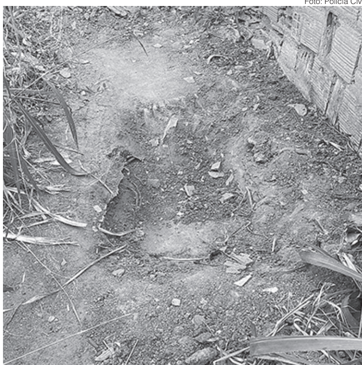
Crime foi no bairro Cotiara, em Barra Mansa

O rapaz responderá por tentativa de ocultação de cadáver. O namorado foi autuado também por tentativa de ocultação de cadáver e por feminicídio.