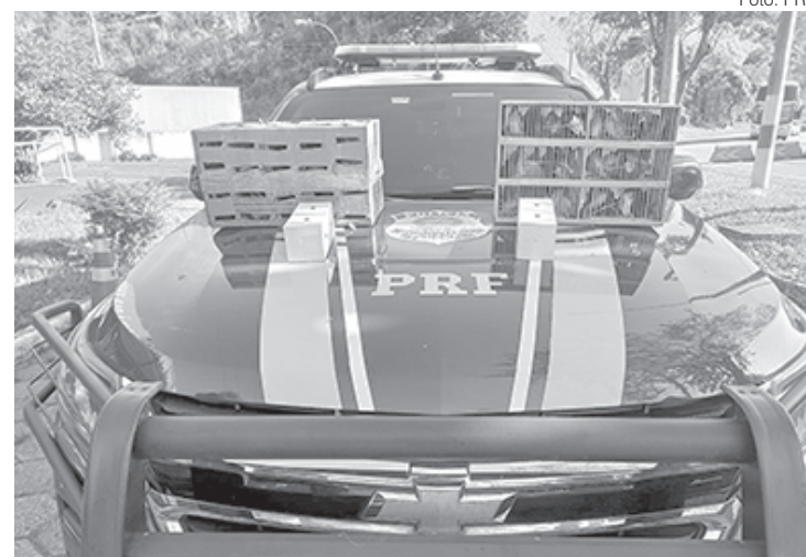
É a terceira vez que o mesmo indivíduo é preso pelo mesmo crime, em menos de um mês