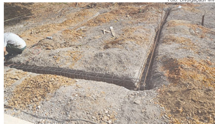
Reforma da Praça do Gato no Água Limpa inclui pista de skate a pedido dos moradores