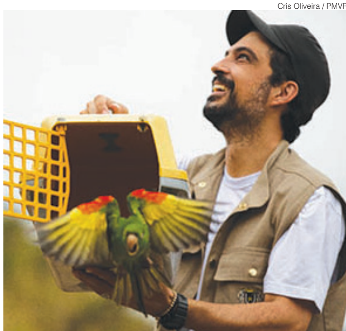
Animais da espécie periquitão-maracanã foram reabilitados no Zoo-VR e ganharam a liberdade nesta quarta-feira (20)

A soltura faz parte de um programa de reabilitação e reinserção de animais silves-