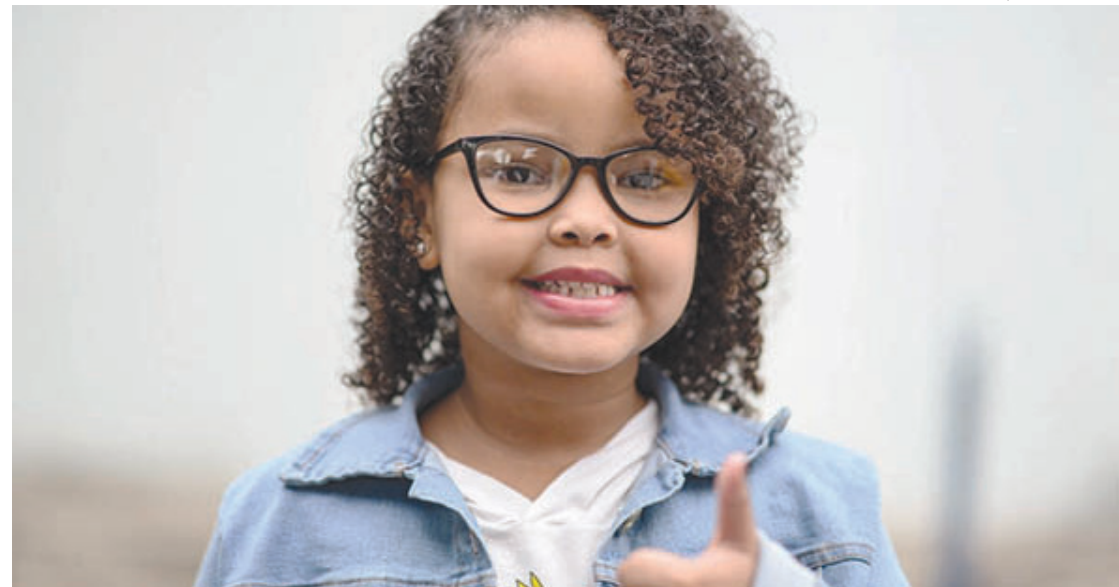
Projeto beneficia alunos da rede municipal de ensino com novas lentes e armações

A Fábrica de Óculos de Barra Mansa completou três anos de funcionamento nesta quarta-feira (20). A unidade já atingiu a marca de 6.000 equipamentos distribuídos. Para celebrar a data, o prefeito Rodrigo Drable entregou uma nova remessa à população que se enquadra nos critérios para receber as lentes e armações de maneira totalmente gratuita. Hoje, a capacidade