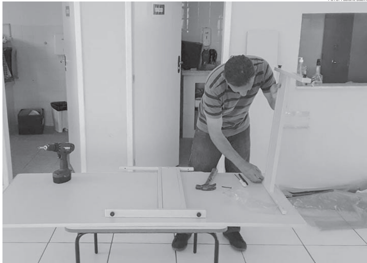
Funcionário prepara sala para curso de capacitação