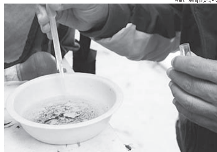
Estiagem e trabalho de vigilância ambiental contribuem para maior controle sobre o mosquito transmissor da dengue, zika e chikungunya