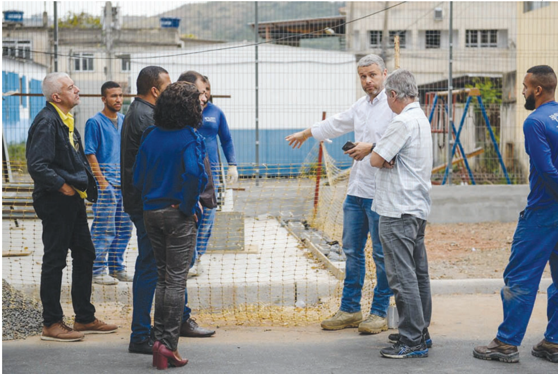
Prefeito e comitiva visitaram seis locais em obras no município