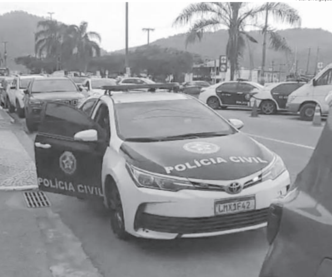
Homem foi levado para a Delegacia Especializada em Atendimento à Mulher de Angra