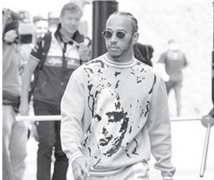
Hamilton é o único piloto a vencer em todas as temporadas em que competiu