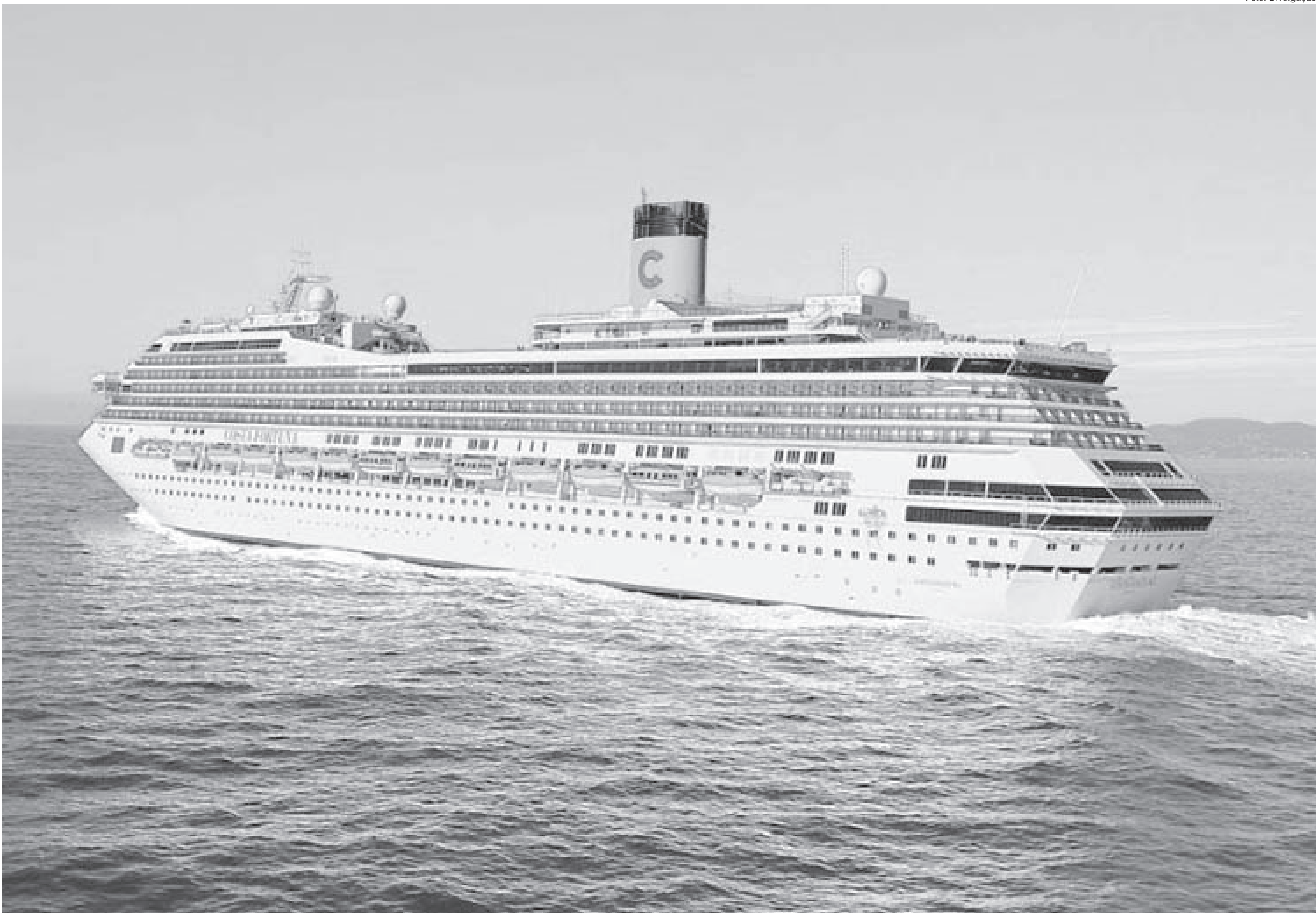
Temporada de cruzeiros 2022-2023 promete ser a maior dos últimos 10 anos