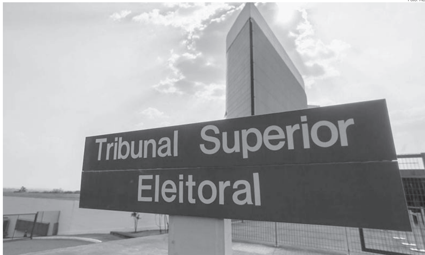
Registro dos candidatos à presidente da República e vice-presidente deverá ser feito no Tribunal Superior Eleitoral