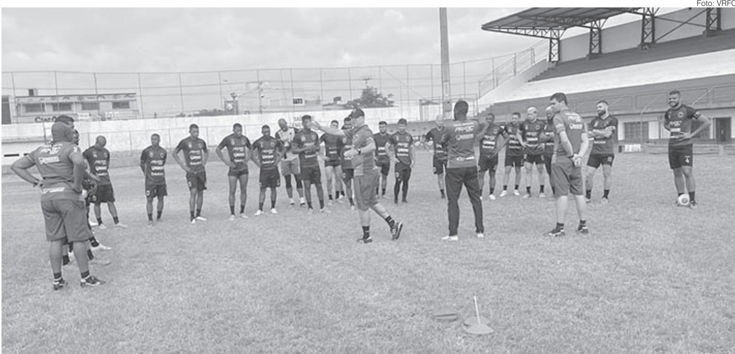
Treinamento realizado no estádio Correão

Partida será nesta quinta-feira, dia 21, às 14h45, no estádio Correão