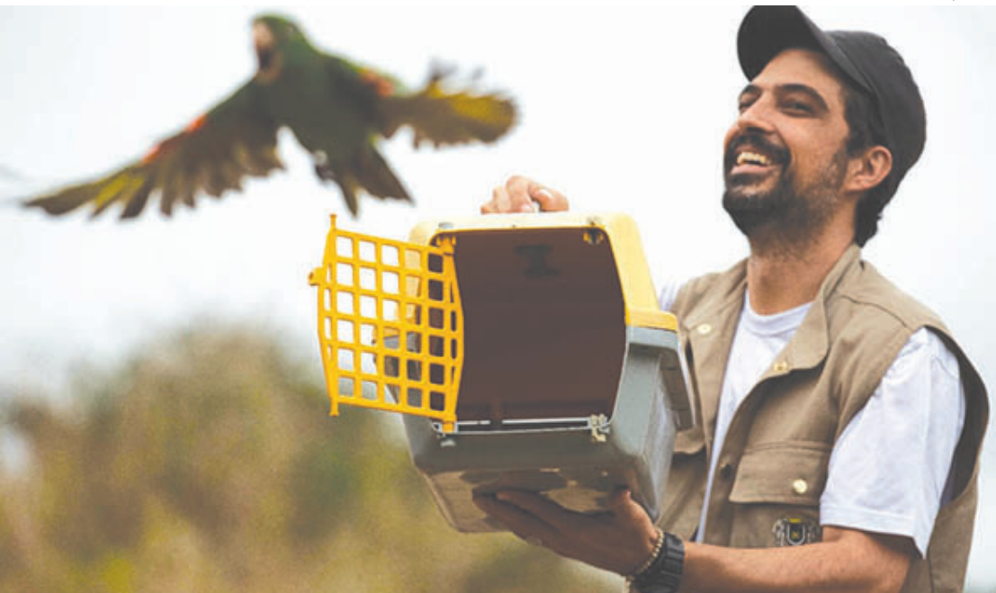
Animais da espécie periquitão-maracanã foram reabilitados no Zoo-VR e ganharam a liberdade ontem

Quinze aves da espécie periquitão-maracanã foram soltas na natureza nesta quarta-feira (20) por funcionários do Zoológico Municipal de Volta Redonda (Zoo-VR). Os animais pas-