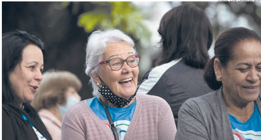
Alegria e a expectativa pelo retorno da viagem fizeram parte do embarque, que ocorreu na Praça Sávio Gama, no Aterrado