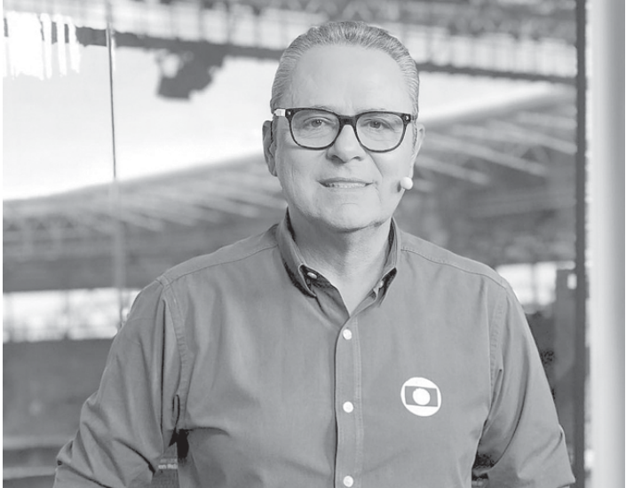
Luis Roberto transmite nesta sexta, às 16h, Bélgica x Itália pela Eurocopa; Everaldo Marques, no SporTV