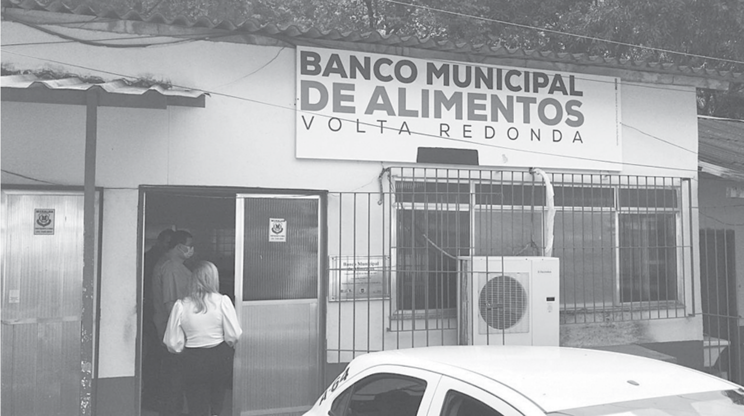
Banco de Alimentos doou cerca de 70 toneladas de alimentos para 26 instituições beneficentes nos últimos seis meses

do programa para seleção, higienização e distribuição. Primeiro, é feita a seleção dos alimentos, que são inseridos em solução clorada. Após enxágue com água corrente, são mantidos sob refrigeração até a doação. Todo processo tem a supervisão de uma nutricionista, que fiscaliza a parte técnica e avalia o estado dos alimentos. O programa conta com sete supermercados parceiros, além da Cooperativa de Produtores de Santa Rita de Cássia e o Programa de Aquisição de Alimentos (PAA) do Ministério da Cidadania, retomado em fevereiro deste ano, que disponibiliza recursos para a compra da produção de agricultores familiares, de todo o estado. Munir ressalta que por meio deste programa, a cada 15 dias, a equipe da prefeitura vai ao Ceasa Irajá, no município do Rio, buscar em torno de uma tonelada a uma tonelada e meia de hor-