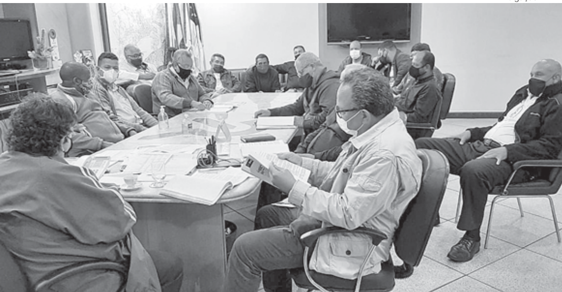
O presidente do Sindicato disse estar otimista com a chegada do aplicativo