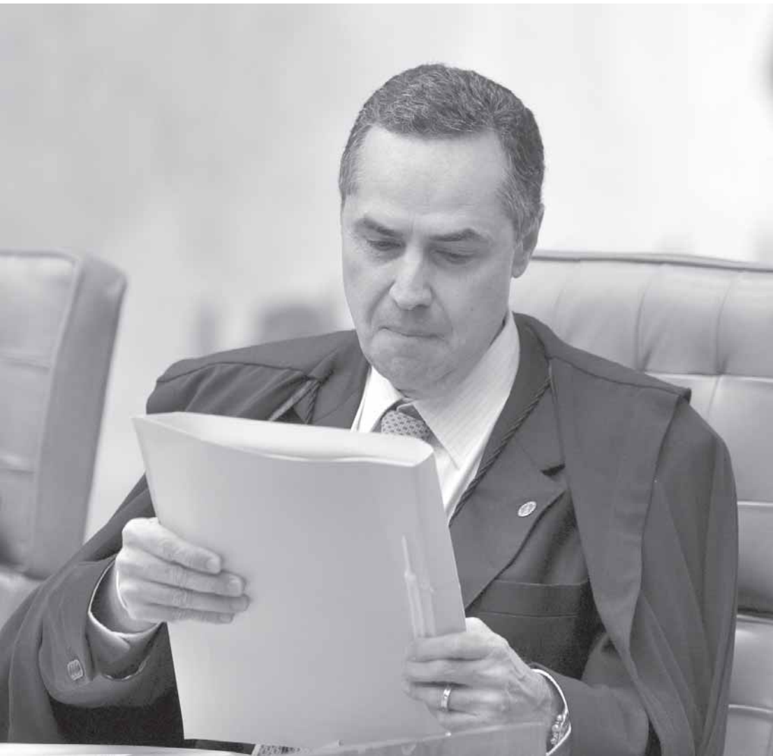
Barroso diz que ‘não verifica, na hipótese, a presença de ato doloso de improbidade administrativa’

Diante do exposto, com fundamento no art. 1.030, V, do CPC, deixo de admitir os recursos extraordinários - conclui o ministro.