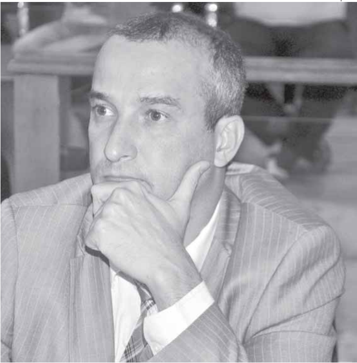
Vereador diz que verba é mais uma conquista de seu mandato para a saúde de Volta Redonda

O parlamentar acrescentou que a verba é mais uma conquista de seu mandato para a saúde de Volta Redonda. “Fui o primeiro parlamentar a defender vacinas para os profissionais da Educação e um dos únicos a chamar a atenção para os pacientes na fila de espera por uma cirurgia de catarata”, enfatizou o vereador, completando: “Fizemos uma campanha maciça para que a prefeitura voltasse a garantir cirurgias desse tipo. A fila estava gigante e muitas pessoas correndo o risco de ficar sem enxergar pra sempre. Agora o governo fez a fila andar. A Saúde não pode parar ainda mais em um momento tão difícil quanto esse que estamos vivendo”, comentou.