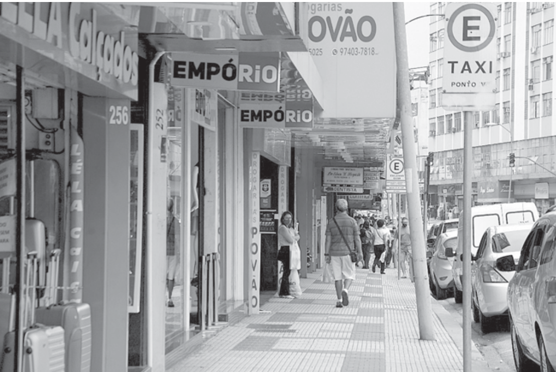
De acordo com o Caged, em VR 2.015 pessoas foram contratadas contra 1.704 que foram demitidas, com saldo final de 311 novos empregos gerados

Metodologia Desde janeiro do ano passado, o uso do Sistema do Caged foi substituído pelo Sistema de Escrituração Digital das Obrigações Fiscais, Previdenciárias e Trabalhistas (eSocial) para as empresas, o que traz diferenças na comparação com resultados dos anos anteriores. Na metodologia anterior (de 1992 a 2019), o melhor resultado para maio na série sem ajustes havia sido em 2010, quando foram criadas 298.041 mil vagas no quinto mês do ano. Por Eduardo Rodrigues