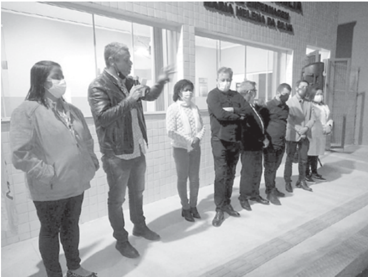
Prefeito Rodrigo Drable destacou o trabalho da Saúde em melhorar os atendimentos aos municípios

Saúde em melhorar os atendimentos aos municípios. “Esse posto não estava à altura da equipe que aqui trabalha, nem da população que é atendida. Nós temos uma equipe que se dedica, isso desde o médico, auxiliar, as agentes de saúde, as visitas e cada uma desses atendimentos é lançado. Assim nós formamos as produções de cada unidade. Barra Mansa recebeu prêmio por produção. Isso é resultado de uma equipe competente, que se dedica. Antes, nós buscávamos atendimento em outras cidades, hoje são eles que vem para cá”. O secretário de Saúde, Dr. Sérgio Gomes, destacou a importância do trabalho e dedicação da equipe da Atenção Básica na melho-