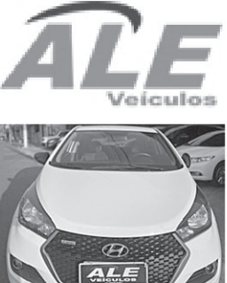
HYUNDAI HB20 R SPEC 1.6 FLEX 16V MEC. 2016

*Freios ABS *Direcao eletrica *Airbags frontais *Ar condicionado *Bancos revestidos em couro *Regulagem do volante *Vidros eletricos *Conexao USB/Bluetooth *Alarme *Trava central *Faróis de neblina *Câmera de estacionamento *Sensor de estacionamento trasero *Ajuste eletrico dos retrovisores *Computador de bordo R$ 56.900,00