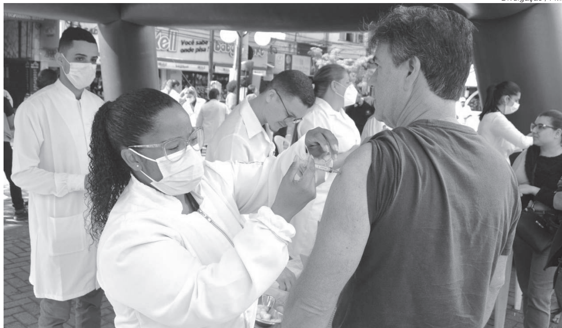
No sábado (6) a vacinação acontecerá no Calçadão do Campos Elíseos e no domingo (7), na Feira Livre do Parque das Águas

Vale destacar que quem tomou recentemente a vacina contra Influenza, não precisa manter um intervalo entre a aplicação para combater a Covid-19. Porém há algumas orientações a seguir como: os pacientes que tiveram Covid recentemente devem aguardar o intervalo de 30 dias para receber a vacina. E aqueles que apresentarem quadro de síndrome gripal precisam aguardar este período passar para tomar a vacina.