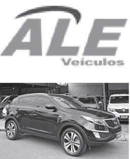
KIA SPORTAGE EX 2.0 AUT. 2014

*Freios ABS *Direcao eletrica *Airbags frontais *Ar condicionado *Bancos revestidos em couro *Regulagem do volante *Vidros eletricos *Conexao USB/Bluetooth *Alarme *Trava central *Faróis de neblina *Câmera de estacionamento *Sensor de estacionamento trasero *Ajuste eletrico dos retrovisores *Computador de bordo *Central multimidia. R$ 79.900,00