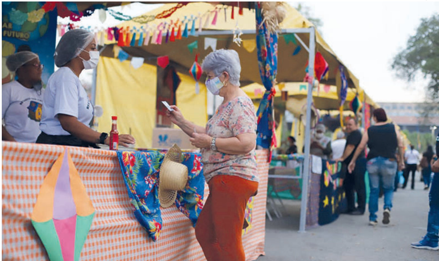
Produtos são comprados apenas com dinheiro, pois as barraquinhas não têm máquinas de cartão e não aceitam Pix

- Está uma delícia, como sempre. Já estive em várias edições do ‘Arraiá’ e estou