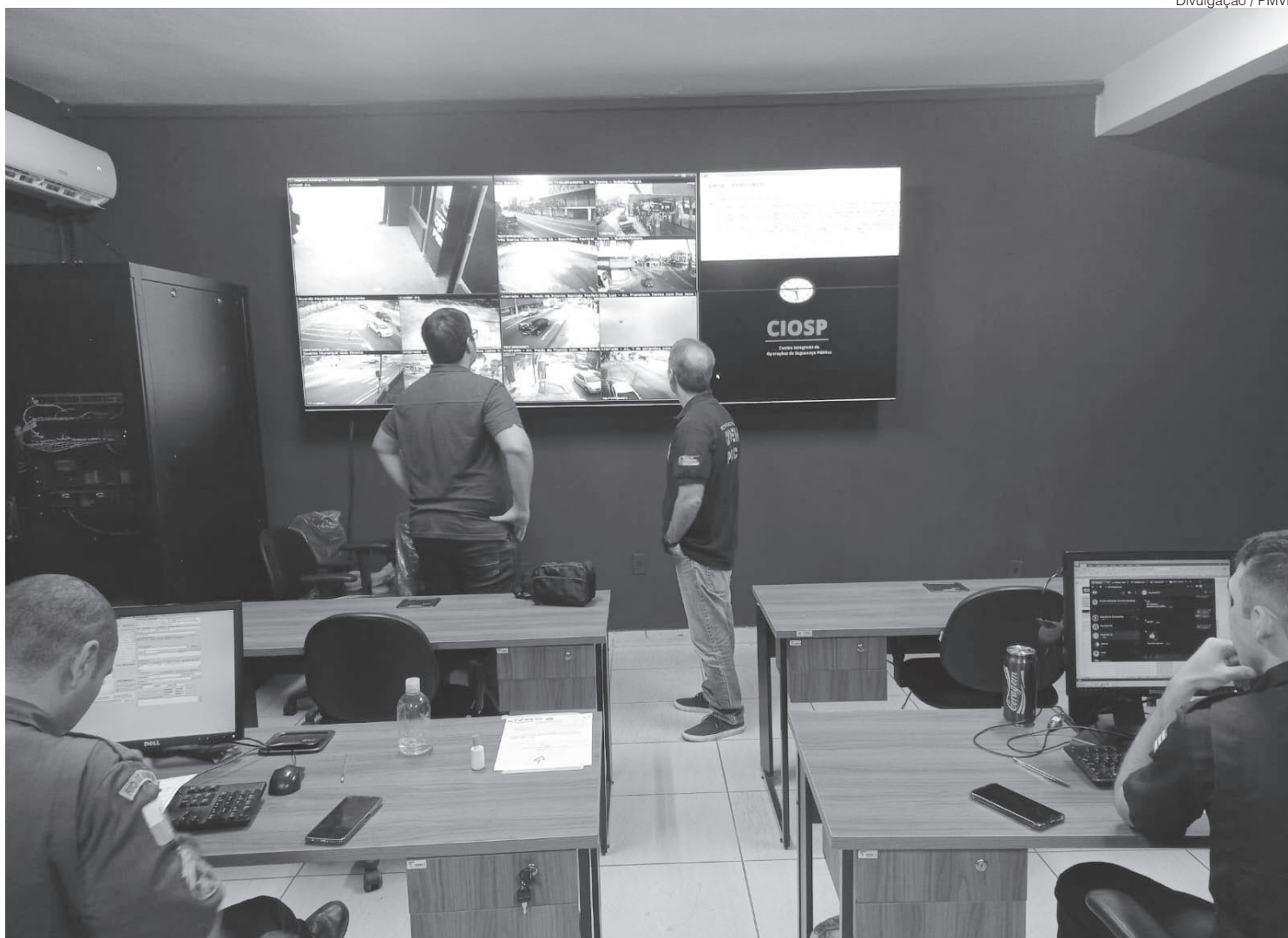
Medida permite ampliar o alcance da rede, que é gerida pelo Centro Integrado de Operações de Segurança Pública (Ciosp)

A disponibilização gratuita das imagens será feita por meio de Termo de Cessão de Imagens. A prefeitura poderá celebrar acordos de cooperação técnica junto aos