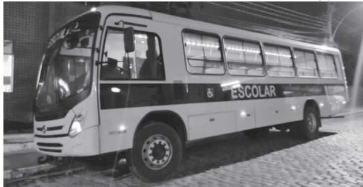
Veículo zero quilômetro foi adquirido recentemente pelo governo municipal

Com o transporte adaptado e com segurança, ga-