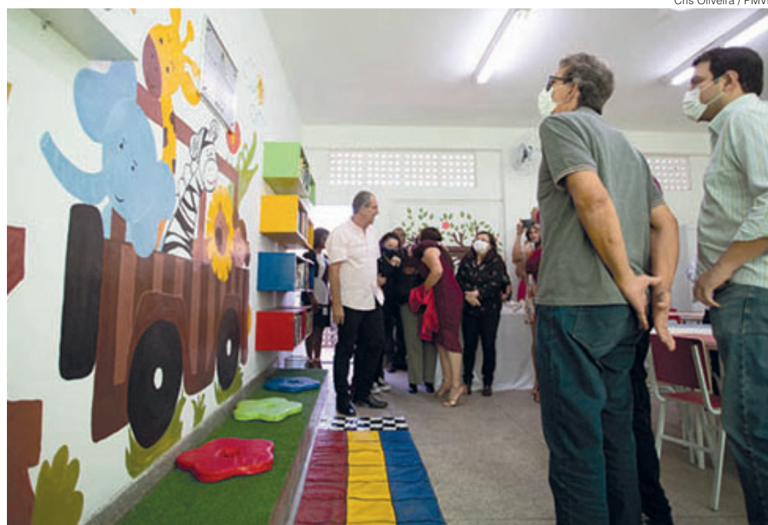
Espaço da unidade de ensino foi reformado e inaugurado nesta quinta-feira (4)

A nova Sala de Leitura Therezinha dos Santos Gonçalves foi modernizada e ganhou nova formatação, com espaços definidos para leitura, mais relaxante, e móveis para estudo. O local atende os cerca de 700 alunos da unidade, divididos entre o 1º