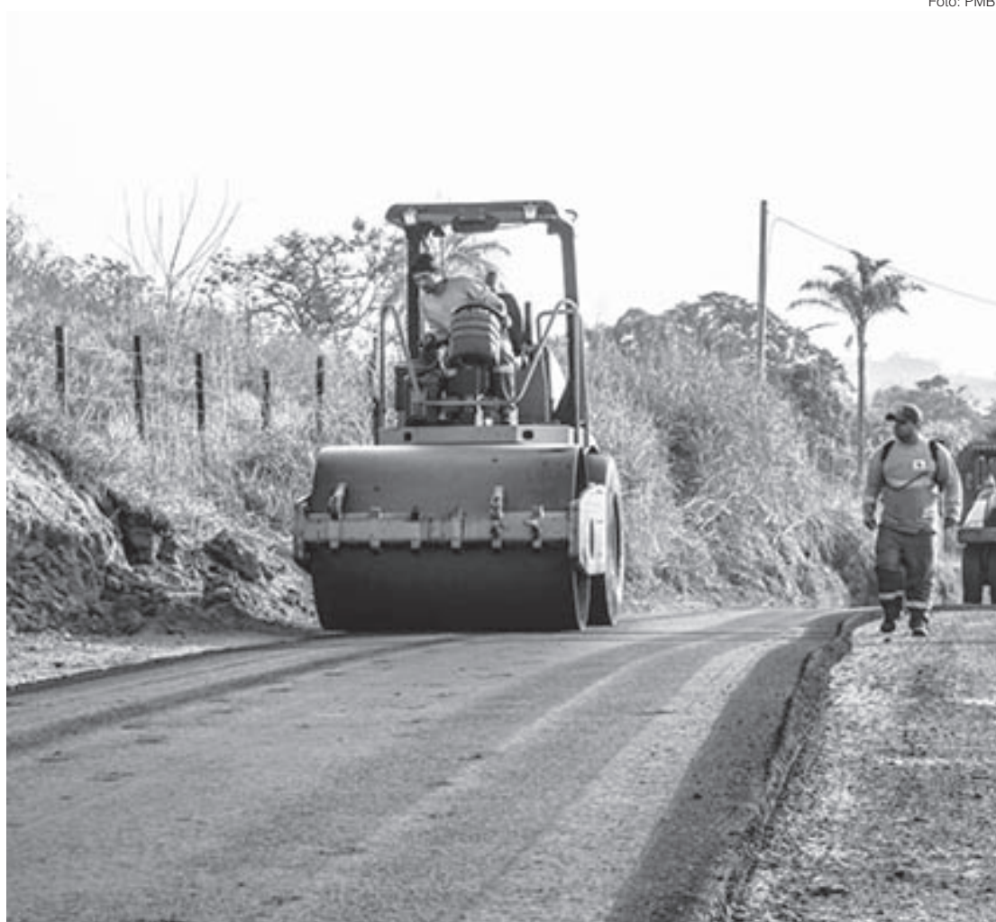
Pavimentação da estrada que liga o distrito sede a Vargem Alegre já tem ordem de serviço

— A pavimentação asfáltica dessa estrada é de suma importância, uma vez que, além ser um caminho alternativo ao pedágio, é uma via de escape para aqueles homens e mulheres do campo que querem escoar sua mercadoria. Através desse projeto, os trabalhadores rurais poderão tirar do campo o seu sustento e o de sua família — explica o secretário.