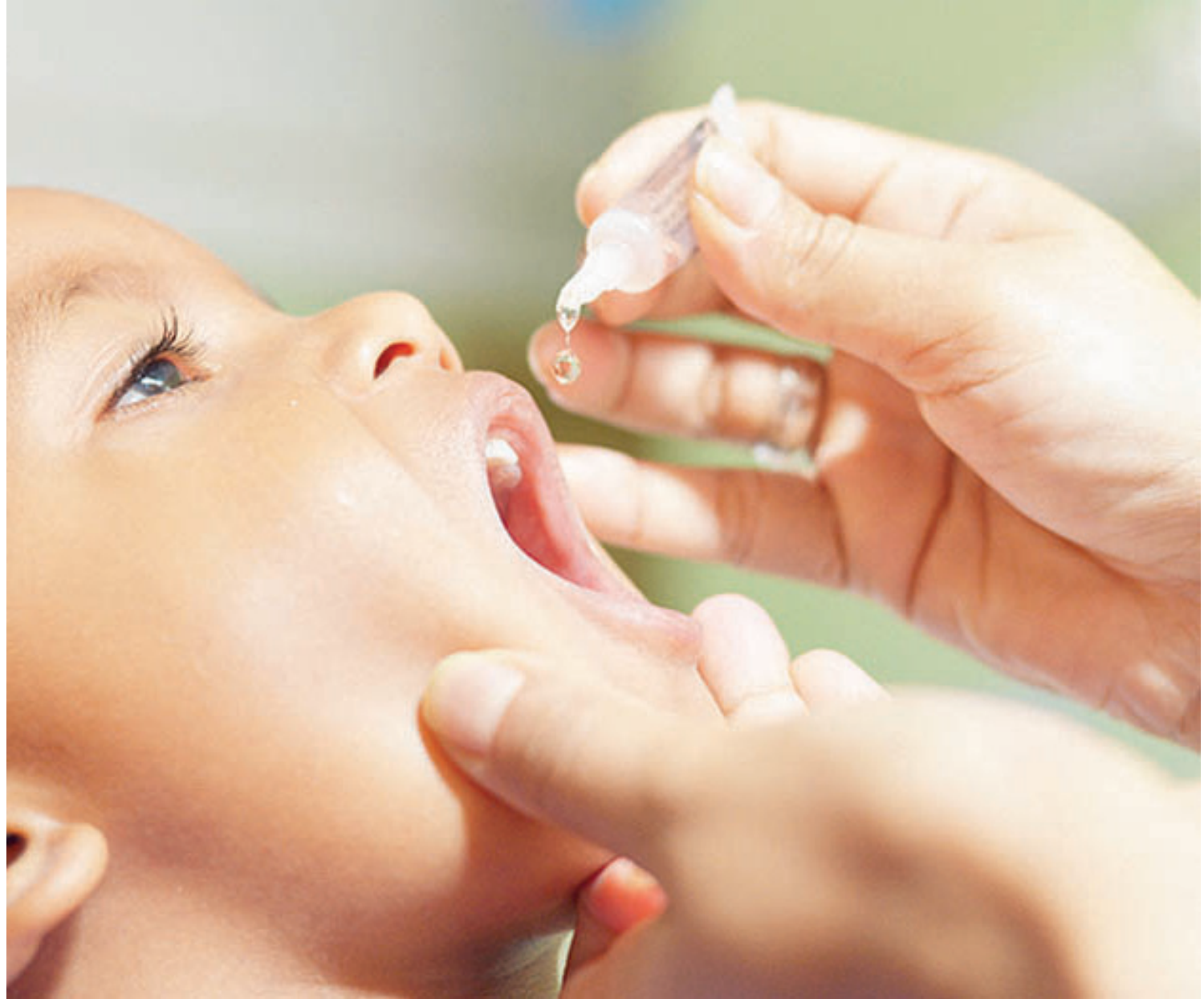
Meta é imunizar 95% das crianças de 1 a 4 anos contra pólio e atingir cobertura vacinal de 95% das demais vacinas em menores de 15 anos

Carlos ainda ressaltou que, no outro final de semana (dias 13 e 14 de agosto), durante o plantão de vacinação, as vacinas para adolescentes e adultos também serão oferecidas em locais externos.