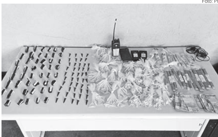
PM informaram que foram alertados por populares sobre os suspeitos de tráfico