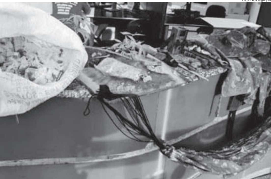
Agentes apreenderam objetos usados na rinha de galo, roupas usadas para se camuflar em mata e pássaros