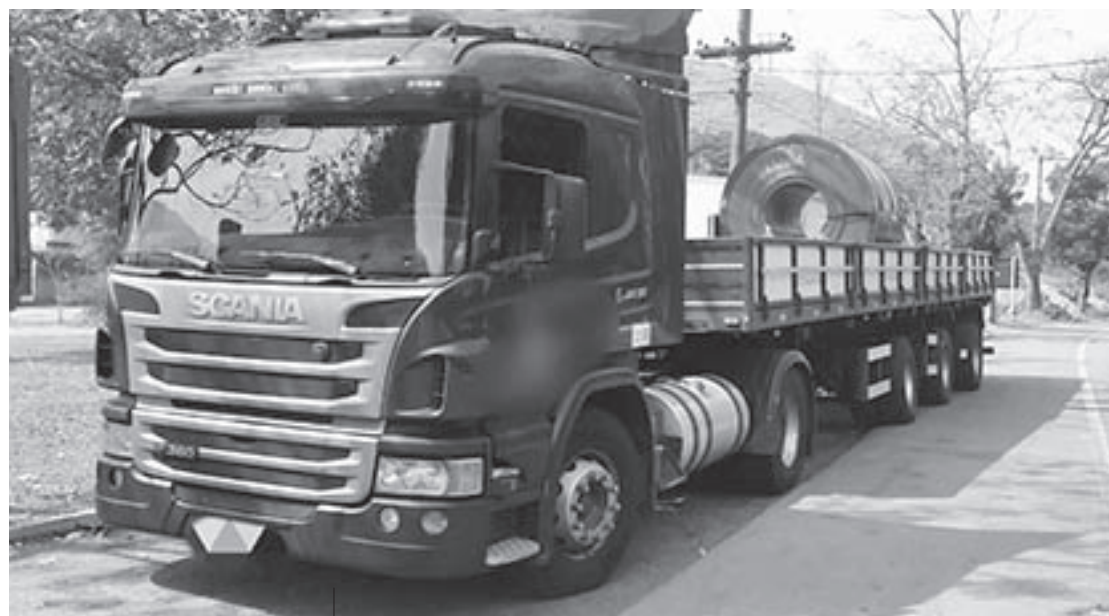
O transporte deste tipo de produto em desconformidade com as normas põe em risco a segurança do trânsito

O motorista foi multado e a carreta retida até que a situação fosse regularizada.