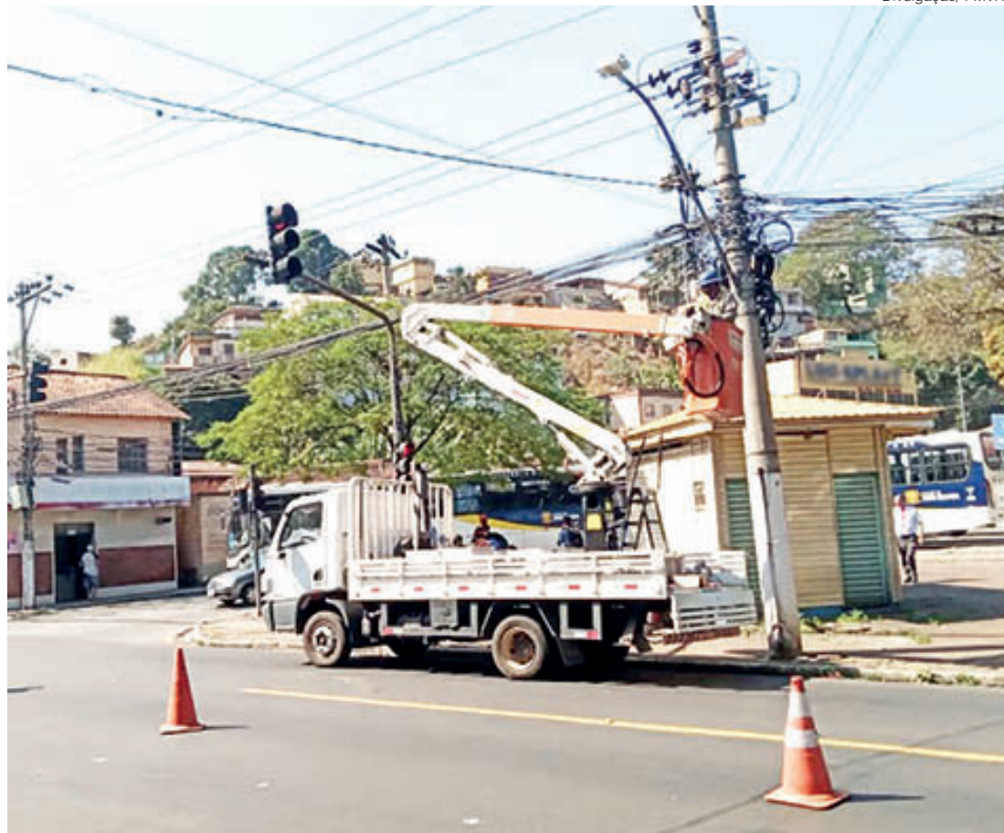
Equipes do Plano de Mobilidade Urbana atuam simultaneamente em áreas dos dois lados do Rio Paraíba do Sul