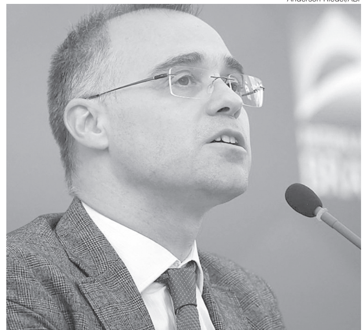
Atual advogado-geral da União, André Mendonça é pastor da Igreja Presbiteriana Esperança de Brasília