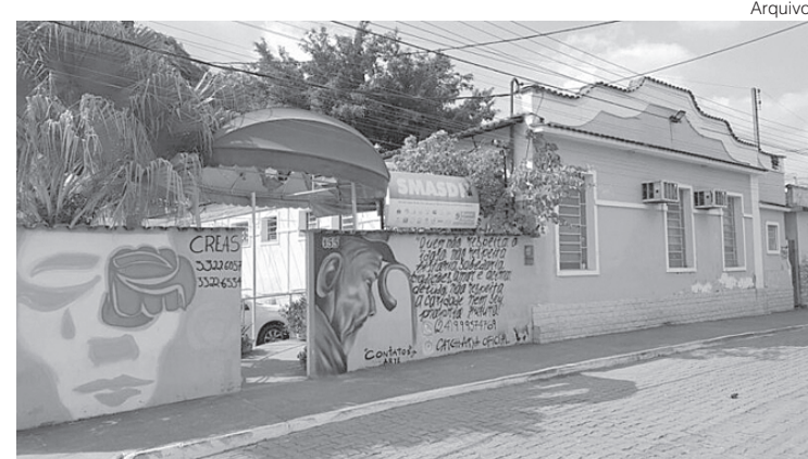
Foram 2.049 inscritos que estão concorrendo por 109 vagas

horas para se apresentarem. Caso contrário, será chamado o próximo na ordem de classificação. Se por qualquer impedimento o candidato selecionado, mesmo tendo comparecido