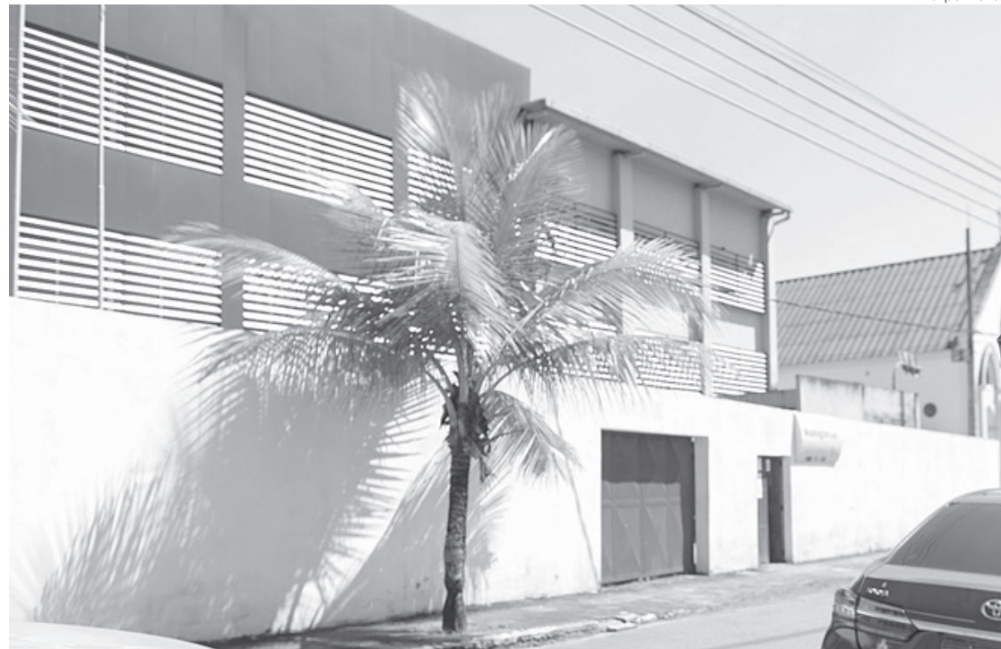
Ao todo, 90 vagas serão disponibilizadas gratuitamente, e curso iniciará dia 1º de agosto

Para se matricular, será necessário apresentar três fotos 3x4, cópias da certidão de nascimento, RG, CPF, declaração de conclusão do ensino médio original ou cópia do histórico do ensino médio e cópia do comprovante de residência para o passe escolar, pois os alunos têm direito ao transporte gratuito. O curso iniciará dia 1º de agosto e será voltado para a área de empreendedorismo. A duração é de 18 meses, com