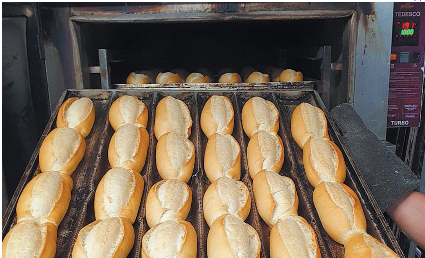
Pão pode ter aumento no preço por causa do reajuste da energia elétrica

CDL-BM diz setores mais atingidos pelo reajuste devem ser padarias, supermercados e açougues que usam maquinário pesado