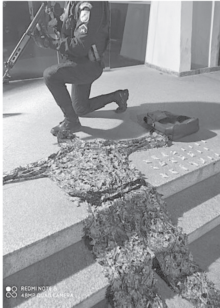
Foram apreendidos pinos de cocaína e um conjunto camuflado

Ainda em Resende, dois jovens de 18 anos, outro de 24, foram detidos pela Polícia Militar na