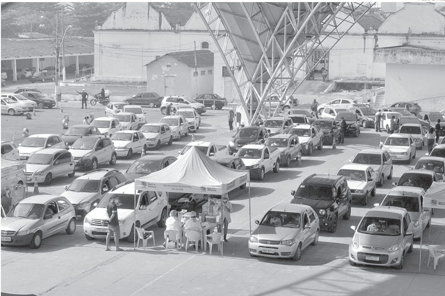
Barra Mansa adotou o formato de vacinação drive-thru, a Tenda da Vacina e o Teatro, todos no Parque da Cidade