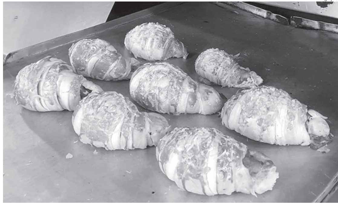
Setor de padaria sofreu um queda de 30% nas vendas na pandemia e aumento da conta de energia pode prejudicar ainda mais no custo final

Para o setor de padarias o custo com a energia é muito alto e esse reajuste veio em um momento já difícil, quando a nossa matéria prima, que é a farinha de trigo, teve um aumento de cem por cento. Muito nos preocupa tudo o que vem acontecendo e o nosso maior medo, além do aumento, é que o país enfrente um possível apagão. Porque pior do que ter que pagar caro é não ter energia e ficar sem produzir. Estamos passando por uma situação muito preocupante – diz o empresário.