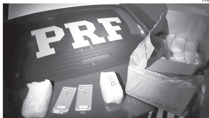
Mercadorias foram avaliadas em R$300.000,00

De acordo com a PRF, durante abordagem, os ocupantes apresentaram nervosismo, alegaram que trabalhavam com telefonia e, ao ser realizada revista no porta-malas do veículo, havia