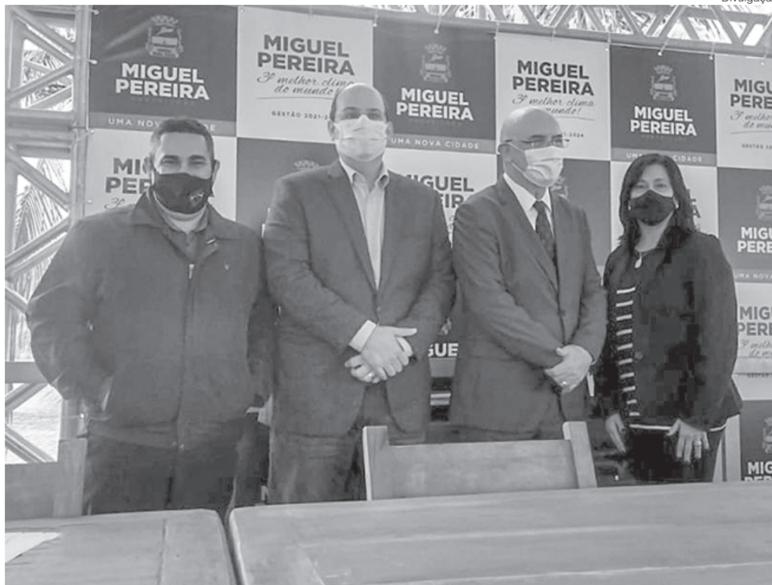
Ministro da Educação se reúne em Miguel Pereira com secretários de diversas cidades da região