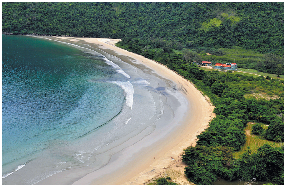
Toda a população da Ilha Grande será vacinada contra a Covid-19