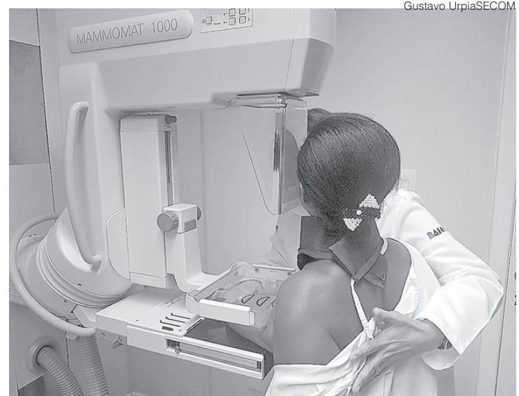
SBM, que alerta para possíveis confusões entre uma reação comum ao imunizante e sintomas de câncer de mama