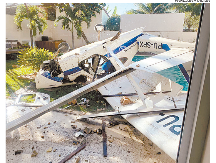
Ultraleve caiu no quintal de casa em um condomínio na Barra

A infectologista Tânia Vergara também acredita que um número maior de testes é positivo para o controle da doença: “Para controlar uma epidemia, primeiro aumenta o diagnóstico. Segundo, isola as pessoas com suspeita até que se confirme ou não. Uma vez com a confirmação, elas devem cumprir o isolamento até que todas as lesões desapareçam. Isso, em geral, demora cerca de 21 dias”.