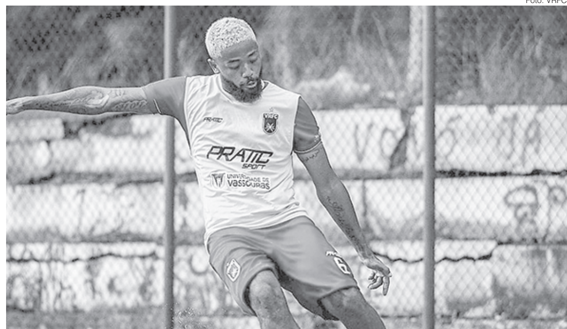
Duelo é o primeiro jogo da final do Campeonato Carioca A2