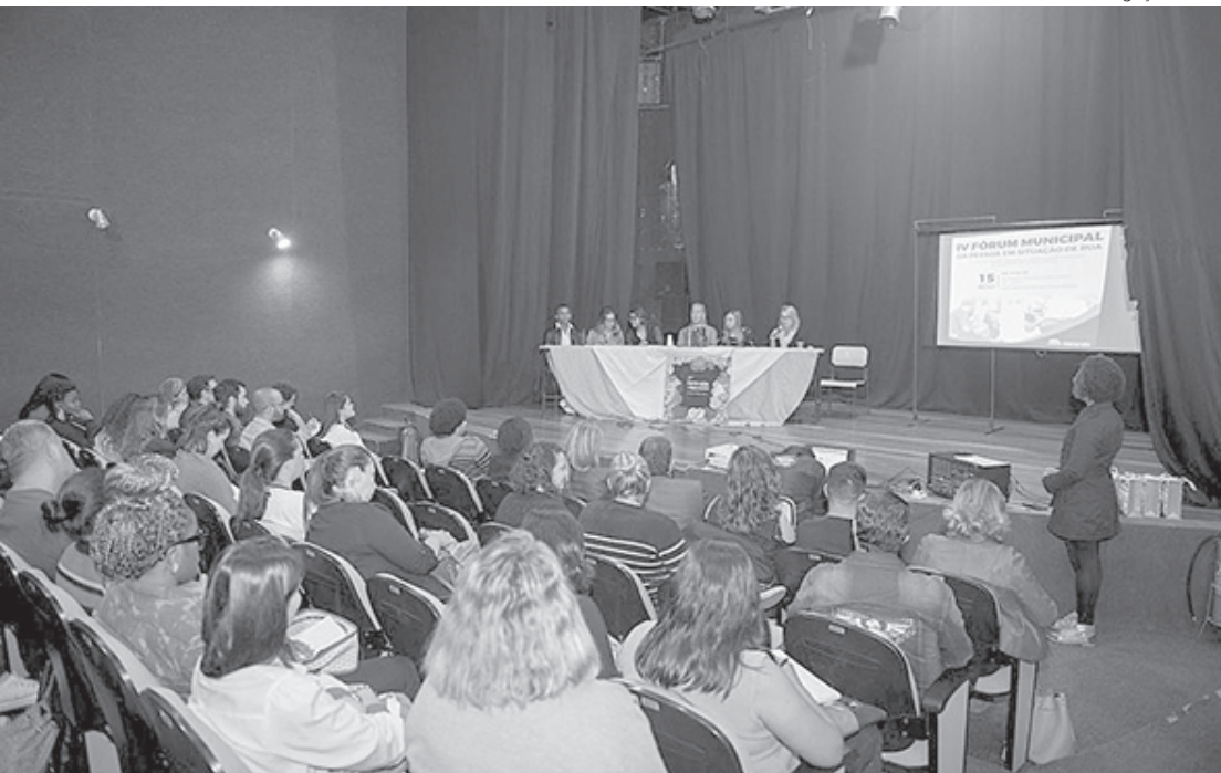
Objetivo é dialogar sobre os desafios do atendimento às pessoas em situação de rua na região