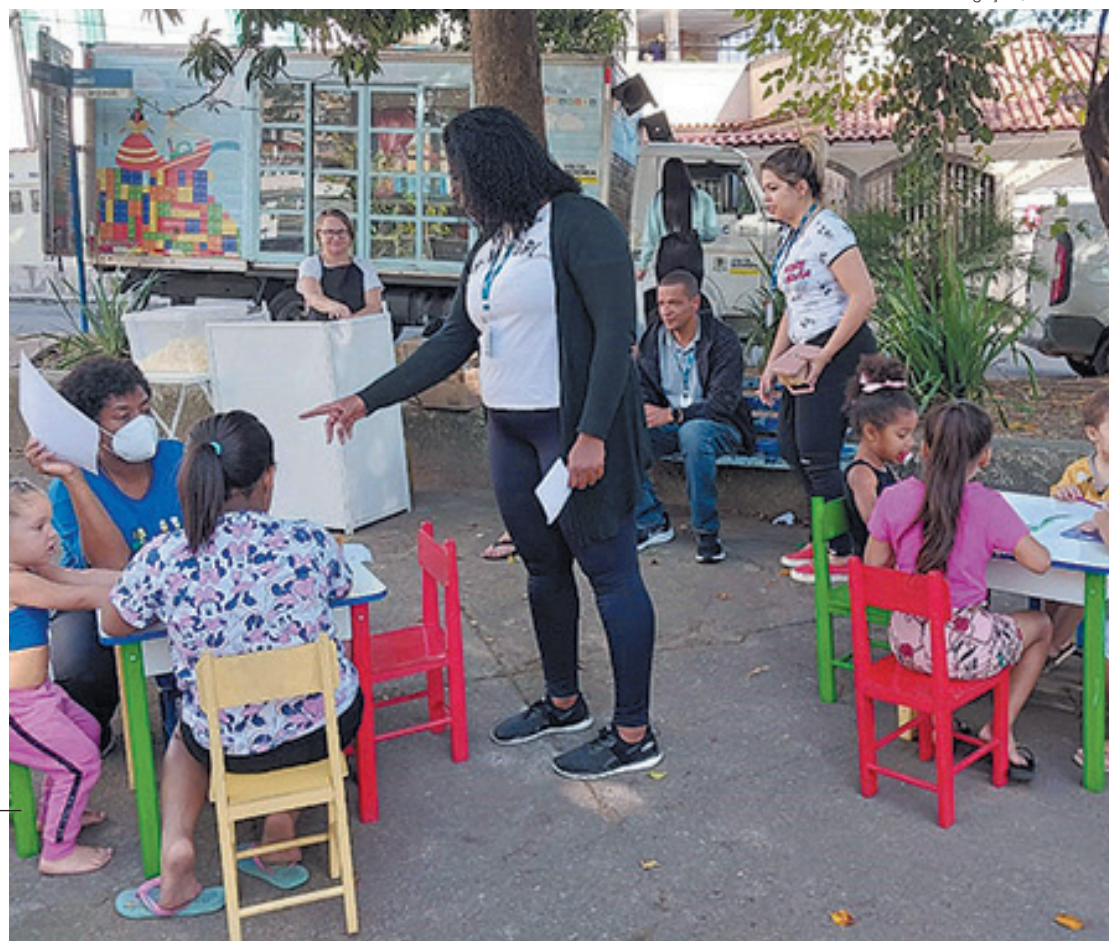
Ações começaram nesta terça-feira (16) pelos CRAS do Santo Agostinho e Açude