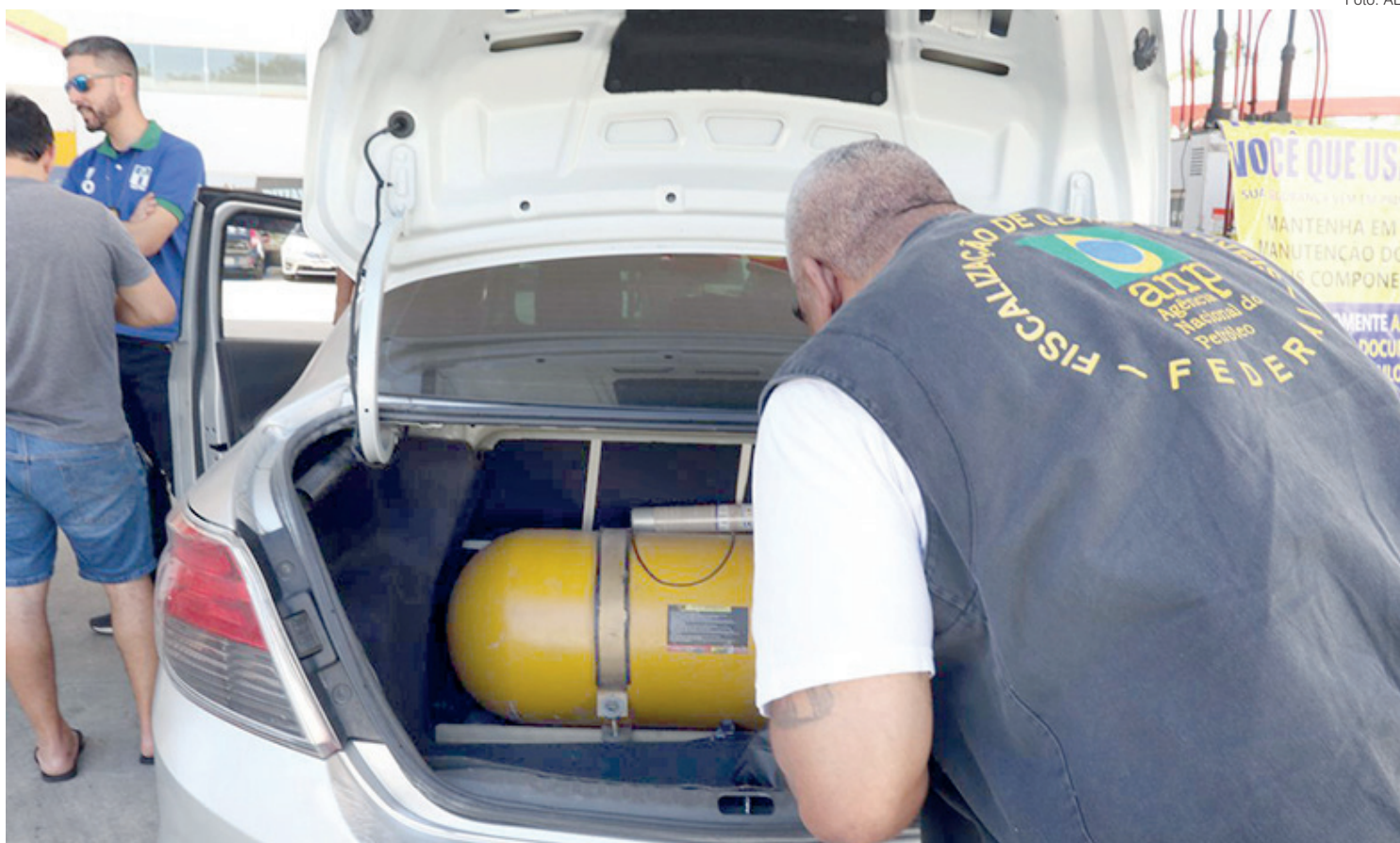
Ainda nesta semana, a fiscalização voltará às ruas hoje e na quinta-feira

De acordo com o chefe da fiscalização não cabe aos postos verificar se os kits estão em condição regular. “Isso tem que partir do consumidor. Ele tem que ter noção que a vida dele e de quem está ao seu lado está em risco. Apesar do GNV ser um combustível bem se-