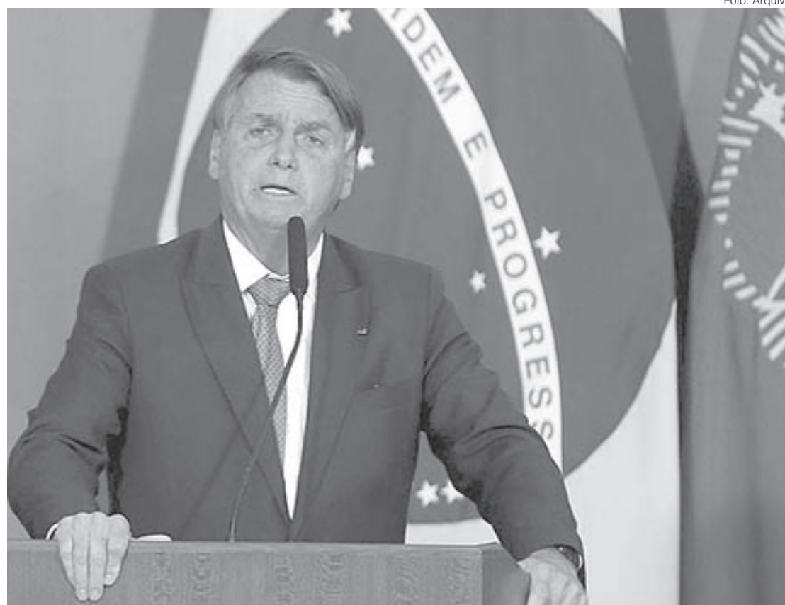
Bolsonaro fala sobre a atuação do seu governo no enfrentamento da pandemia de covid-19