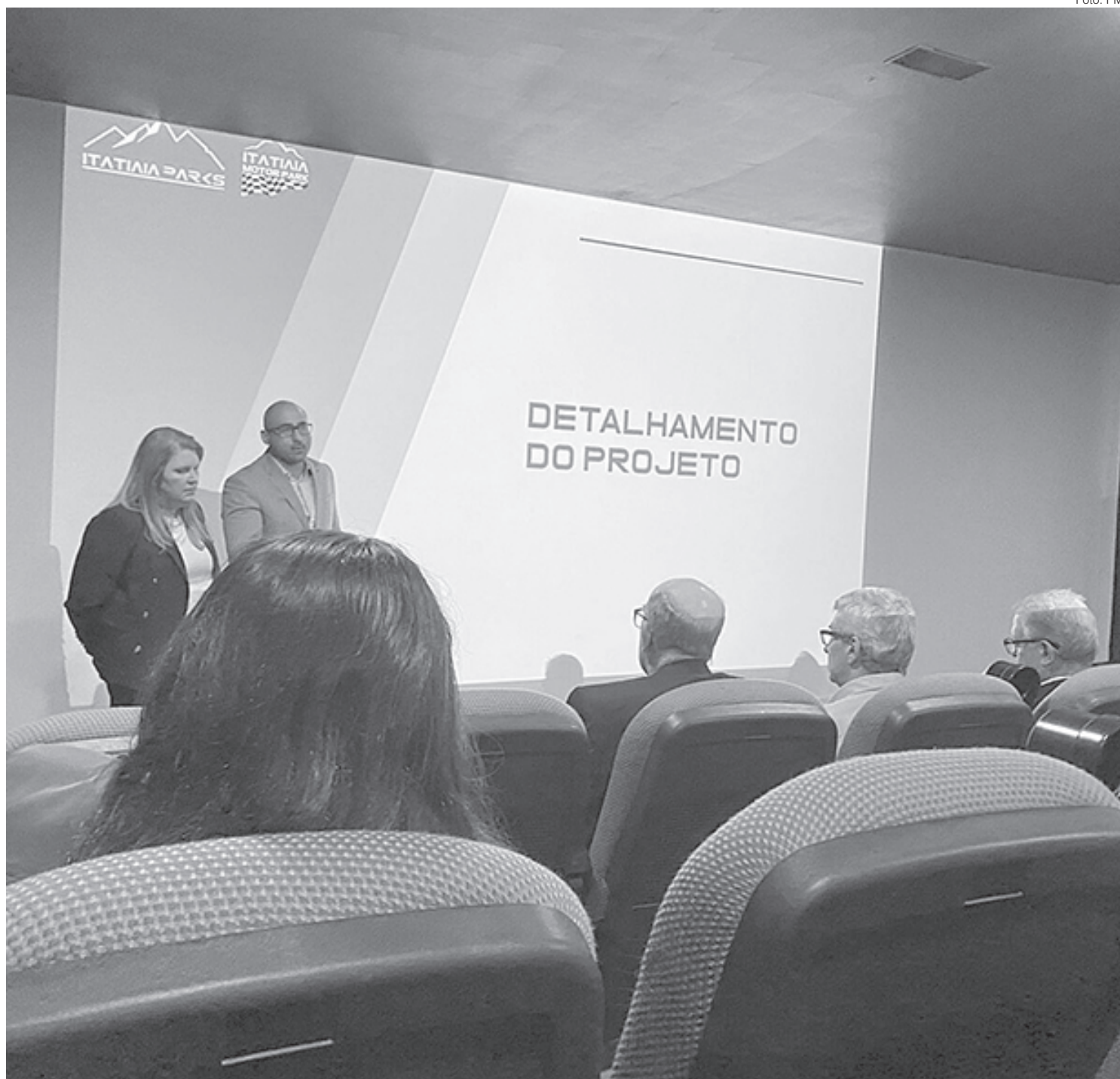
Itatiaia Motor Park permitirá que o Estado do Rio volte a contar com autódromos

A ideia é que o Estado do Rio de Janeiro volte a ter condições de sediar grandes competições movimentando a economia da região, gerando empregos e contribuindo para a o desenvolvimento de novos negócios.