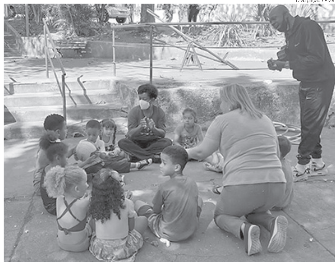
Ações começaram nesta terça-feira (16) nos CRAS Santo Agostinho e Açude com o tema “É brincando que se aprende”

O programa funciona nos CRAS e está em mais de 30 bairros de Volta Redonda, onde foi identificada maior