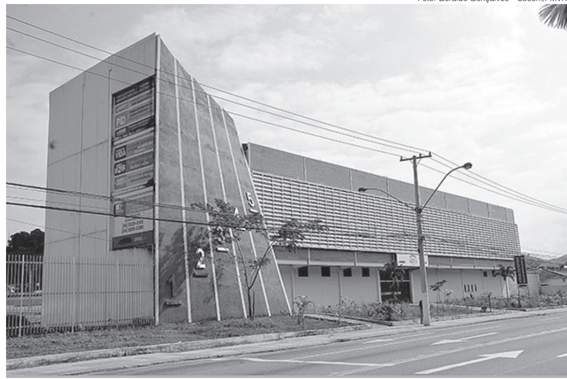
Abertura dos Jogos Estudantis está marcada para o dia 16 de setembro, na Arena Esportiva do bairro Voldac

A abertura dos Jogos Estudantis está marcada para as 14h do dia 16 de setembro, na Arena Esportiva do bairro Voldac. A cerimônia de encerramento oficial e entrega da premiação para a escola campeã geral do Jevre 2022 será no dia 18 de novembro.