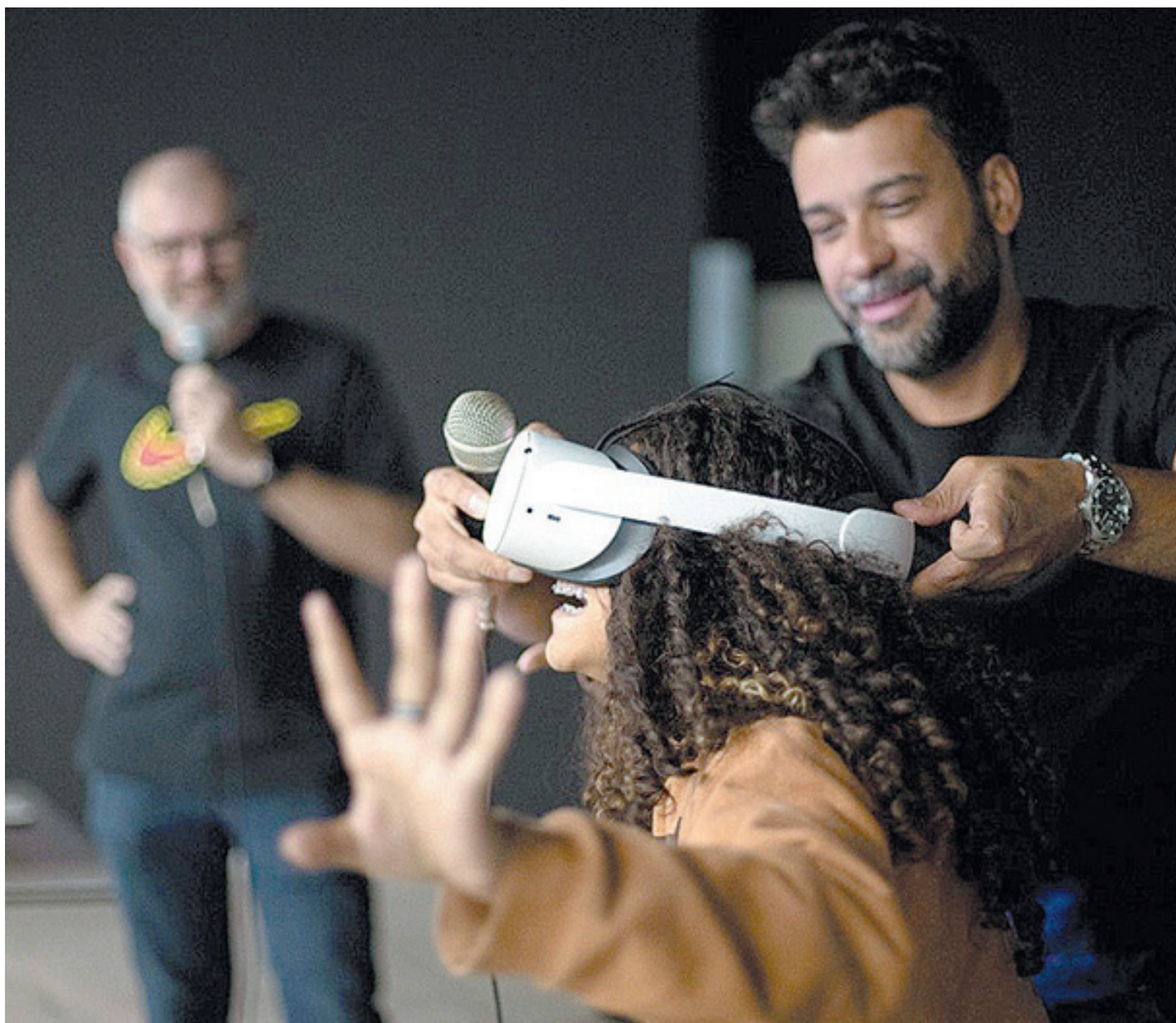
Jovens presentes na palestra não apenas aprenderam sobre o metaverso, como também vivenciaram