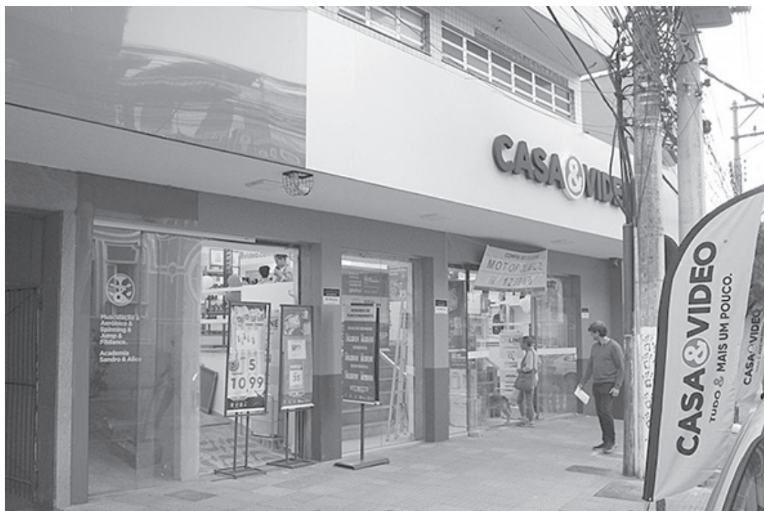
O empreendimento fica localizado à rua Paulo de Frontin, no Centro de Barra do Pirai

Aiex, a vinda da Casa&Vídeo era muito aguardada em solo barrense. Para ele, a loja âncora tende “a provocar o aquecimento econômico em diferentes formas”, tanto entre a competitividade de preços quanto no quesito de emprego e geração de renda.