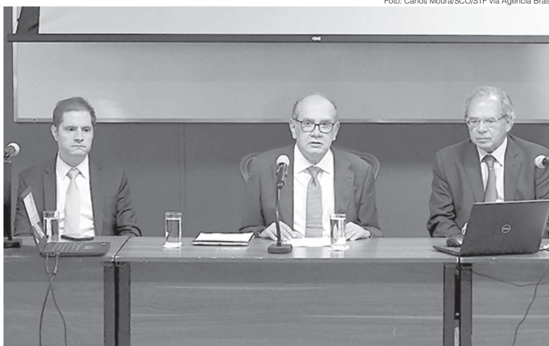
Guedes afirma que, se estados perderem receita com teto de ICMS, medida poderá ser revista

“Todo mundo deve ter uma posição mais confortável hoje. Agora, começam a