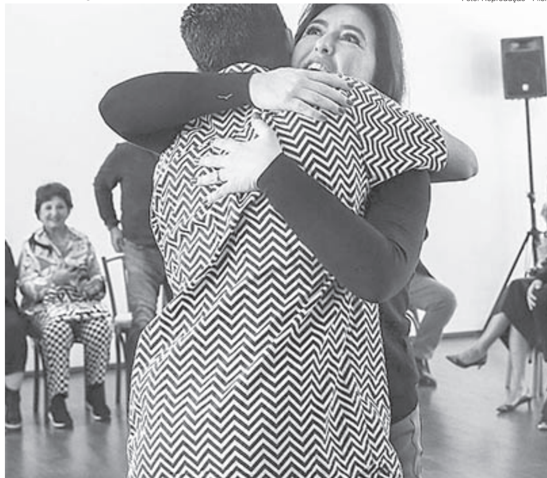
Em meio a nomes da cultura, ela promete recriar Ministério da Cultura