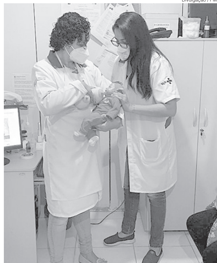
Agosto Dourado é de palestras, orientações e rodas de conversa sobre a importância do aleitamento materno