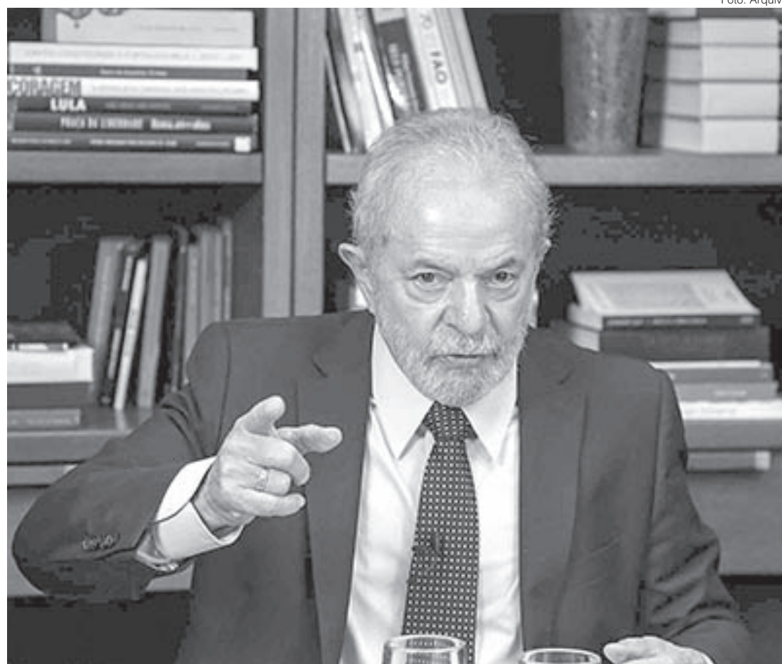
Lula lembrou os tempos de liderança sindical na região