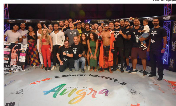
O evento contou com 12 lutas principais de MMA e mais de 20 lutas infantis de jiu-jitsu realizadas por projetos sociais

O evento foi espetacular, com lutas eletrizantes. A equipe