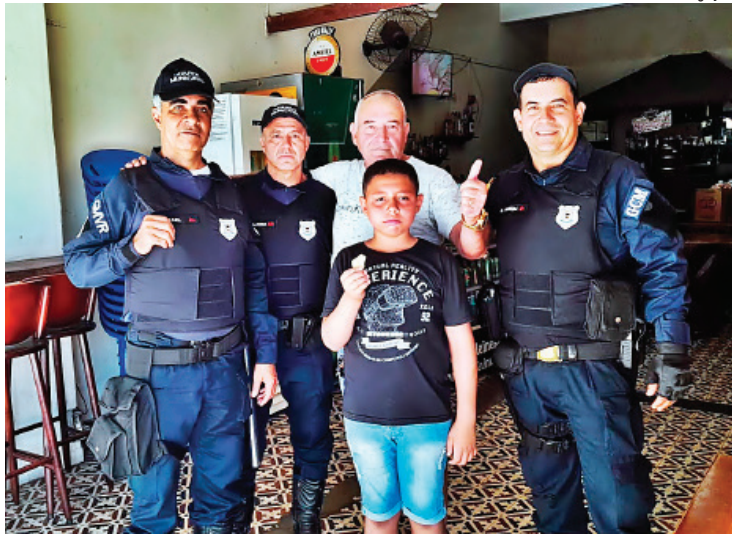
Menino de 8 anos se perdeu neste domingo (24)