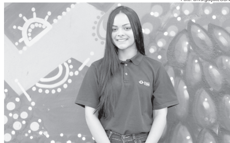
São mais de 200 vagas em Volta Redonda para jovens que buscam oportunidade de formação profissional