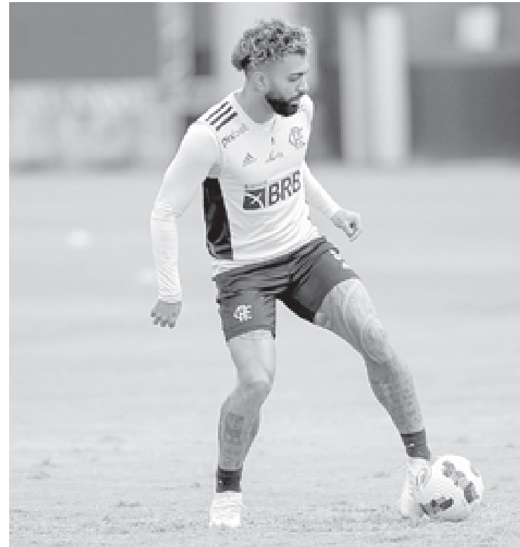
Jogo de ida das semifinais acontece nesta quarta-feira (24), às 21h30, no Morumbi

A vitória foi inesquecível, com direito a goloça de placa. Quando o juiz apitou o fim de Atlético 0 x 1 Flamengo na Arena da Baixada, na última quarta-feira (17), não foi apenas a história da edição de 2022 da Copa do Brasil que ficou marcada – foi a de toda a competição. No jogo de ida da semifinal, o Mais Querido vai atingir a marca de 200 jogos pelo torneio, se sagrando como primeiro time do país a alcan-