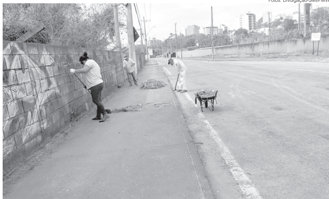
Funcionários da Secretaria Municipal de Infraestrutura realizam serviços roçada, limpeza, reparos e retiradas de entulho

Também serão feitas manutenções e reparos no Jardim Paraíba, na Praça Ademir Pinto; na Voldac, no 28º BPM; no Santa Rita do Zalur, na Praça da Av. Nossa Senhora do Amparo; no