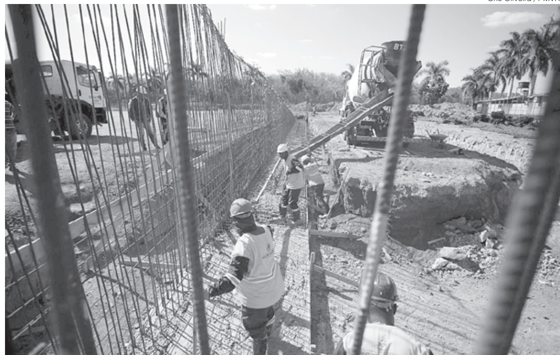
Estrutura faz parte de um projeto maior de Mobilidade Urbana que vai ajudar a desafogar o trânsito da cidade