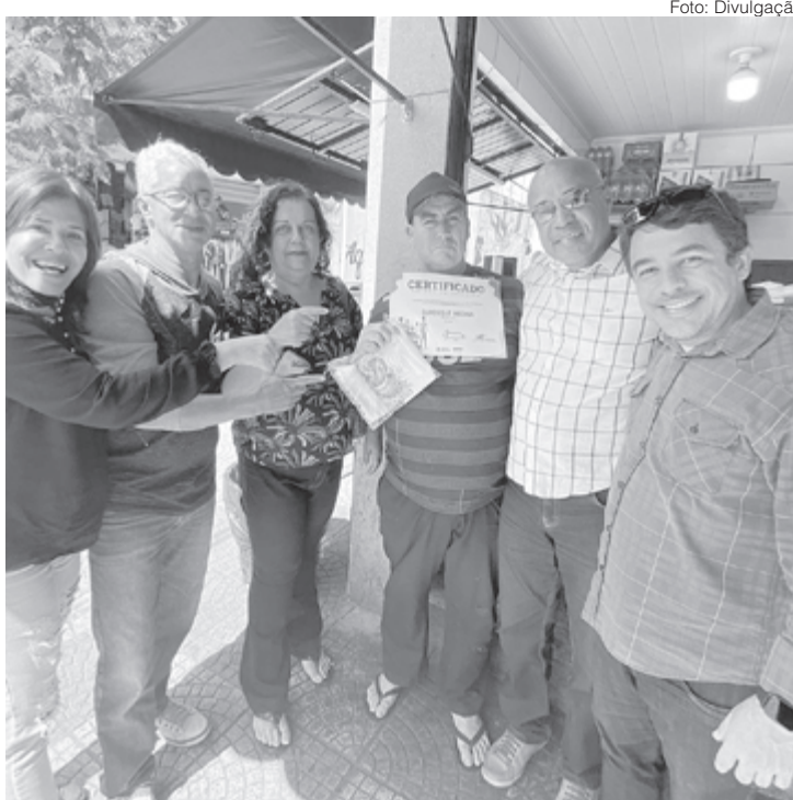
Empresas que receberam certificado adquiriram material produzido por professora de artes que é deficiente auditiva

ais. “No meu atual mandato, conseguimos destinar recursos para a reforma de muitas moradias, melhorias na infraestrutura das cidades, geração de empregos, além de capacitações e oportunidades para a juventude”, explica o parlamentar que se coloca como candidato porque acredita que pode contribuir ainda mais pela população de todo o estado, pela Alerj.