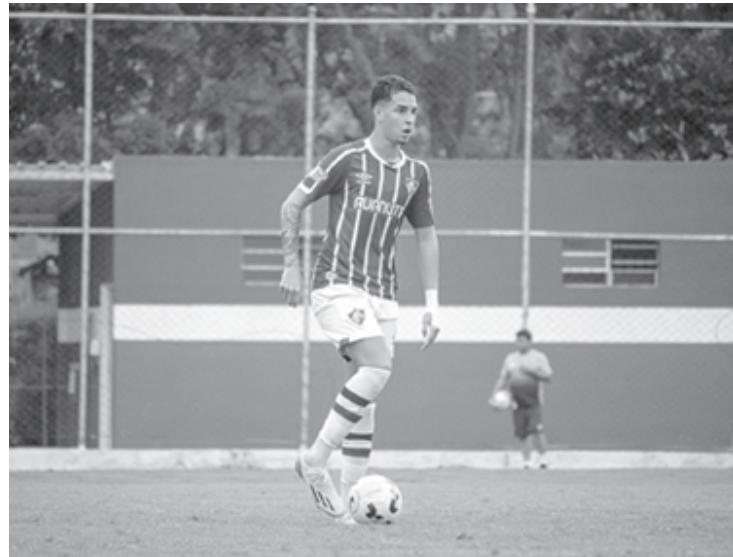
Tricolor recebe o Atlético (MG), nesta quarta-feira (24), visando à ponta do Grupo B