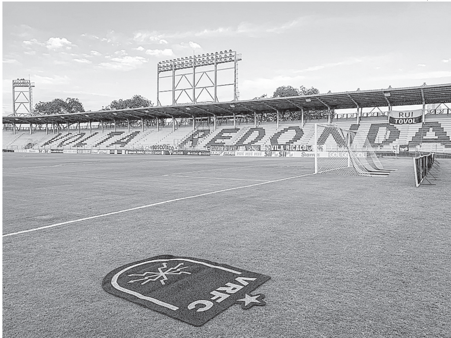
A primeira partida do Volta Redonda no estádio será na quinta-feira