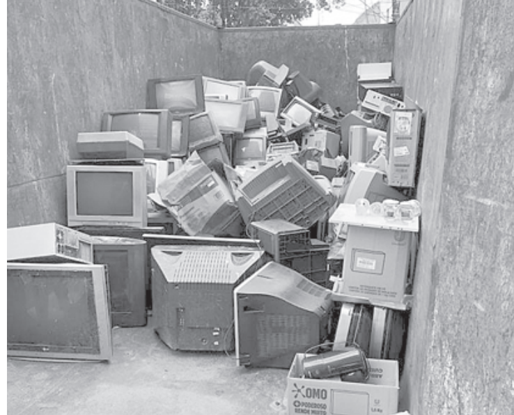
Evento tem o objetivo de recolher eletroeletrônicos e descartá-los corretamente