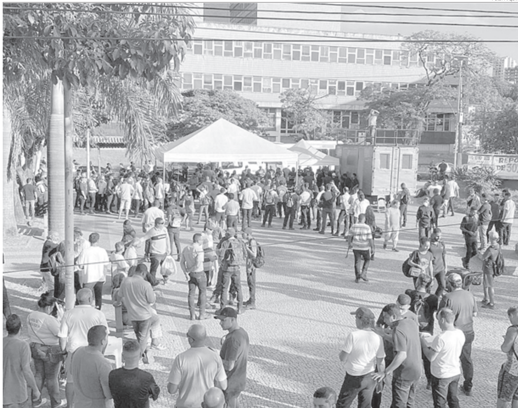
Resultado da eleição do Sindicato dos Metalúrgicos fica em suspenso até decisão do TST

A íntegra da decisão está disponível no site do DIÁRIO DO VALE.