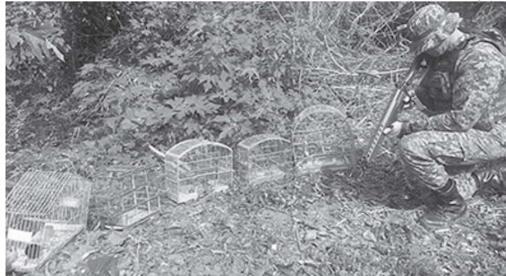
Aves foram levadas ao Centro de Triagem de Animais Silvestres (CETAS) em Seropédica

ficaram suspeitos de praticarem caça ilegal que, fugiram ao perceberem a chegada dos agentes. Durante diligências no entorno, os policiais localizaram duas gaiolas de madeira, uma gaiola de ferro e uma gaiola alçapão e em seu interior havia seis tizis, um canário e um chipim, todos sem anilhas de identificação junto ao IBAMA. Diante dos fatos, os agentes da UPAm procederam à 167ª DP, onde a ocorrência foi registrada, enquanto que as aves foram levadas ao Centro de Triagem de Animais Silvestres (CETAS) em Seropédica, onde serão devolvidos ao habitat natural.