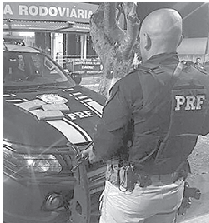
Droga estava em uma mochila

No mesmo dia, os agentes da PRF realizaram outro flagrante de droga, na Via Dutra, Km 318, em Itatiaia. Um homem e uma mulher, que estavam em um veículo Corolla, foram flagrados transportando uma pequena