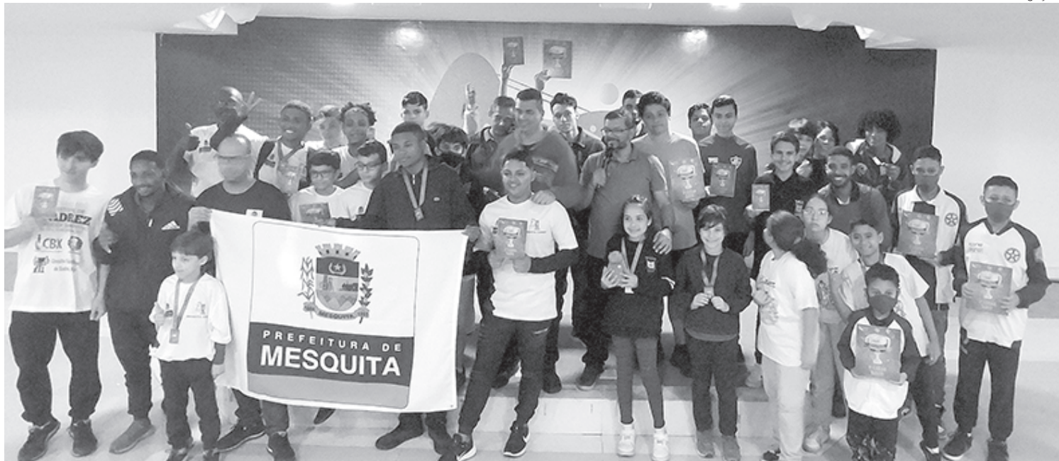
A competição garantiu vaga gratuita para o Brasileiro de 2023