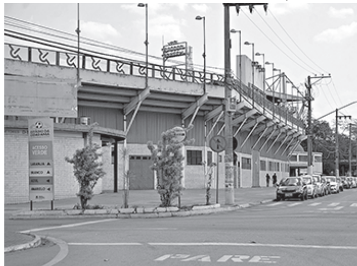
Forças de segurança estão preparadas e aptas para prestar serviço de qualidade no Estádio da Cidadania e seu entorno

De acordo com o comandante da GMVR, inspetor