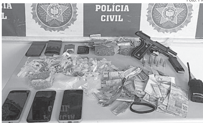
Drogas apreendidas em Barra Mansa foram levadas para a delegacia

Ainda na quinta-feira, policiais militares prenderam um jovem de 25