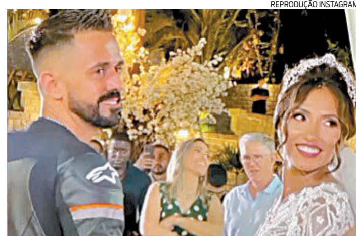
Comemoração do casal terminou da 62ª DP (Imbariê)

O subtenente era lotado na Diretoria Geral de Pessoal e estava adido, ou seja, era um militar da ativa que seguia recebendo remuneração, mas não cumpria expediente. Ele ingressou na corporação no ano de 1997. Somente neste ano, 29 agentes da PM foram mortos, vítimas da violência.