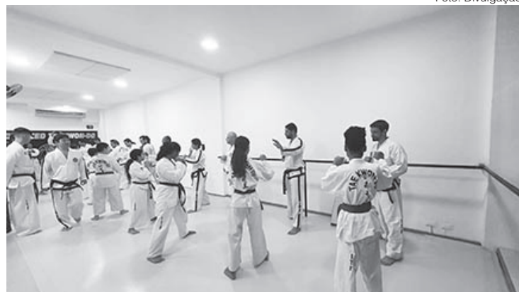
Evento gratuito terá participação de campeões Panamericanos e atletas da Seleção Brasileira

ção de campeões Panamericanos e atletas da Seleção Brasileira de Taekwon-do, que competiram no mundial da Holanda, em julho. A competição será nas modalidades luta e forma, que acontecerão ao longo do domingo. Haverá representantes em várias faixas etárias, desde o infantil até o sênior, no masculino e feminino. No sábado, será o treinamento para os árbitros, etapa importante para garantir a padronização na avaliação técnica.