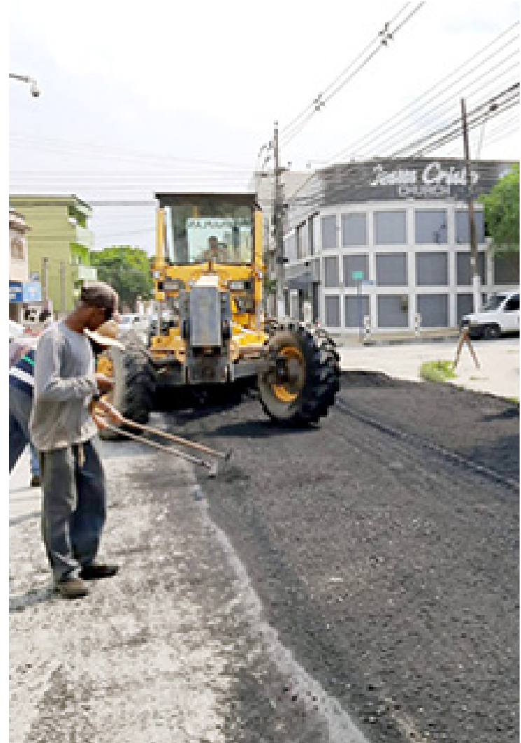
Avenida Francisco Crisóstomos Torres, no São Luiz, foi asfaltada entre a subida da Candelária até a entrada do São Sebastião