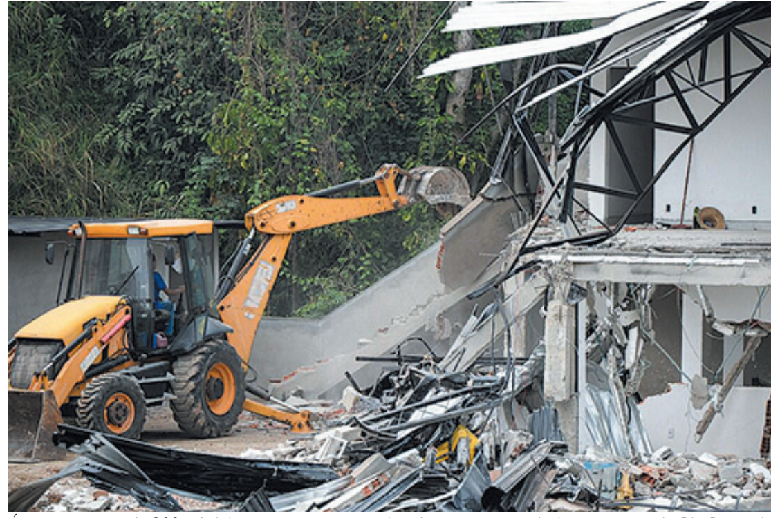
Área com cerca de 200 m² tinha estrutura para receber festas e até um deck às margens do Rio Bananal e da Via Dutra, em Barra Mansa

Uma construção irregular em área pública foi demolida na manhã desta quinta-feira (22), por equipes da prefeitura de Barra Mansa. A área com cerca de 200 metros quadrados está situada no bairro Bocaininha, às margens do Rio Bananal e da Rodovia Presidente Dutra. No local haviam estruturas para lazer, como churrasqueira, banheiros, e cômodos para instalação de um possível bar. Além disso, um extenso pátio e um deck com capacidade para receber centenas de pessoas. Segundo a prefeitura, a Guarda Municipal Ambiental vinha realizando fiscalizações e notificações ao responsável pelas obras desde o final de 2021, no entanto, ele teria seguido com a construção. CIDADES | Página 5