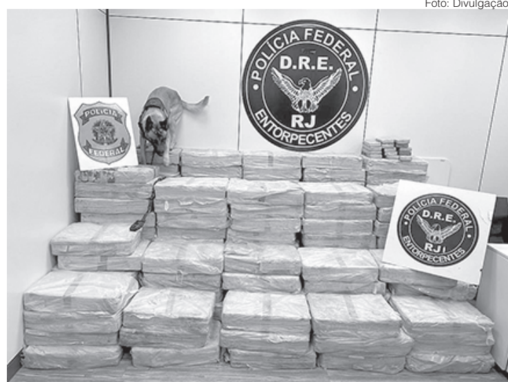
Droga estava em um fundo falso na carroceria de uma carreta