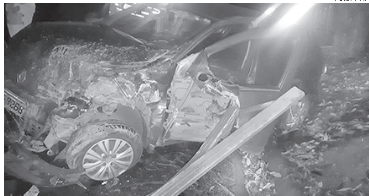
Rio X Caxambu: Condutor do Sandero sofreu alguns ferimentos