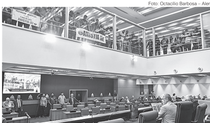
Representantes de torcidas organizadas assistiram votação do projeto de lei que as anistia

As torcidas beneficiadas com a medida serão a Fúria Jovem (Botafogo), Raça Rubro-Negra e Torcida Jovem (Flamengo), Young Flu (Fluminense) e Força Jovem (Vasco). “A aprovação