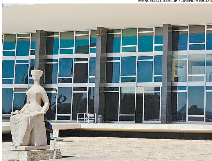
O placar está 6 a 5 a favor da 'revisão da vida toda' no Supremo

A tendência é que a regra seja aprovada. A maioria dos ministros já votou a favor da "revisão da vida toda" em março. A análise foi suspensa por pedido de vista do ministro Kassio Nunes Marques. O placar estava em 6 a 5. O relator era o ministro Marco Aurélio, que se aposentou após dar voto favorável. Ele foi substituído por André Mendonça,