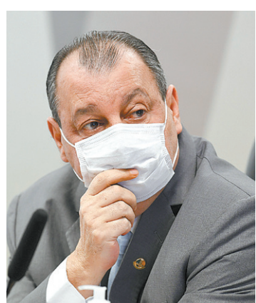
Presidente da CPI, Omar Aziz

O uso dos dois modelos do Pix aos usuários da ferramenta é opcional, cabendo a decisão final aos estabelecimentos comerciais.