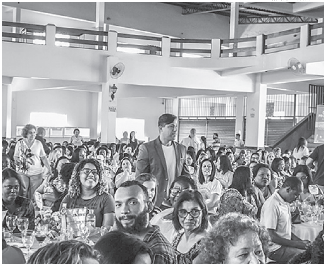
Prefeito Mário Esteves cumprimentou os educadores presentes ao evento e ratificou o seu compromisso com investimentos na educação

Além disso, o prefeito lembrou dos investimentos aplicados na reforma e reestruturação de 25 escolas municipais, que foram padronizadas. Mário Esteves falou da qualidade na confecção e distribuição de uniformes escolares, bem como da adequação da merenda escolar, no setor de Nutrição e ainda ressaltou a aquisição de 9 mil tablets, que estão sendo usados como ferramentas na educação contemporânea e que foram distribuídos aos alunos da rede municipal.