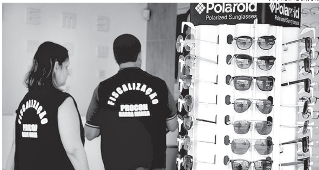
Equipe visitou cerca de 30 estabelecimentos para orientar comerciantes sobre os próprios direitos e dos consumidores