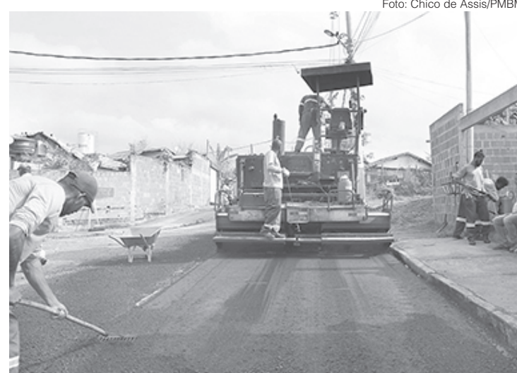
Desde que parceria com governo estadual foi firmada, cerca de 40 ruas já foram asfaltadas em Barra Mansa