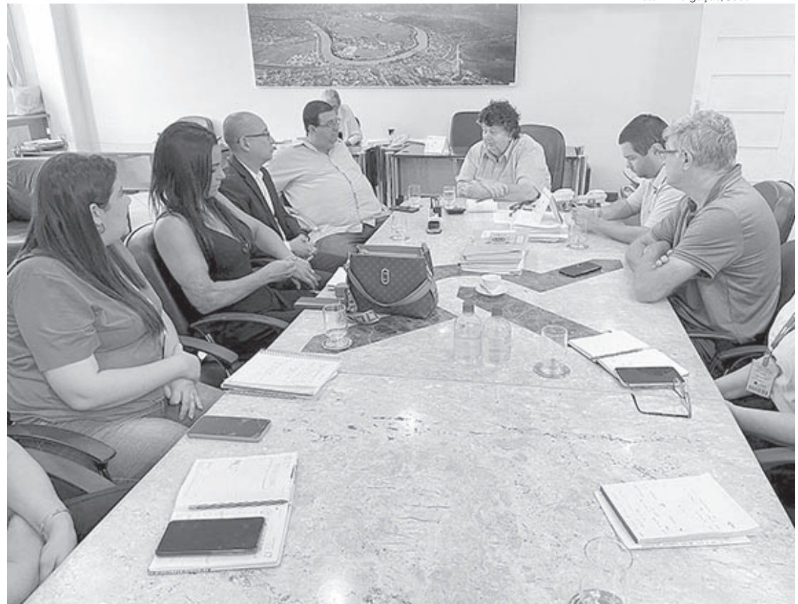
Reunião acertou que com novas vans, Centro Dia Synval Santos passará a atender 90 idosos em novembro

“Conseguimos, durante todos esses anos à frente da Smac, realizar muitos projetos que mudaram a vida de muitas pessoas para melhor. Com a compra de novos carros, teremos a possibilidade de fazer muito mais. O maior objetivo do trabalho da secretaria é cuidar das pessoas, principalmente daquelas que mais precisam. Com todos esses investimentos, sem sombra de dúvidas, 2023 será o ano do social em Volta Redonda”, concluiu o ex-secretário.