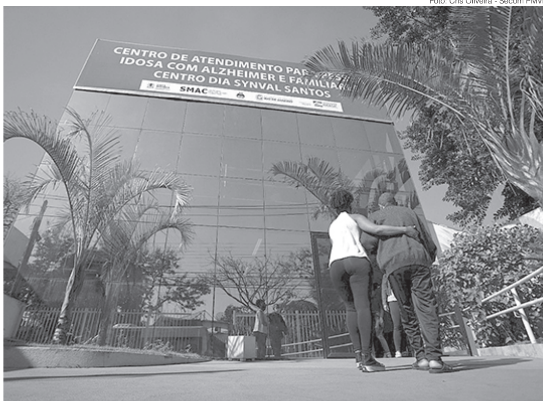
Centro Dia Synval Santos serve de referência no atendimento a pessoas com o Mal de Alzheimer

“Levando em consideração que como a expectativa de vida aumentou, também surgem os problemas ligados a cognição, as demências, epidemiologicamente falando. Nosso foco seria as