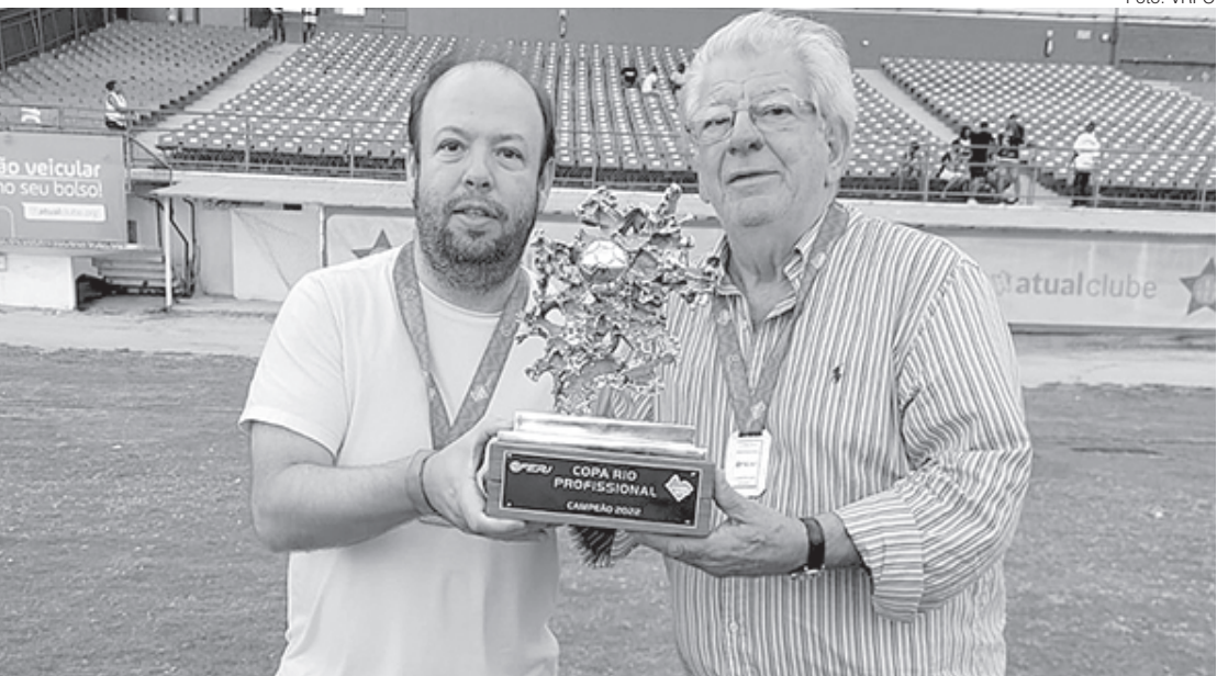
Presidente tricolor já começa a pensar em 2023, que terá mais um ano de calendário cheio