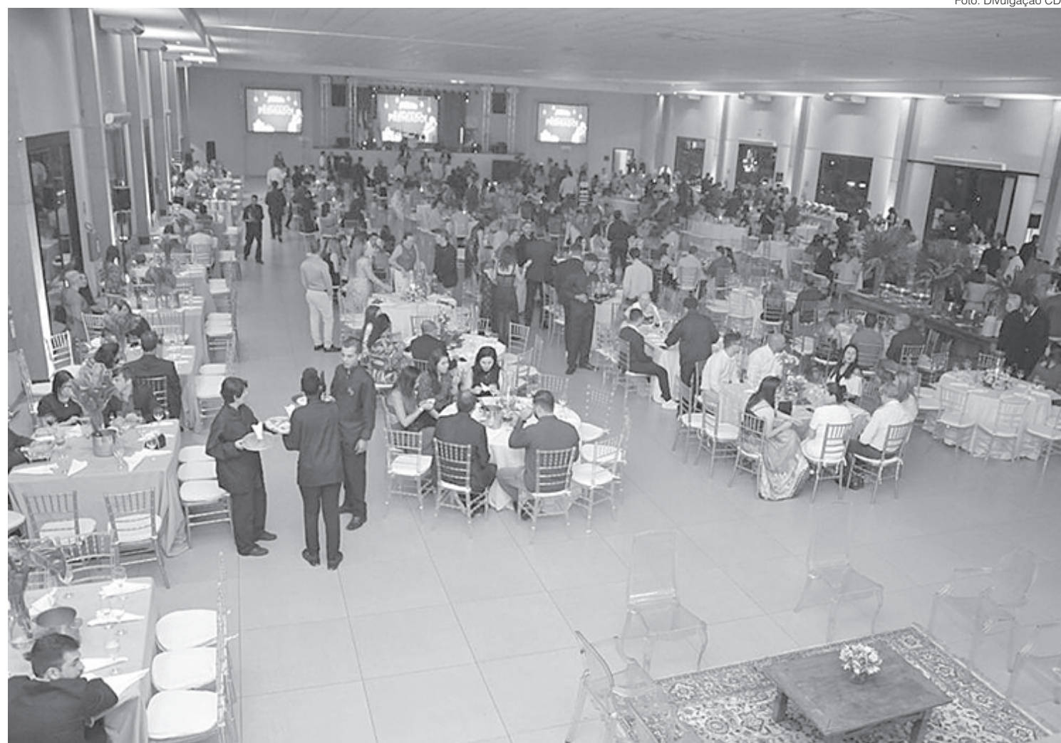
Festa da CDL-VR serviu também para o lançamento da campanha 'Natal Família'

Durante o evento, também foi feito o lançamento da campanha Natal Família, que este ano vai sortear 50 vales-compra, com valores entre R$ 500 e R$ 1.000,00, para os consumidores que comprarem nas lojas partici-