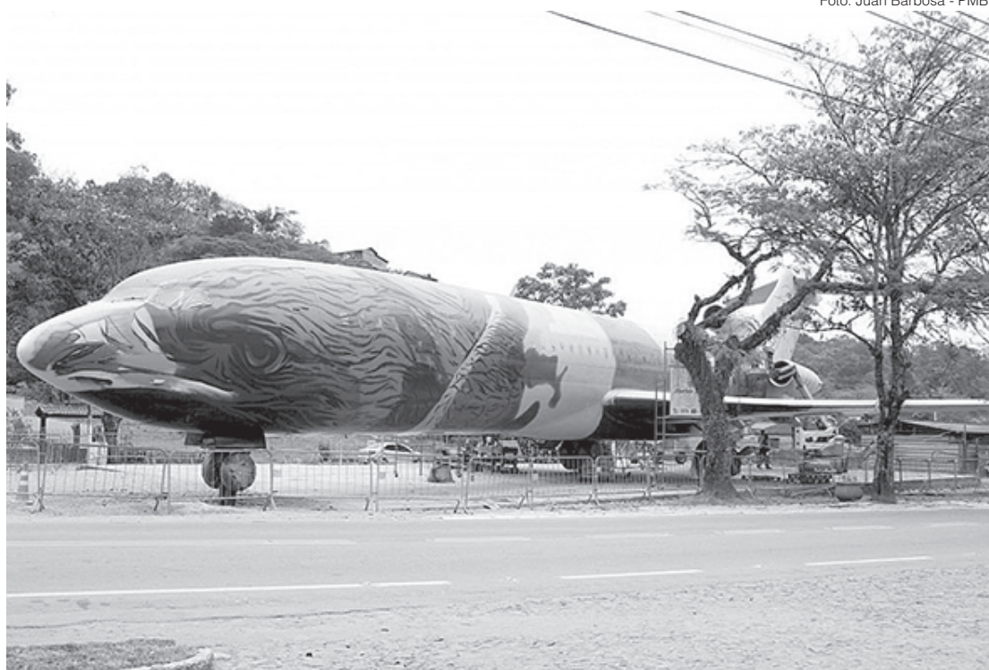
Avião está sendo customizado com cenas que marcam a natureza e acontecimentos de Ipiabas

Dentre as obras mundiais executadas e apontadas por Marlon Muk como as suas preferidas, estão a indígena em Pádova, na Itália, e um autorretrato pintado no Peru. No país europeu, conforme disse, ele fez um desenho de uma indígena, em três dias, num mural. O cocar da nativa, formava a bandeira do Brasil. Já na nação latina, ele pintou o seu rosto, e, sobre a cabeça, uma coroa do povo Inca, que foi muito noticiado na época,