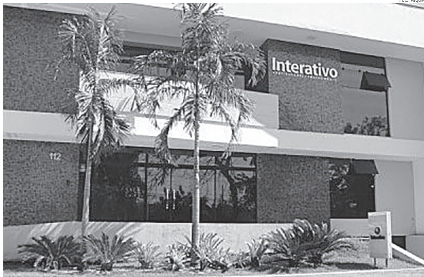
Colégio Interativo declarou, em nota, que veda manifestações políticas, partidárias ou ideológicas