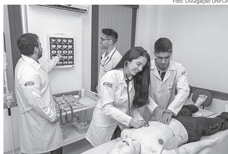
Curso de Medicina do UniFOA recebeu conceito 'muito bom'

Confira os cursos do UniFOA que foram avaliados com nota 4 (muito bom): - Engenharia de Produção - Ciências Contábeis - Ciências Biológicas (Licenciatura)