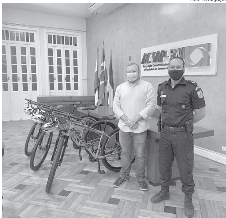
Dois policiais circularão pelo Centro da cidade fazendo a ronda