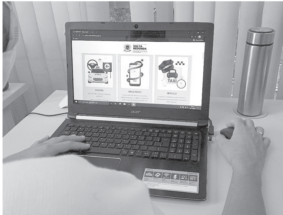
Site ajuda motoristas a se cadastrarem no aplicativo Taxi.Rio.Cidades