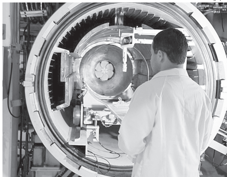
Autoclave faz parte do conjunto de equipamentos usados na INB