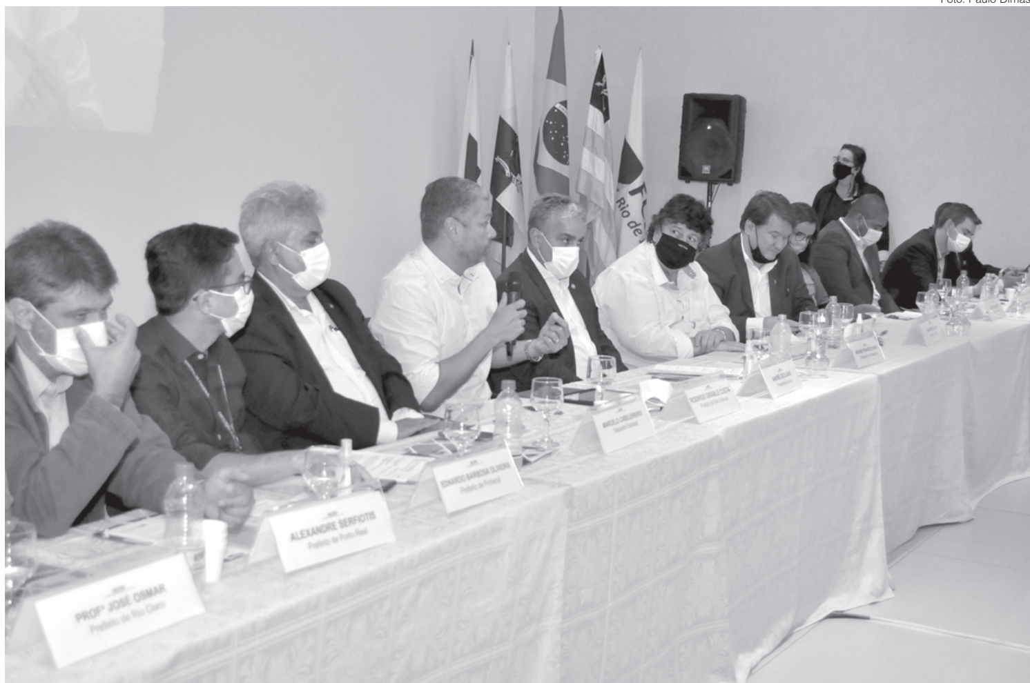
Prefeitos aproveitaram evento na CDL-VR para debaterem sobre o Fundo Soberano

Outra demanda em relação à carga tributária é a melhora do sistema tributário simplificado no Estado do Rio. Ceciliano apresentou um projeto ampliando o teto de arrecadação das pequenas empresas de R$ 3,6 milhões para R$ 4,8 milhões por ano e garantir a manutenção das empresas que não conseguem pagar o imposto simplificado. O texto altera a lei que regulamenta a aplicação do Estatuto da Pequena Empresa no estado do Rio.