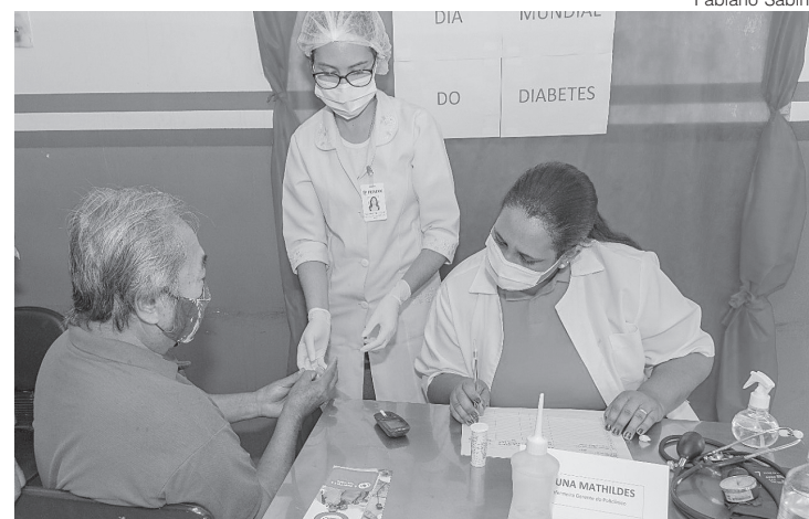
Intuito foi alertar para sintomas e tratamento da diabetes

Os profissionais de saúde explicam que existem o diabetes tipo 1 e o tipo 2, sendo a 1, resultante da destruição autoimune das células produtoras de insulina. O diag-