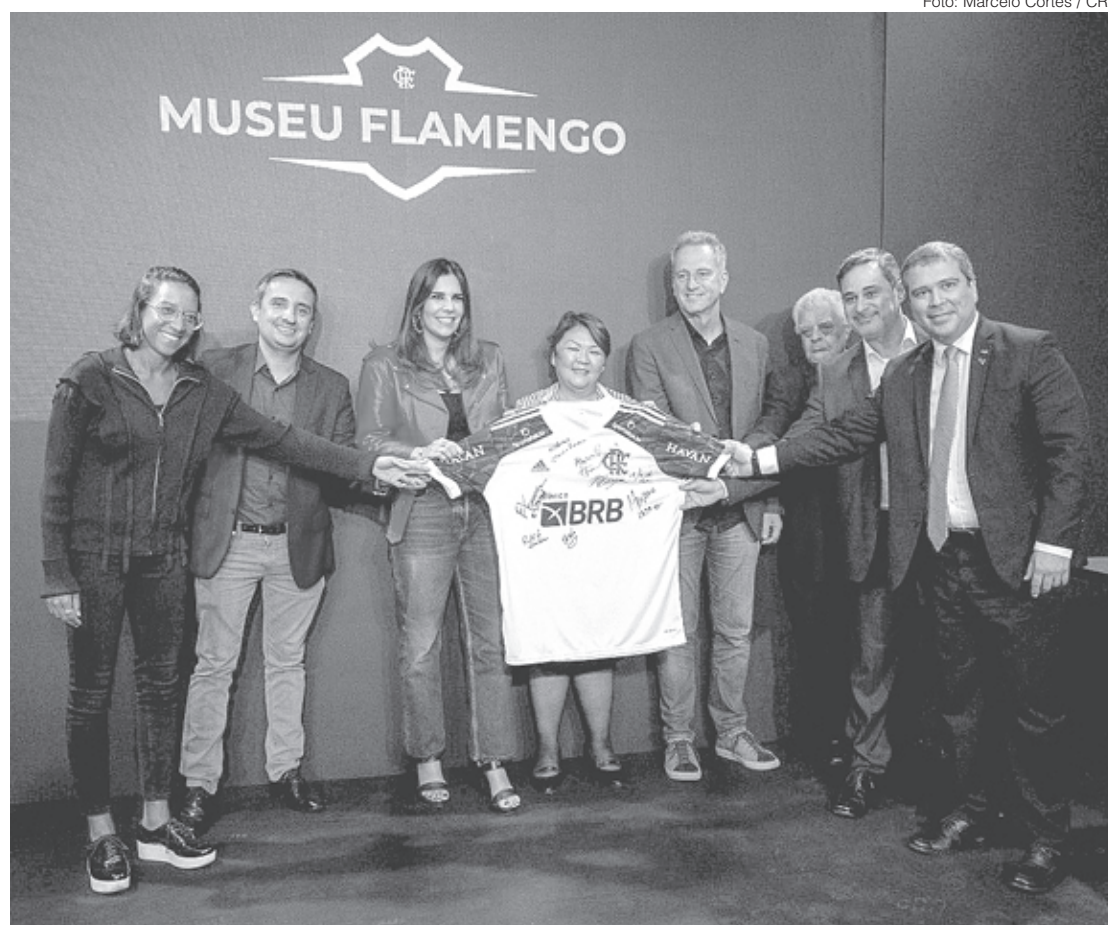
Novo Museu Flamengo vai ocupar inicialmente um espaço de 1200 m² na sede da Gávea

um espetáculo interativo e impactante, com soluções de Inteligência Artificial que tornarão a experiência dos visitantes ainda mais emocionante. E essa experiência não se resume ao espaço na Gávea, uma vez que o futuro Museu terá também um ambiente digital online, em que os visitantes terão acesso a outros conteúdos e atrações.