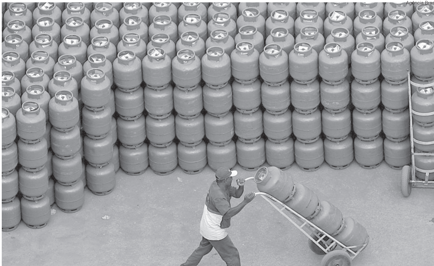
Sem ICMS, expectativa é que haja queda no preço do botijão de gás de cozinha