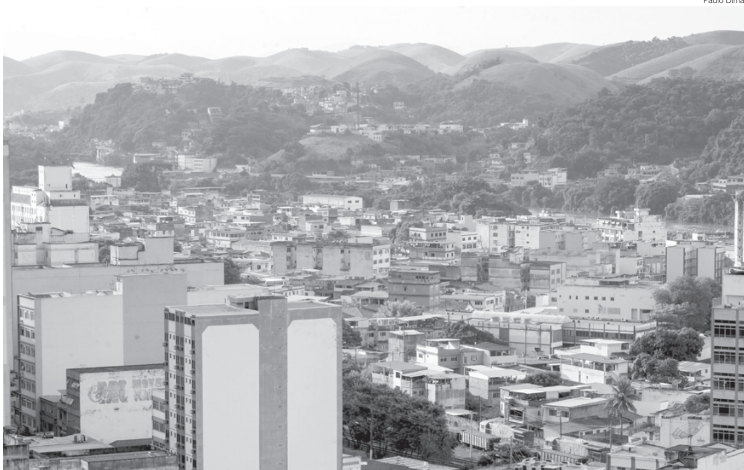
Barra Mansa terá 'Domingão de Compras' com foco na Black Friday

Assim como nas edições anteriores, as atividades vão seguir as orientações e protocolos especiais em relação à pandemia do coronavírus, respeitando os protocolos de segurança. O evento contará com o apoio da Associação Comercial Industrial e Agro Pastoral de Barra Mansa (Aciap), Câmara de Dirigentes Lojistas (CDL) e Sindicato Comércio Varejista (Sicomércio).