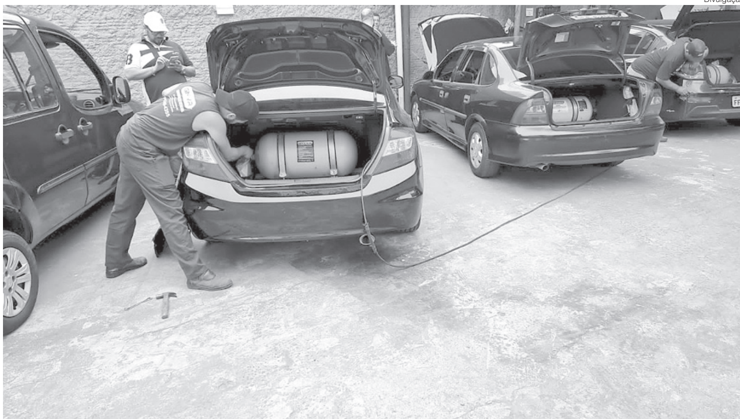
Com a gasolina cara, mesmo quem roda pouco está optando pelo GNV para economizar

- Sem dúvidas a procura cresceu muito nos últimos meses por causa do preço da gasolina e, agora nessa