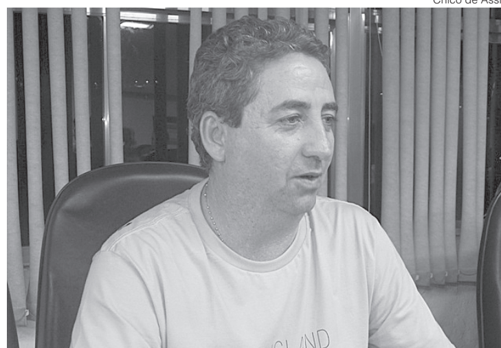
Beleza afirma que agricultura em áreas próximas da cidade aproxima produtor e consumidor

Os produtores interessados no projeto devem se encaminhar à Secretaria de Desenvolvimento Rural, situada no Parque da Cidade, no Centro. Mais informações podem ser obtidas através do telefone (24) 2106-3547.