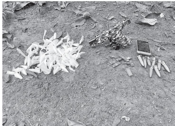
Material foi entregue na 93ª DP

Em outra ocorrência, três jovens, sendo dois de 14 e um de 16 anos, foram detidos pela PM, na Rua Açude I, em Volta Redonda, também na terça-feira (9). Durante a ação, 09 unidades de maconha, 86 pinos de cocaína, uma pistola 9mm com a numeração raspada, 15 munições do mesmo calibre e R$147,00 em espécie, foram apreendidos. Segundo a Polícia Militar, os jovens, encaminhados para 93ª DP, foram ouvidos e autuados, permanecendo apreendidos.