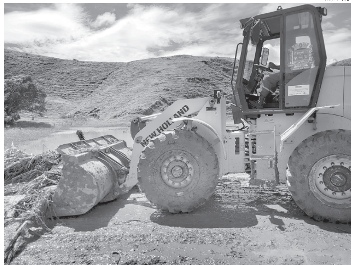
Máquinas estão trabalhando para recuperar estradas no distrito de São José do Turvo