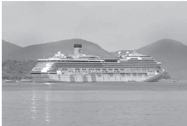
Quantidade de navios que atracarão em Angra supera expectativas

“Estou muito feliz de estar em Angra. Esta cidade é fantástica e quero voltar em breve aqui para passear. Um grande