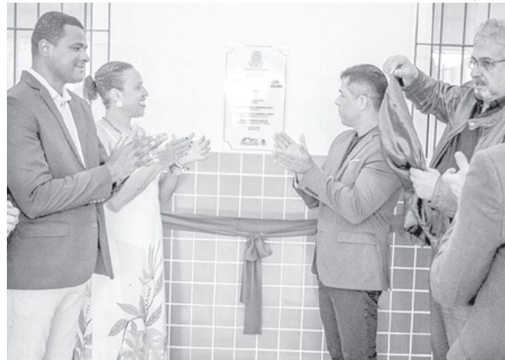
Trabalhos foram realizados pela Secretaria de Obras Públicas e seguiram padrão das outras 25 unidades de ensino construídas pelo atual governo