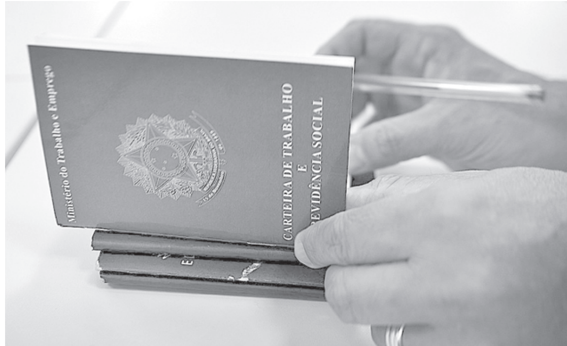
Quase cinquenta milhões de brasileiros têm empregos formais

rais", complementa a parlamentar. Os jovens de até 29 anos de idade corresponderam a 27,3% do estoque de vínculos ativos no ano. A maioria dos vínculos foi de trabalhadores com ensino médio completo (51,5%). As mulheres responderam por 44,2% dos vínculos, enquanto os homens por 55,8%. Mesmo com a diferença, o número de vínculos de mulheres aumentou mais do que o de homens (6,88% e 4,24%, respectivamente). Desempenho regional A elevação foi registrada em todas as regiões do país, com destaque para o Nordeste, que teve salto de 7,92%; e Norte, com 6,30%. Entre os estados, os melhores desempenhos relativos do estoque estão o Tocantins, com 10,92%; e Amazonas, com 10,40%. Os dados mostram, ainda, que, todos os setores tiveram variação positiva, com destaque para a construção civil, que registrou a maior variação relativa, com 9,55%. Na sequência aparece a indústria, com 5,82%. O se-