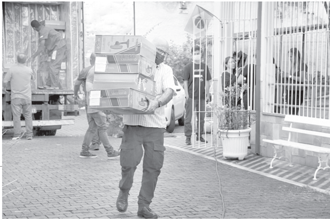
Chico de Assis / PMMB

Entre os itens entregues pela Secretaria de Assistência Social estão colchões, ventiladores, computadores, multiprocessadores e batedeiras