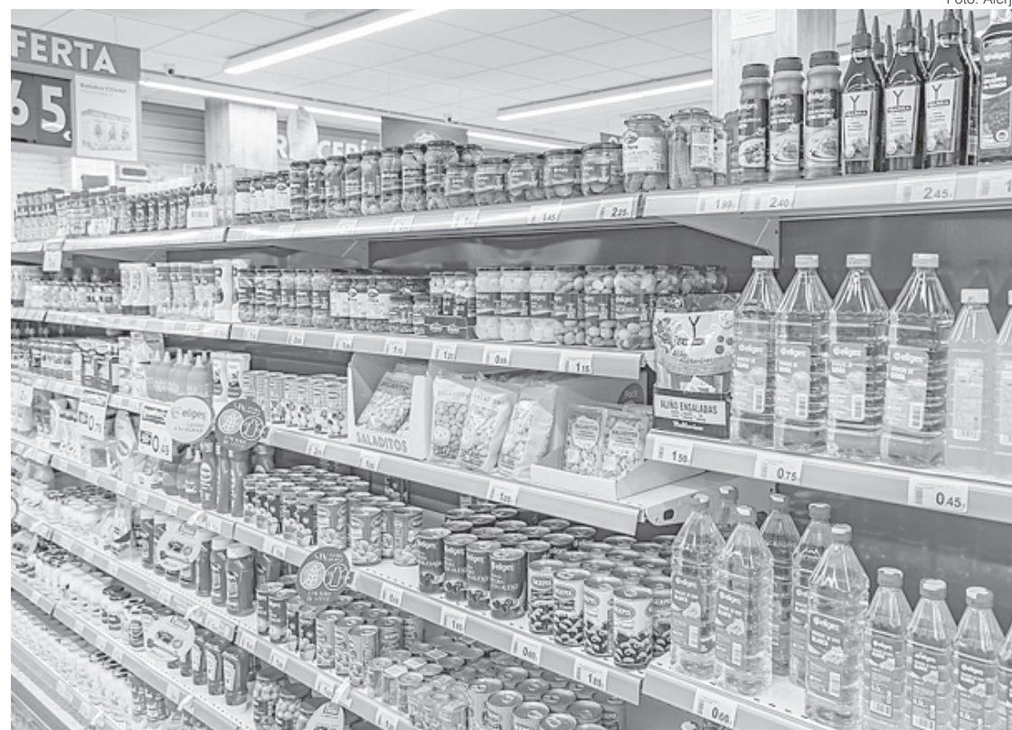
Comércio terá que identificar produtos com defeito ou perto da data de vencimento

Esta lei entra em vigor na data de sua publicação e os estabelecimentos comerciais têm o prazo de 60 (sessenta) dias para se adequarem. O Poder Executivo deverá regulamentar a norma.