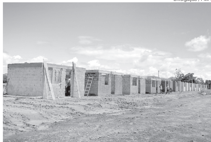
Unidades habitacionais estão sendo construídas no bairro Freitas Soares