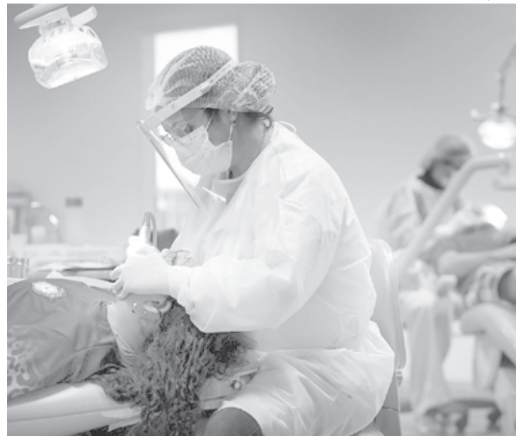
Serviço passou por reestruturação em 2021 e neste ano número de atendimentos triplicou

A Prefeitura de Volta Redonda também oferece atendimento de emergência 24h no Hospital Doutor Nelson Gonçalves, antigo Cais Aterrado.