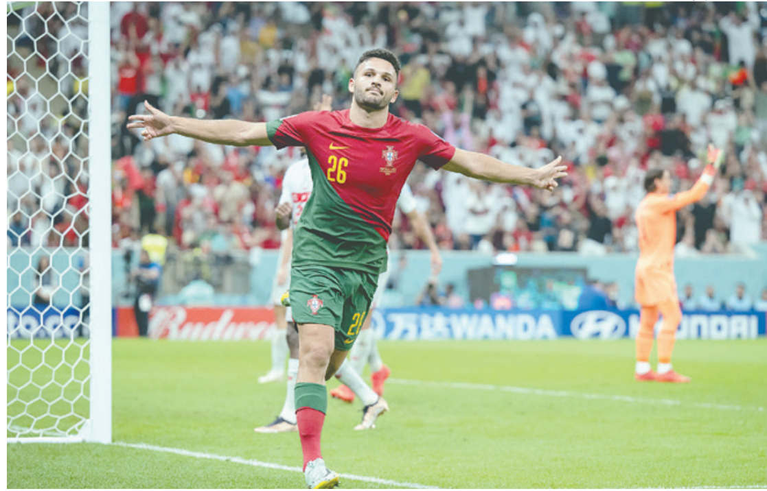
Surpresa na escalação de Portugal, Gonçalo Ramos marcou o primeiro hat-trick da Copa de 2022.

O astro até tentou marcar e se igualar a Eusébio como o maior artilheiro da equipe em Copas. Mas quem fechou o placar para os portugueses foi Rafael Leão, já nos acréscimos com um chute cruzado.