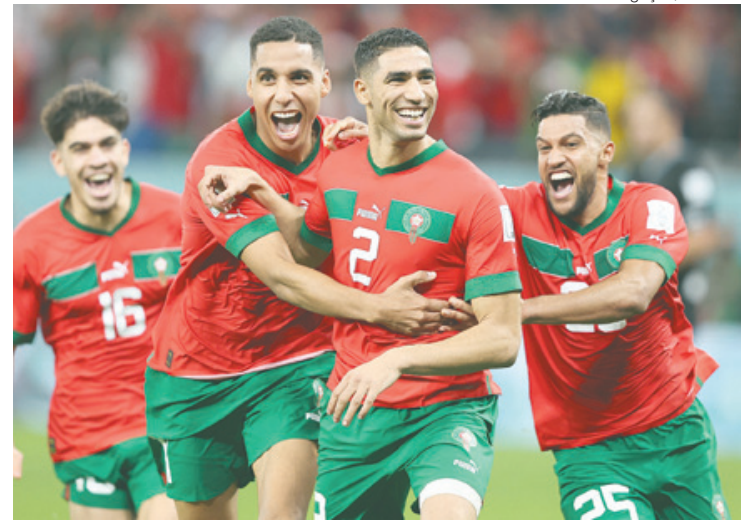
Lateral Achraf Hakimi (ao centro), nascido em Madri, bateu o pênalti decisivo que garantiu Marrocos na fase seguinte

O duelo, truncado, foi à prorrogação. O maior desgaste físico, apesar de as equipes manterem as respectivas estratégias, provocou os dois lances mais perigosos da partida. Aos quatro minutos do primeiro tempo extra, Cheddira recebeu do meia Azzedine Ounahi, entre os zagueiros Rodri e Laporte, mas bateu em cima do goleiro Unai Simon. Já no último lance da segunda eta-