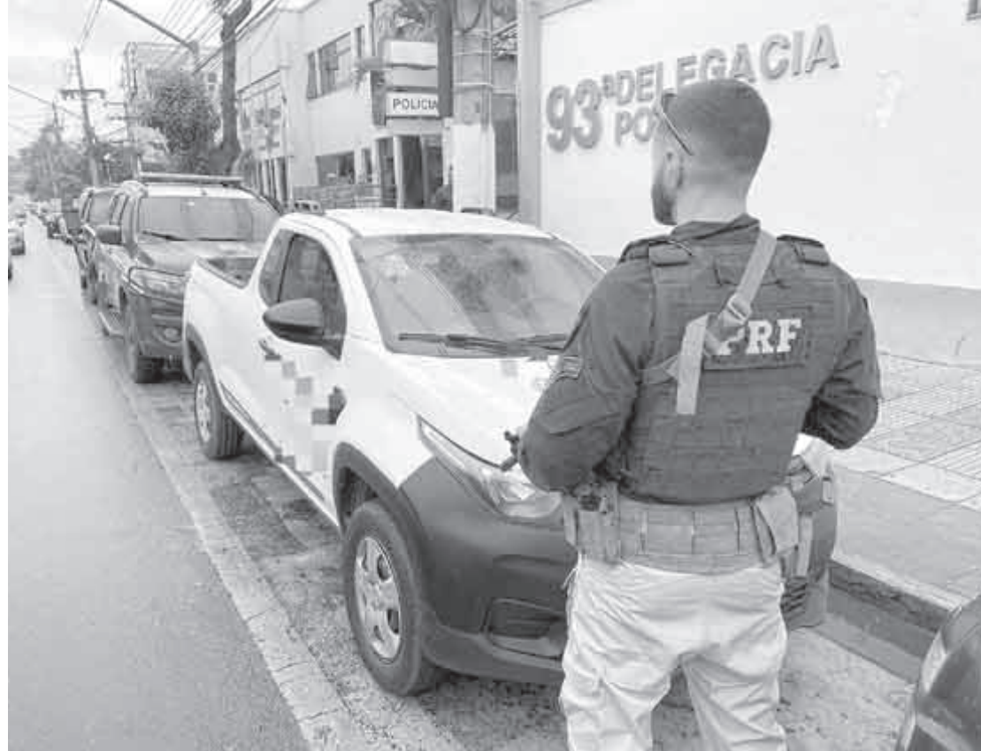
Fiat Strada avaliado em mais de R$ 82 mil tinha registro de roubo em São Gonçalo e foi achado em Volta Redonda

Questionado, o proprietário da loja e responsável pelo veículo alegou que o carro teria sido herdado do pai, há cerca de 10 meses, sendo que o homem teria o comprado em Pedra Bonita-MG. Ele foi