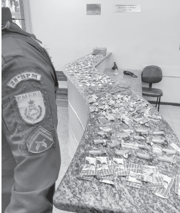
Policiais apreenderam em área de mata: 250 trouxinhas de maconha, 100 pedras de crack e 16 pinos de cocaína

Ao chegarem no endereço indicado, na Rua Vereador Joaquim Boa Morte, os policiais viram suspeitos fugindo para uma área de mata. Os agentes vasculharam a região, mas ninguém foi encontrado. Naquele local foram achadas as drogas, que foram apreendidas e levadas para a delegacia da Polícia Civil (90ª DP).