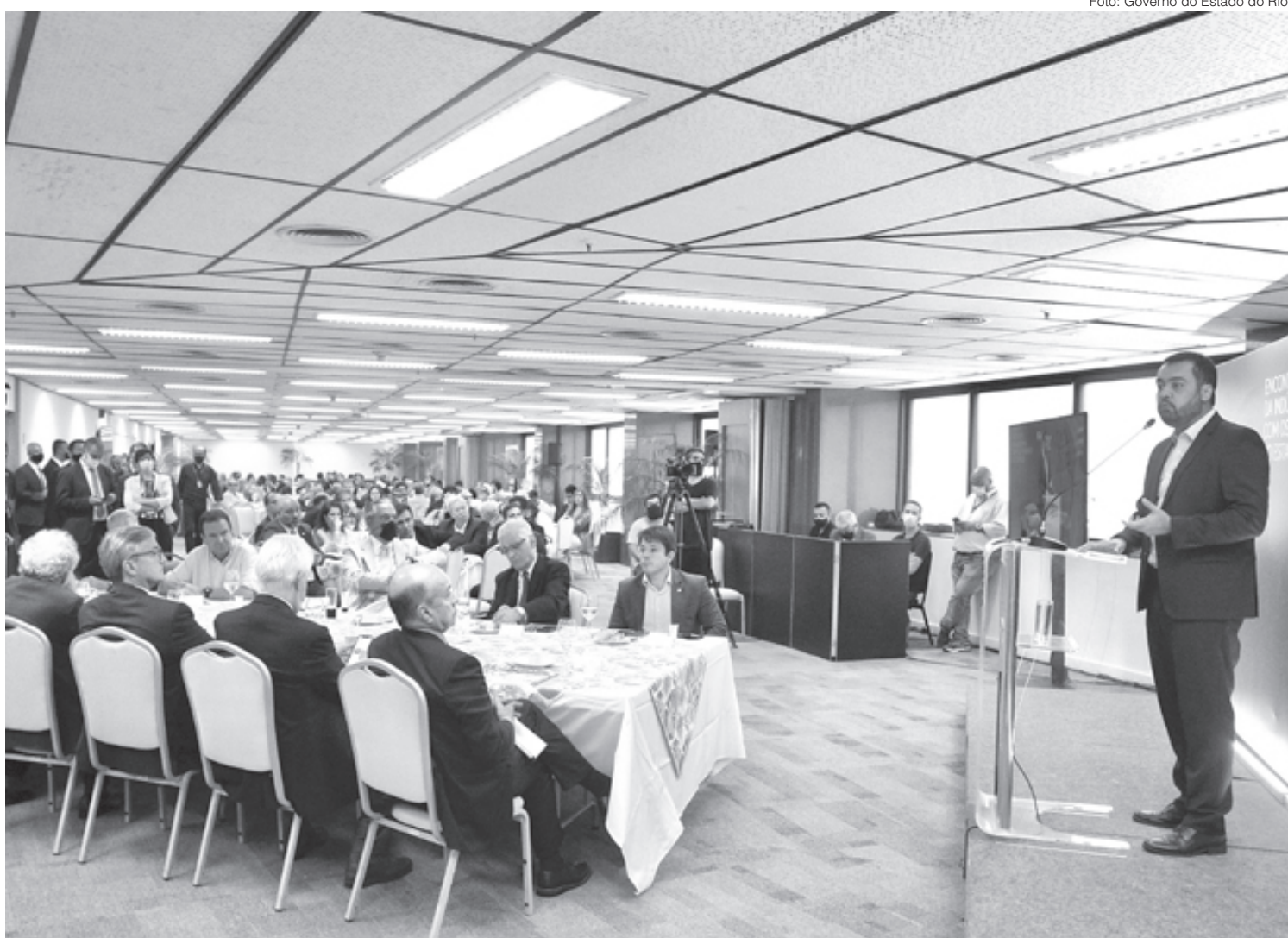
Governador fala durante encontro com industriais

Os números indicam que 2022 continuará com uma trajetória positiva. Pela primeira vez em cinco anos a Lei Orçamentária foi aprovada sem déficit, além de uma previsão de superávit histórico. A negociação da dívida com a União, através do novo Regime de Recuperação Fiscal, vai garantir ainda mais investimentos.