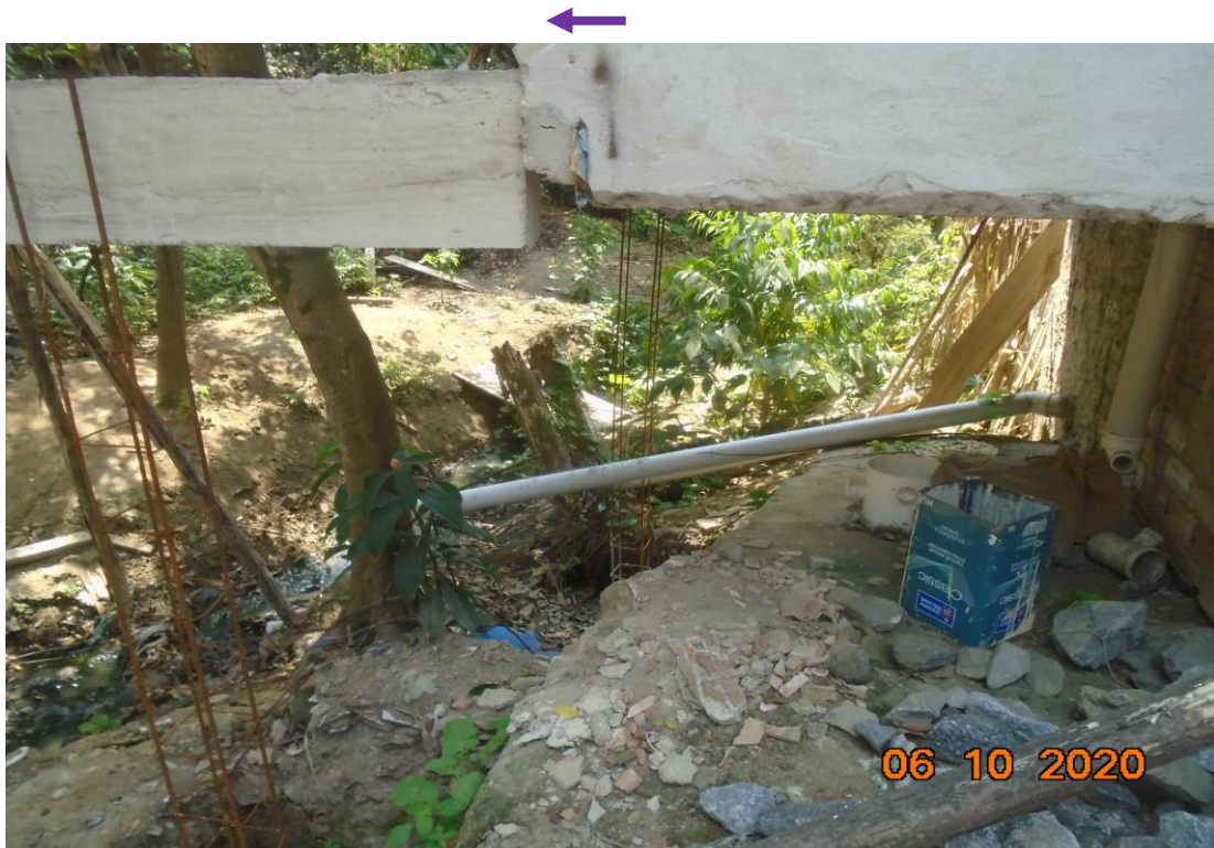
Figura 2: Vala