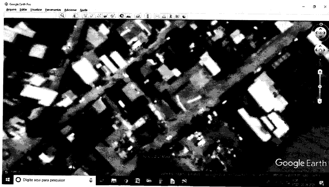
Imagem Google Earth de 01/04/2021 – 22°31'54,30" ; 44°08'32,69"