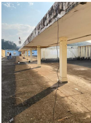
Carga manual de entulho

Serão demolidos a laje e os pilares existentes na circulação entre as casas da cobertura do Colégio.