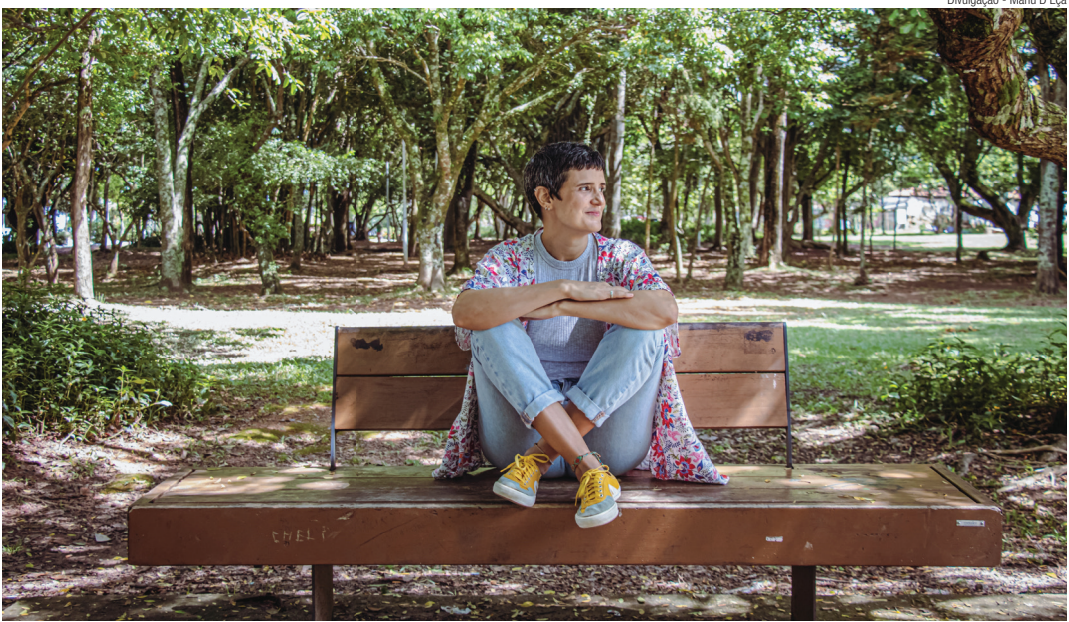
Escritora informa que a obra também reflete sobre temas atuais

As demais rodas de leitura ocorrerão em outras unidades do Sesc. Além do Sesc Três Rios, no dia 10 de outubro, às 15 horas, receberá também o projeto, o Arte Sesc, no dia 16 de outubro, às 19 horas; e, por fim, no Sesc São João de Meriti, no dia 23 de outubro, às 15 horas. O público-alvo de todas as apresentações são jovens e adultos a partir de 14 anos. Em todas as cidades onde