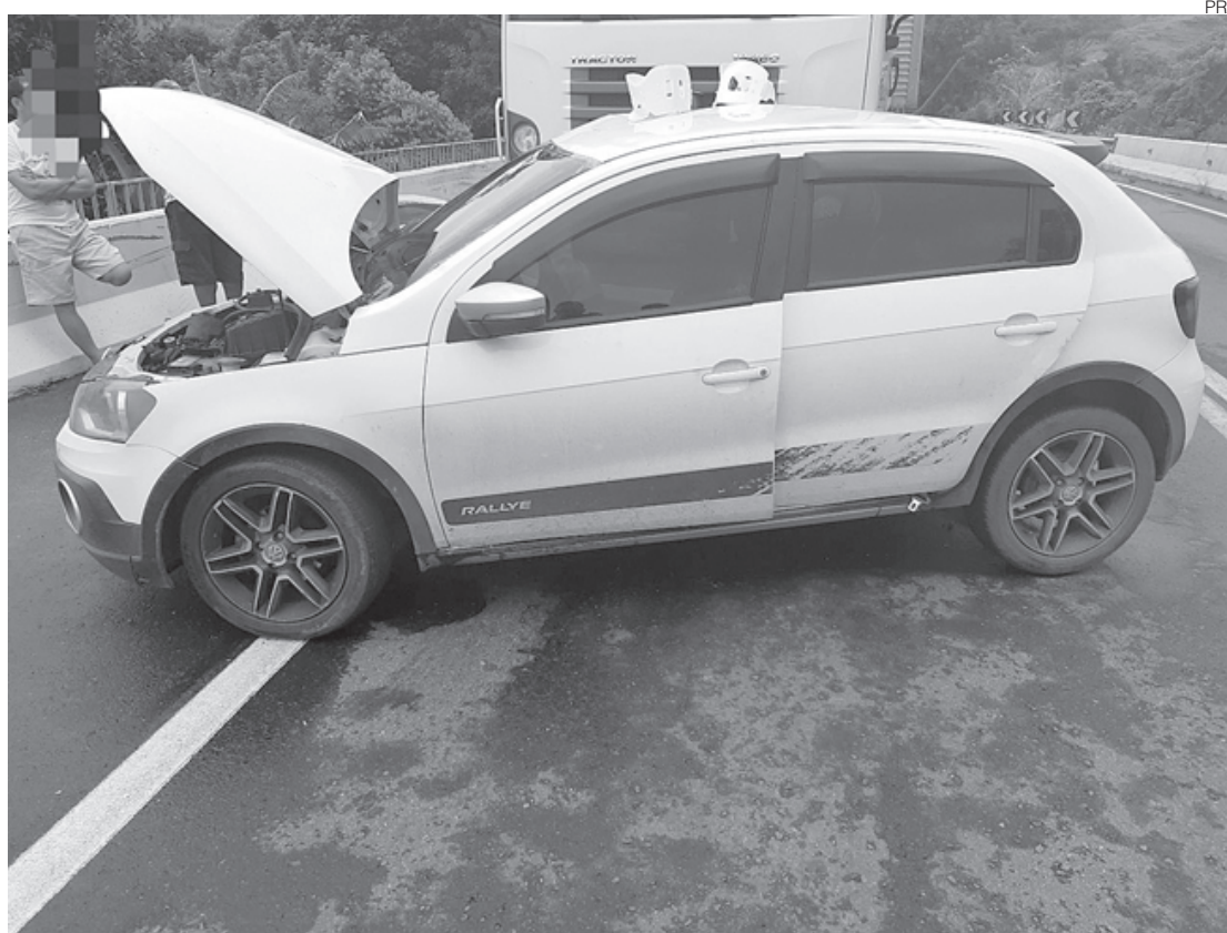
Vítimas têm idades entre 19 e 24 anos