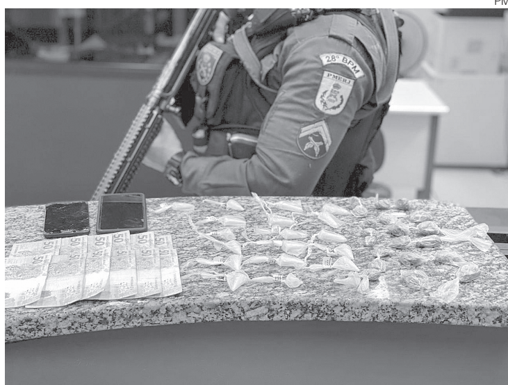
Ação foi no bairro Roberto Silveira

Em seguida, os PMs foram até a casa do rapaz, no mesmo bairro, onde encontraram um adolescente de 16 anos, além de 11 buchas de maconha e 19 pinos de cocaína. A mulher disse que não sabia da existência dos entorpecentes, mas que